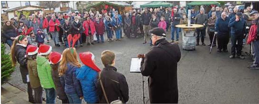
Der Kinderchor des Gesangsvereins Liederkranz erfreute die Weihnachtsmarktbesucher in Ahl.