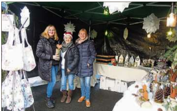
An hübsch dekorierten Ständen boten kreative Bürgerinnen schöne Geschenkartikel an.

AHL (PK). Die Ahler Bürger sind stolz auf ihren „kleinsten und feinsten Weihnachtsmarkt“, der den Reigen der gesamtstädtischen Weihnachtsmärkte kurz vor den Feiertagen abschließt.