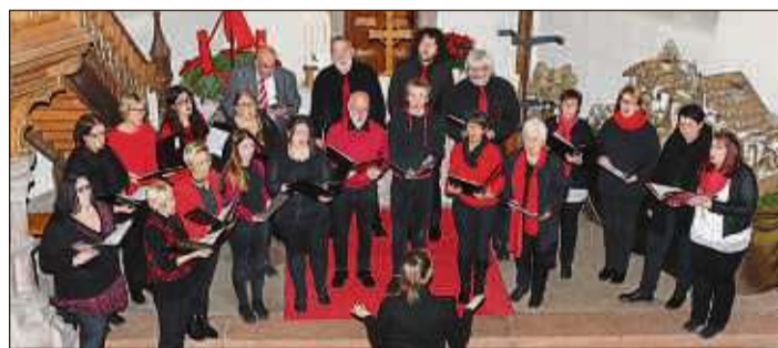
Zu den Mitwirkenden gehörte auch der Elmer Chor Good News.