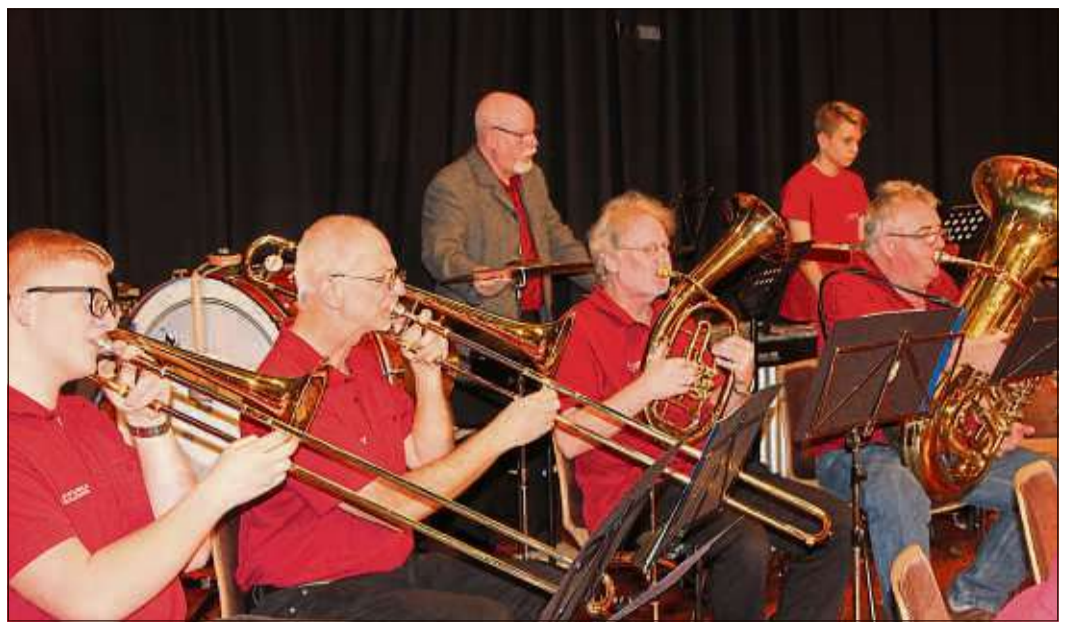
Mit dem Titanic-Medley setzte das Bläserorchester ein Glanzlicht.