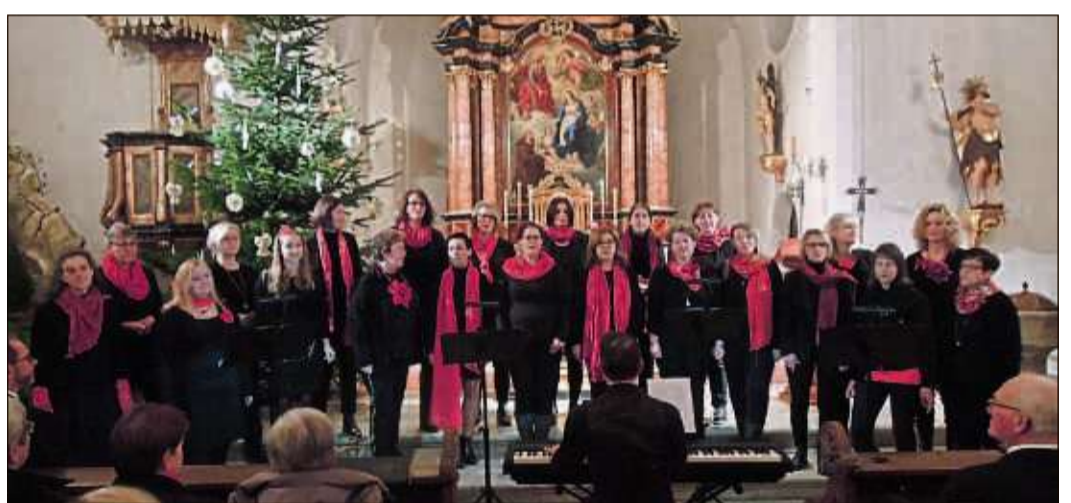
Moderne Weihnachtslieder präsentierten die „New Voices.“