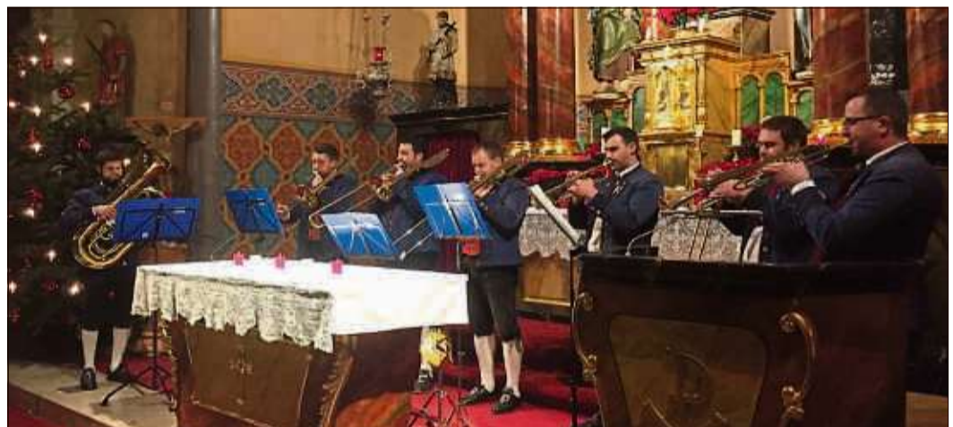
Die Turmbläser aus Weiperz eröffneten das festliche Konzert.