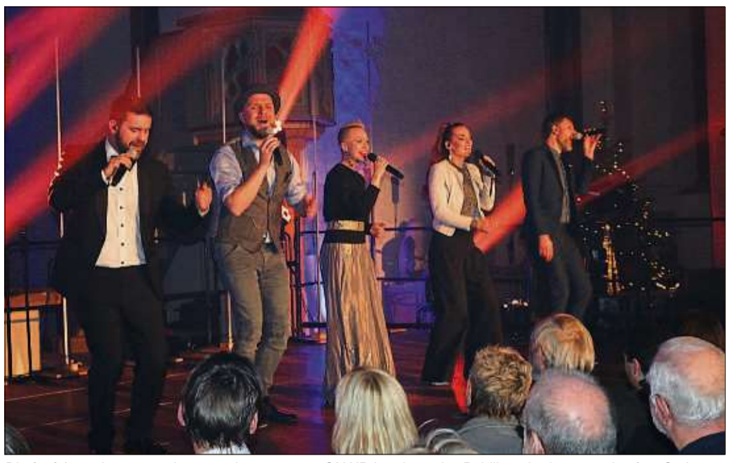
Die fünf Ausnahmesängerinnen und -sänger von ONAIR brachten das Publikum in der ausverkauften Steinauer Katharinenkirche zum Jubeln.

STEINAU (BWB). Das Konzert beginnt mit einem Wispern. Wie passend für eine Zeit, in der alles aufgeladen zu sein scheint mit Magie und das Wunder der Weihnacht wahr werden will. Das Wispern verdichtet sich zu sattem Klang, dessen Leuchten sich flugs in der ausverkauften Katharinenkirche in Steinau ausbreitet: Sie sind wieder da! Die mehrfach preisgekrönte A-Cappella-Band ONAIR aus Berlin gastiert zum zweiten Mal im Bergwinkel.