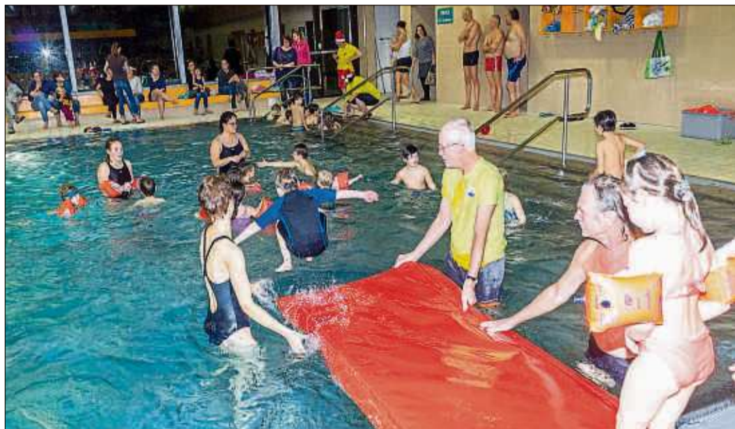
Am letzten Trainingstag vor der Weihnachtspause vergnügten sich die aktiven Kinder der DLRG-Ortsgruppe Schlüchtern mit Spielen im Bergwinkelbad.

Bevor die Kinder sich dann auf den Heimweg begaben, erhielten sie alle aus der Hand des Nikolaus beim Verlassen des Bergwinkelbades eine kleine Überraschung.