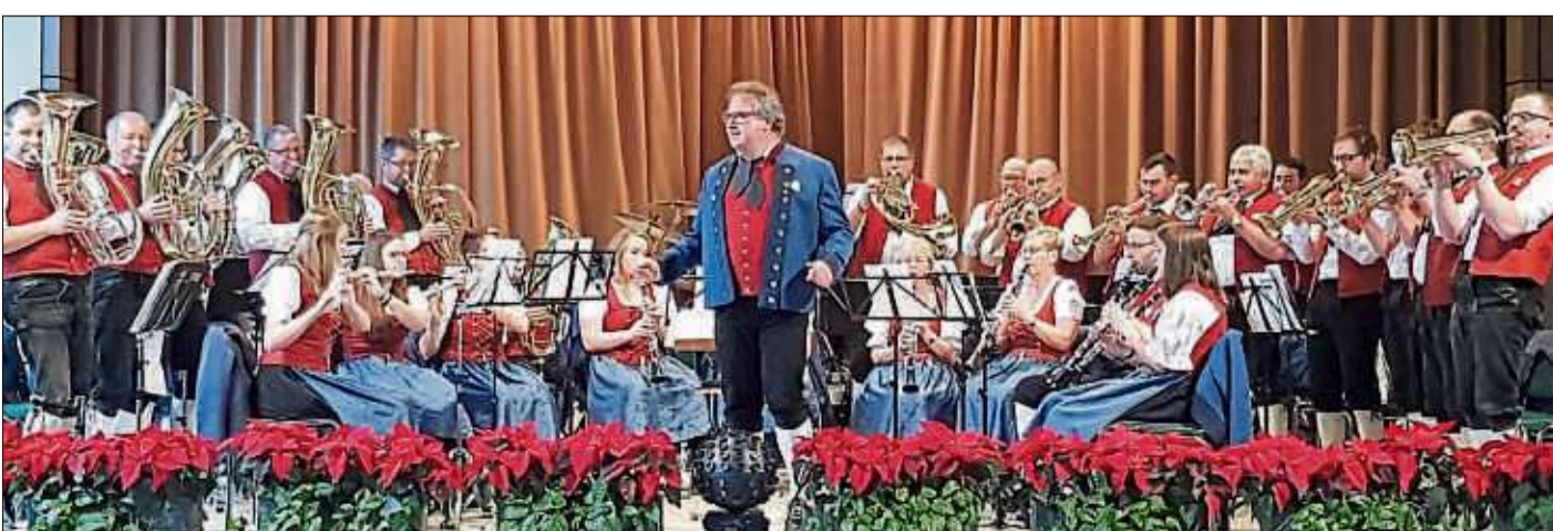
Die Trachtenkapelle Musikfreunde Weiperz erfreute zahlreiche Zuhörer bei einem Konzert in der Wandelhalle im Staatsbad Bad Brückenau.

Das Museum ist an diesen Tagen jeweils von 14 bis 18 Uhr geöffnet. Ab Januar 2020 gelten die üblichen Winteröffnungszeiten, jeweils Freitag bis Sonntag von 14 bis 18 Uhr. Von Montag bis Donnerstag ist das Museum geschlossen. Die „Barbie“-Ausstellung ist noch bis Ende Februar 2020 im Museum zu sehen.