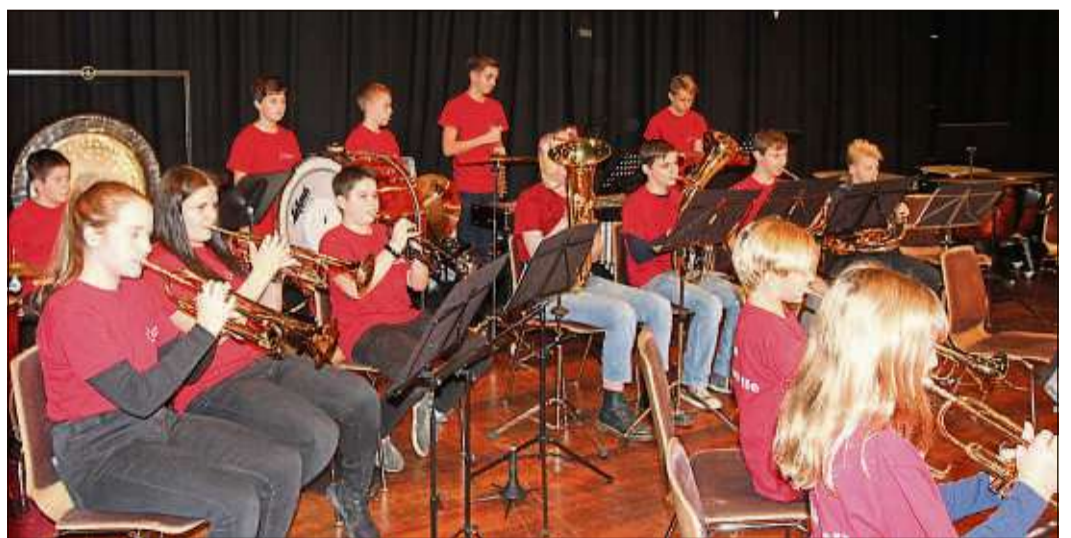
Die Jugendkapelle begeisterte mit „Music from Cars“.