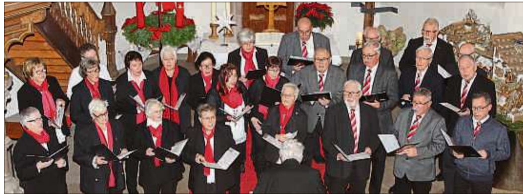
Die Elmer Chorgemeinschaft präsentierte besinnlichen Gesang in der örtlichen Kirche.