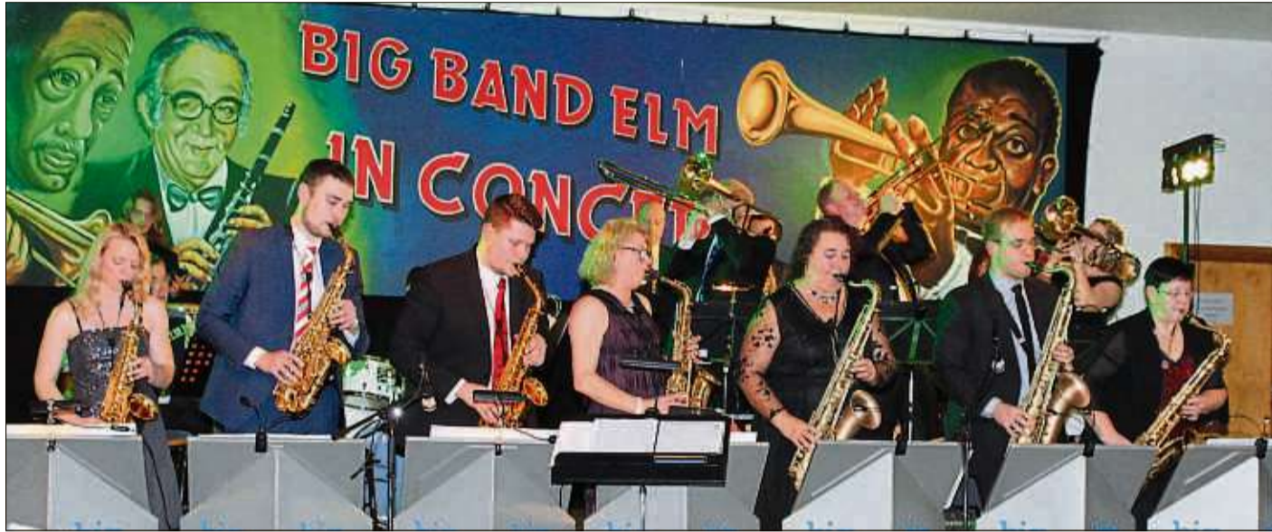
Beste Unterhaltung bot die Big Band des Eisenbahner Musikvereins Elm (im Vordergrund Saxofon-Satz) beim traditionellen Jahreskonzert im Elmer Gemeinschaftshaus. Die Musikerinnen und Musiker hatten sich bei ihrem Konzert hauptsächlich der Swing-Musik verschrieben und erteten großen Applaus für ihre Darbietungen.