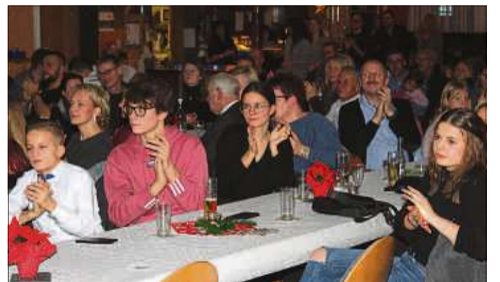
Das Publikum im Elmer Gemeinschaftshaus spendete viel Applaus.