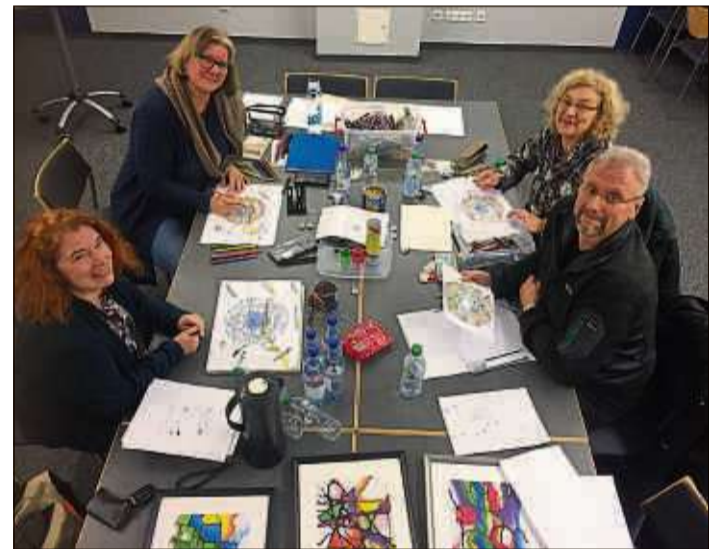
Die Teilnehmer der Seminars beim Zeichnen der Neurografiken.