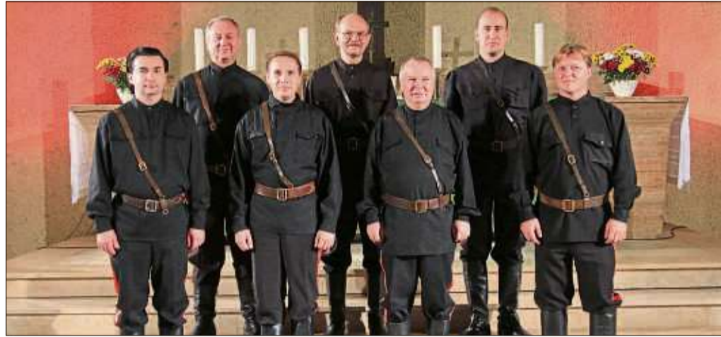
Gesang „aus den Tiefen der russischen Seele“ verspricht der Auftritt der Don Kosaken in der Pfarrkirche St. Goar in Flieden.

Karten im Vorverkauf gibt es unter anderem im katholischen Pfarramt St. Goar Flieden, Telefon (06655) 15 10, im Bürgerbüro des Rathauses, im Verkehrsbüro Steinau sowie über www.reservix.de. Restkarten sind an der Tageskasse erhältlich. Einlass zum Konzert ist ab 13 Uhr. Die Karten kosten im Vorverkauf 22 Euro, an der Tageskasse 25 Euro.