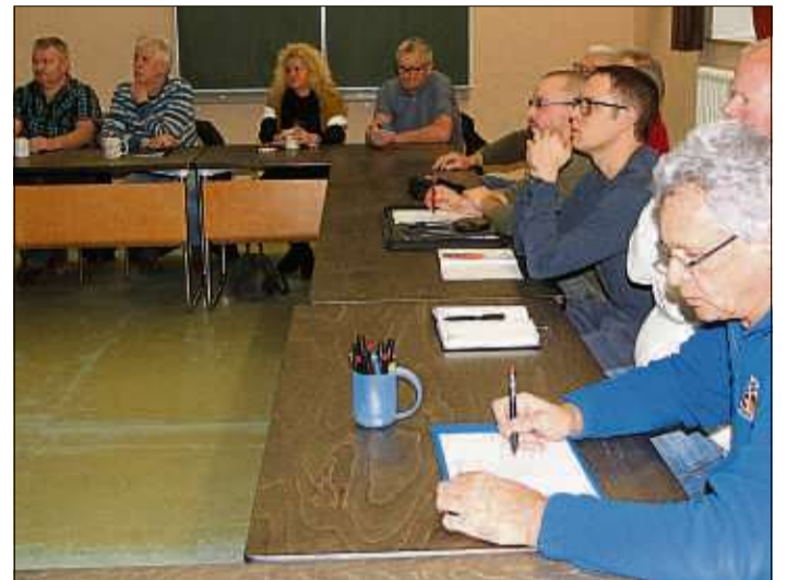
Rund 20 Vereinsvertreter steuerten ihre Ideen bei.

Man darf gespannt sein, wie das Motto „Ein Platz – eine Bühne – Ihre Ideen“ in den kommenden Monaten von den Kulturträgern mit Leben erfüllt wird.