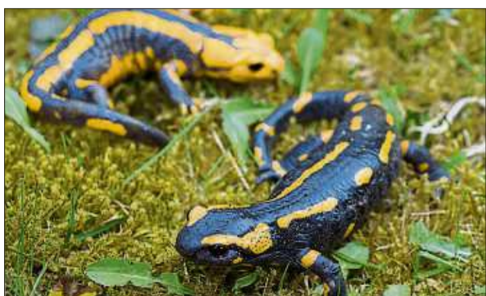
Der Feuersalamander ist noch in Sannerz und Weichersbach zu Hause.

Im April wurde im Raum Schwarzenfels das fast ausgestorbene Braunkehlchen entdeckt und wildbiologisch bestätigt, nicht nur als Durchzieher, sondern nistend. Die Landwirte erklärten sich bereit, die Brutgegend zu schützen und nicht zu mähen. Die NABU-Gruppe Sinntal setzt sich in den nächsten Jahren für den Schutz dieser Lebensräume ein. Schon im