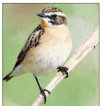
Das fast ausgestorbene Braunkehlchen wurde im Raum Schwarzenfels entdeckt.

Das vom Land Hessen durch Termine mit der Landesbetriebsleitung und dem Forstamt unterstützte Kreuzotterprojekt wurde erfolgreich weiter etabliert mit dem Ausbau des passenden Biotops, eines Winterquartiers sowie Kleingewässern und Stein schütten. Im September fand ein Informationsabend zum Thema Biodiversität mit Diplomingenieurin Dorothee Dernbach statt, an dem auch Vertreter der Gemeinde und Bauhöfe sowie interessierte Laien teilnahmen, denn es ging auch darum, was jeder bei sich im Garten ganz einfach dafür tun kann.