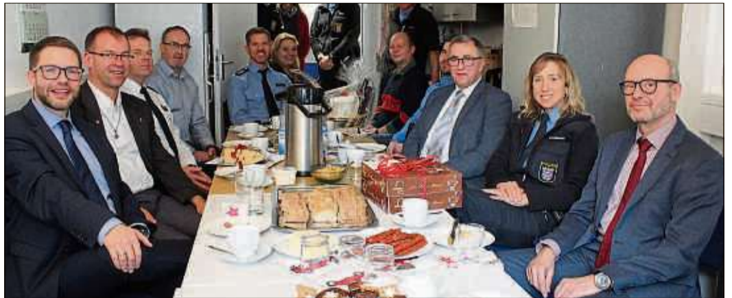
Unser Bild zeigt Landrat Thorsten Stolz (links) mit den Führungskräften und der Dienstgruppe in Schlüchtern.

REGION (BWB). Die Rundreise zu den Polizeistationen im Main-Kinzig-Kreis vor den Weihnachtstagen ist nicht nur eine gute Tradition, sondern für die Kreisspitze auch die geeignete Gelegenheit, um den Einsatzkräften für ihre wichtige Arbeit zu danken. Landrat Thorsten Stolz und Erste Kreisbeigeordnete Susanne Simmler übermittelten im persönlichen Gespräch die besten Wünsche des gesamten Kreisausschusses sowie der Kreisgremien.