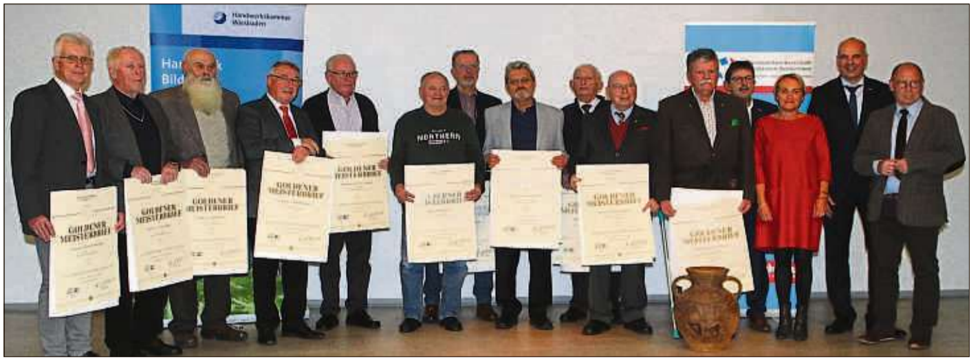
Bei der Seniorenfeier der Kreishandwerkerschaft im Elmer Gemeinschaftshaus wurden diese langjährigen Handwerksmeister ausgezeichnet.