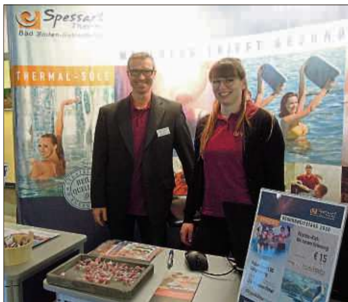
Das Team der Spessart Therme präsentierte die aktuellen Gesundheits- und Wellness-Angebote.

Beachvolleyball, eine relativ junge Sportart, sei erst seit 1996 olympische Disziplin, erfreue sich aber steigender medialer Aufmerksamkeit, berichtete Julius Brink. Nach zahlreichen Erfolgen auf nationaler und internationaler Ebene krönte er mit seinem Partner Jonas Reckermann seine Karriere 2012 mit olympischem Gold. Von 2008 bis 2012 bildeten Brink/Reckermann ein Team und waren