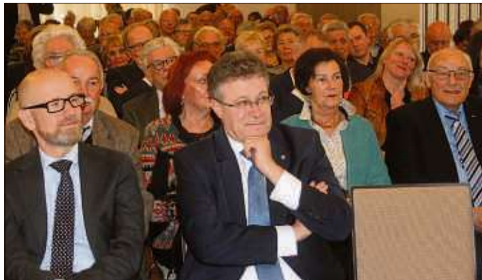
Prominente Politiker gaben sich ein Stelldichein.

SCHLÜCHTERN (CS). Beim traditionellen Neujahrsempfang des CDU-Stadtverbandes Schlüchtern reichten am vergangenen Sonntagmittag in der Begegnungsstätte Effata die Stühle nicht aus, um die vielen Gäste unterzubringen.