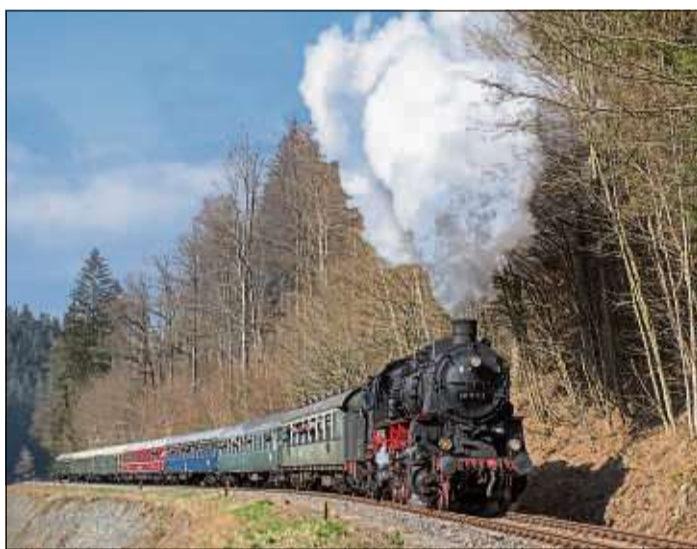
Nostalgische Zugfahrt in den Thüringer Wald.

REGION (BWB). Der Verein „Eisenbahn-Nostalgiefahrten-Bebra“ veranstaltet am Samstag, 21. März, eine besondere Tagesdampfzugfahrt mit historischen Wagen durch den wunderschönen Thüringer Wald. Ein Zustieg ist auch in Schlüchtern möglich.