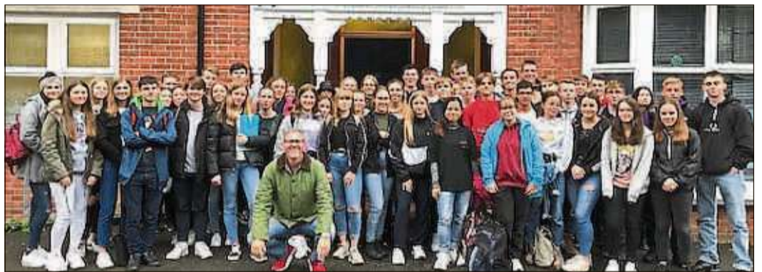
Die Teilnehmer der England-Sprachfahrt des Ulrich-von-Hutten-Gymnasiums mit ihren Lehrern.