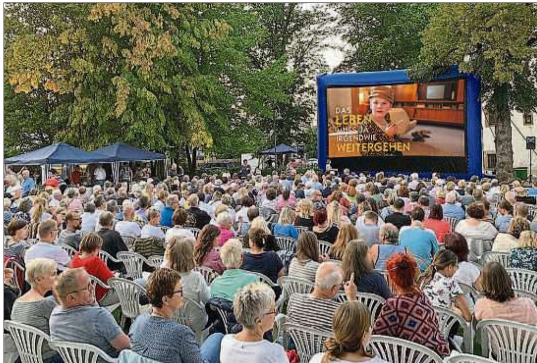
Dass sich der Park an der Stadthalle auch bestens für Open-Air-Kino eignet, konnten hunderte Besucher des Kuki bereits im vergangenen Jahr erleben, als dort „Der Junge muss an die frische Luft“ lief.

Bereits bei der Schließung der Synagoge für öffentliche Kulturveranstaltungen vor zehn Jahren gaben der renommierte Regisseur Michael Verhoeven und seine Frau, die Schauspielerinnen Senta Berger, zu bedenken: „Das Kuki hat eine Bedeutung über die Stadt Schlüchtern hinaus für die gesamte Region. Es ist ein klassischer Beweis dafür, dass eine Stadt gegen die Nivellierung von Kinoorten und gegen eine Verflachung des allgemeinen Kinoprogramms ein Beispiel setzen kann. Gabe es das Kuki Schlüchtern nicht, müsste man es umgehend gründen und