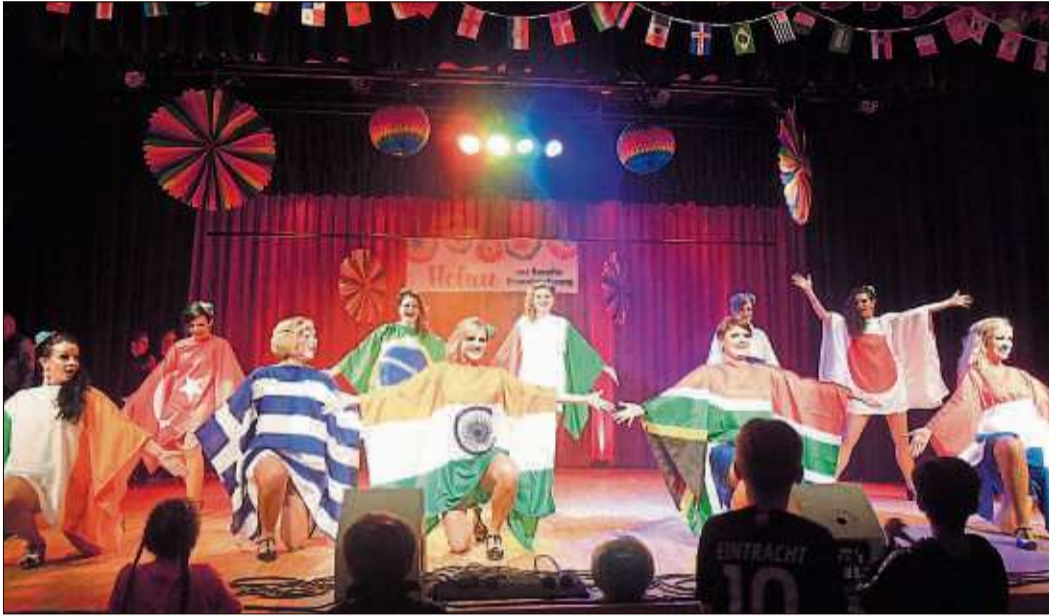
Die „Dance Muddies“ präsentierten internationale Tanzelemente.