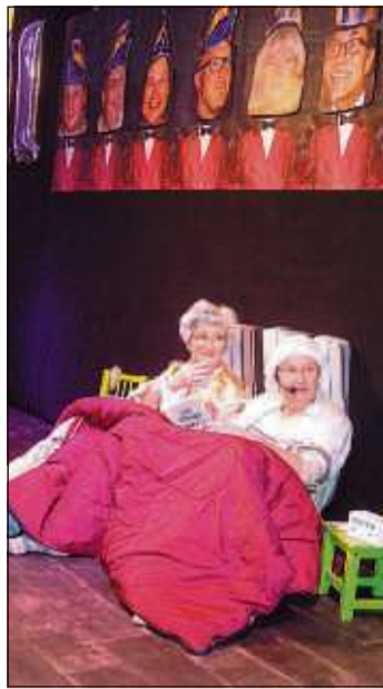
Zwischen Romantik und Alptraum.