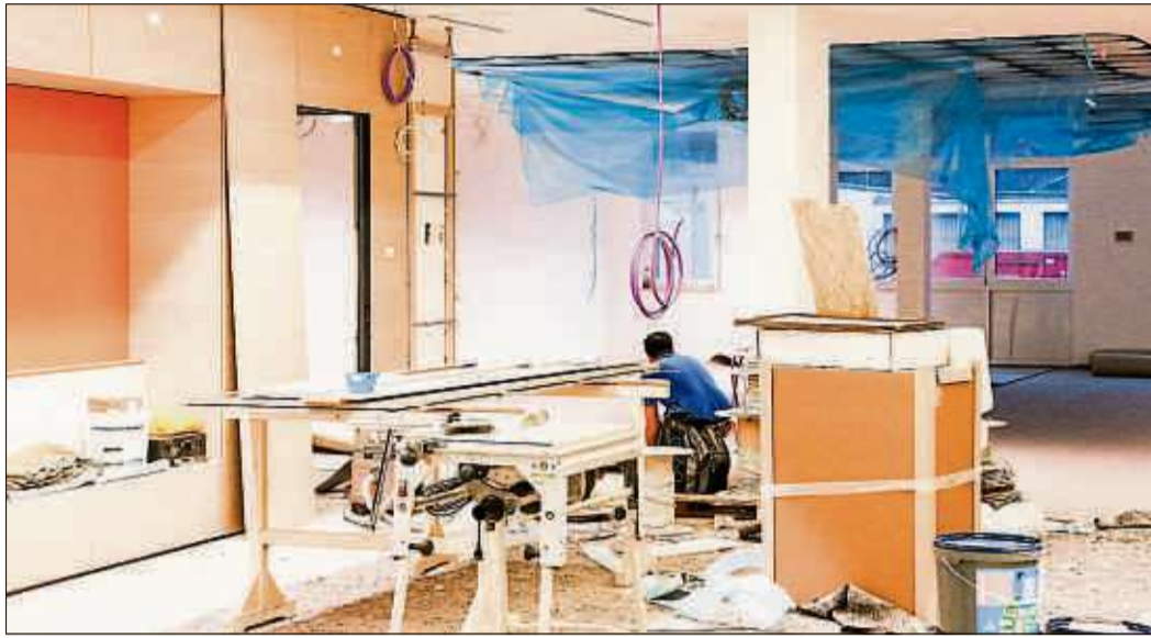
Das Gebäude der VR Bank Fulda in Schlüchtern wird aktuell komplett renoviert.

SCHLÜCHTERN (BWB). Außen hui, innen auch: Das Gebäude der VR Bank Fulda „Unter den Linden“ in Schlüchtern wird aktuell komplett renoviert. Die Außenfassade wird sich ändern, und innen noch viel mehr. Die Verantwortlichen haben sich ein einzigartiges Konzept überlegt. Für Anfang März ist die Eröffnung geplant.