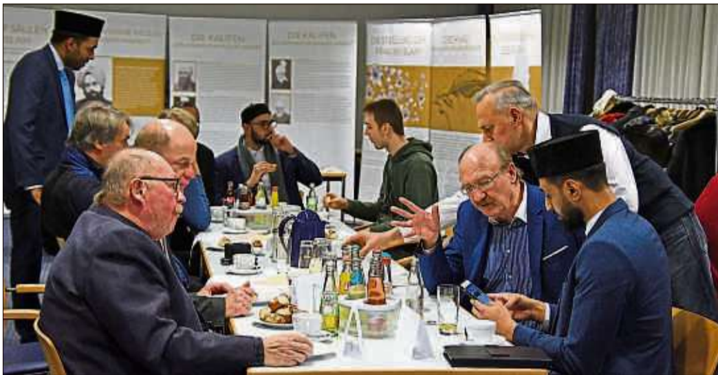
Nach dem offiziellen Teil mit Grußworten und Jahresrückblick klug der Neujahrsempfang der Ahmadiyya-Gemeinde Schlüchtern mit angeregten Gesprächen gesellig aus.

Regelmäßig sei die Gemeinschaft mit Infoständen, zum Beispiel in der Innenstadt, vertreten, um Fragen der Bürger zu beantworten und Vorurteile gegen den Islam abzubauen. Die Frauen der Schlüchterner Ahmadiyyah-Gemeinde sind selbstständig