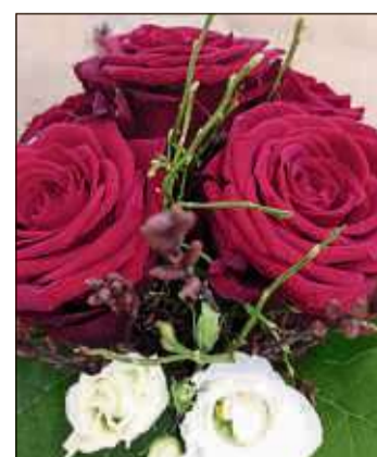
Rote Rosen sind ein Klassiker zum Valentinstag.

Gerne steht Ihnen das Team von „Blumen immer jung“, Gärtnerweg 6, in Brachtal bei der Auswahl zur Seite.