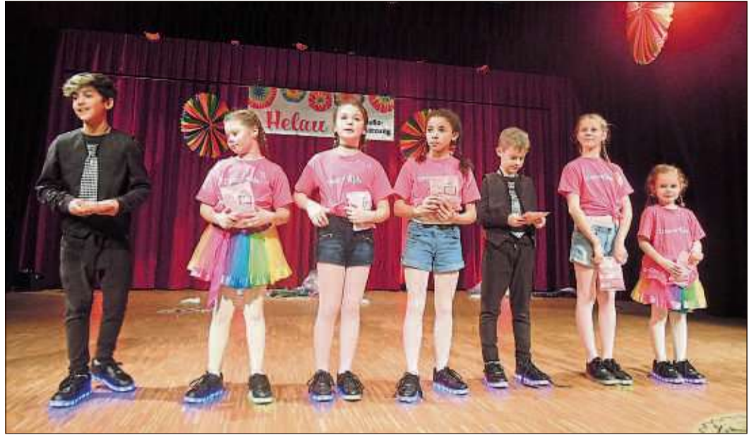
Die jüngste Tanzformation, die „Dance Kids“, reiste tänzerisch um die Welt.