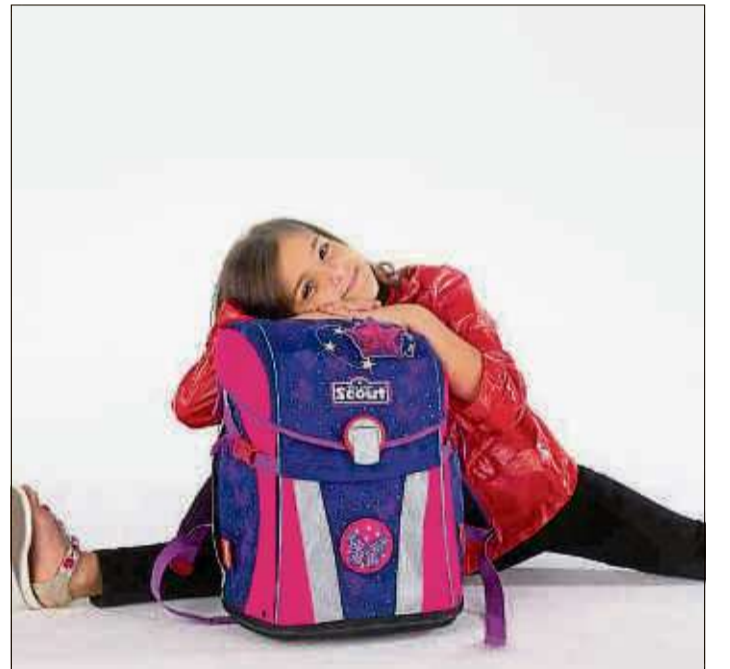
Damit aus dem Schulranzen ein Lieblingsranzen wird: Gute Beratung ist bei den beiden Aktionstagen in der Kreativwelt garantiert.

Das Team der Kreativwelt verspricht: „Abenteuer Schulanfang – mit uns wird der Anfang ein Kinderspiel.“ Schulranzen, Ruck-