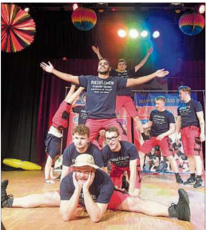
Das Männerballett „Schnoat Schnucke“ aus Wallroth brachte Tanz und Akrobatik auf die Bühne.