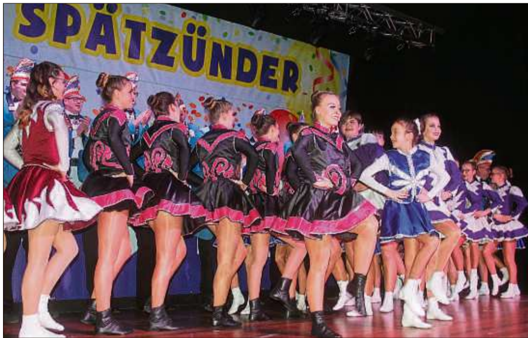
Ein prächtiges Bild bot sich dem Publikum beim Einmarsch der Tanzgarden.