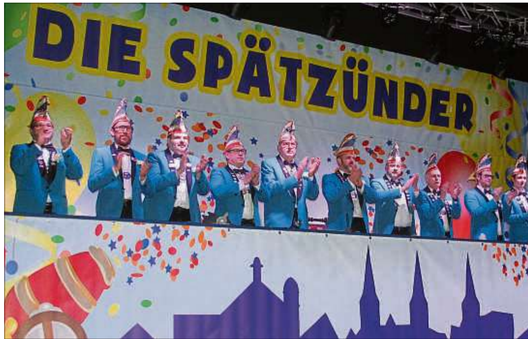
Im Elferrat gab es in diesem Jahr einige neue Gesichter.