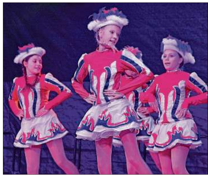
Tanzgarden aus der Region gaben sich in Steinau ein Stelldichein.