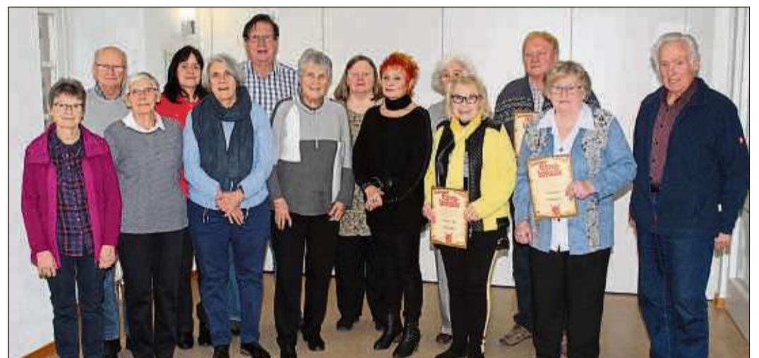
Die eifrigsten Mitglieder wurden beim Heimat- und Wanderverein Bellings ausgezeichnet.