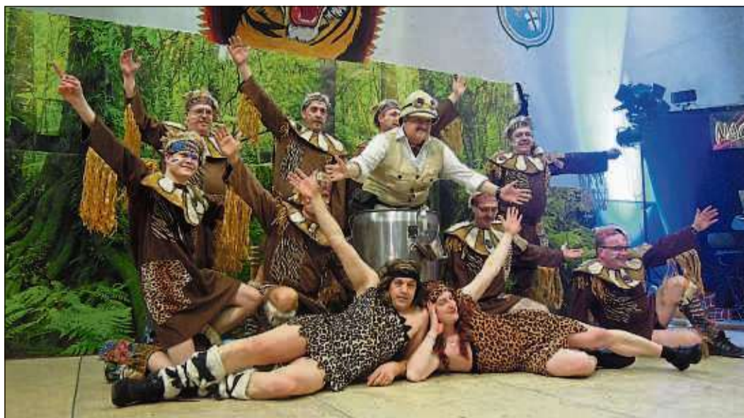
Mit dem Dschungeltanz begeisterte der Elferrat.