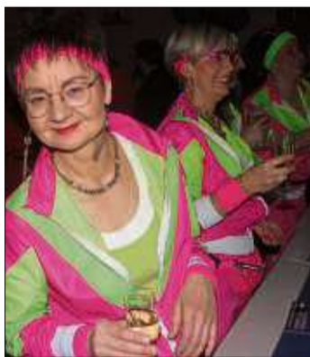
Bunt kostümierte Narren bevölkerten den Saal.