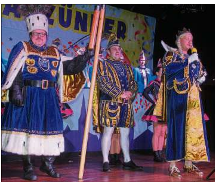
Der Elferrat präsentierte das neue Schlüchterner Dreigestirn.