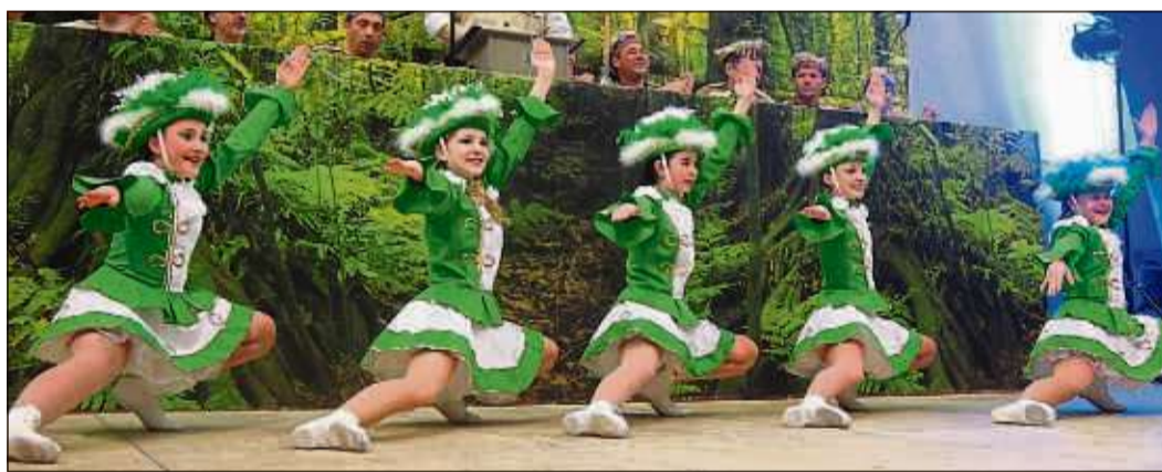
Die „Grüne Garde“ aus Marborn gastierte im Huttengrund.