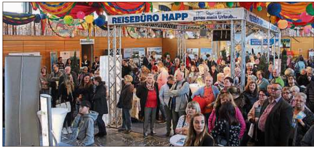
Die Happ-Messe „Reisefieber“ erfreut sich in jedem Jahr großer Beliebtheit.