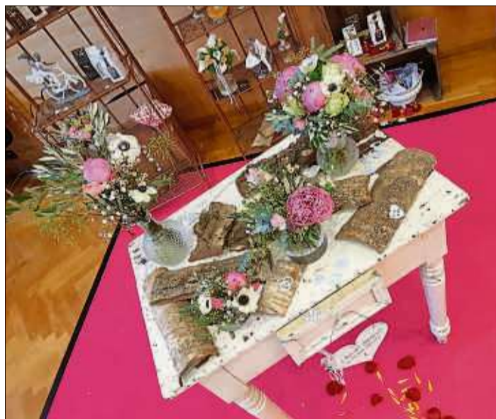
Das Team der Blumengalerie Deger fertigt moderne Hochzeitsfloristik, darunter wunderschöne Tischdekoration.