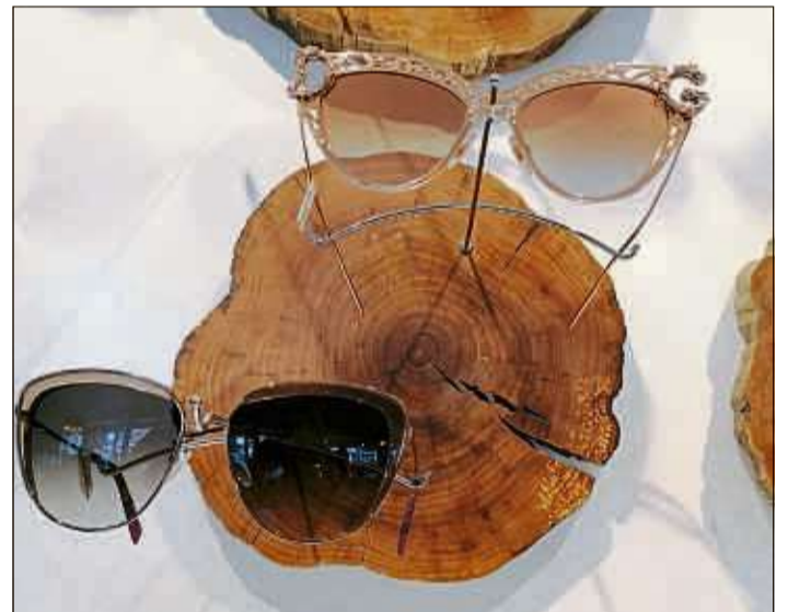
Die neuen Sonnenbrillen-Trends finden modebewusste Kunden im Optikstüberl Diana Weck.

Außerdem ist das Optikstüberl Verkaufsstelle für den Sinntaler Optikstüberl Diana Weck Schlüchterner Straße 3 Sinntal-Sterbfritz