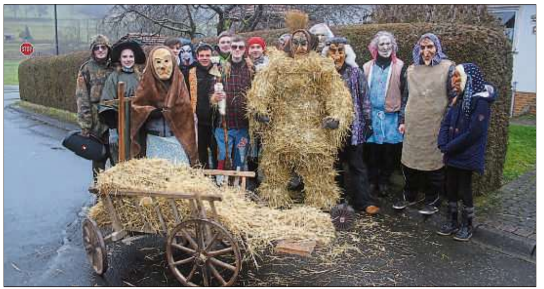
Strohbar und Hexen vertreiben am Faschingsdienstag seit 100 Jahren böse Geister.