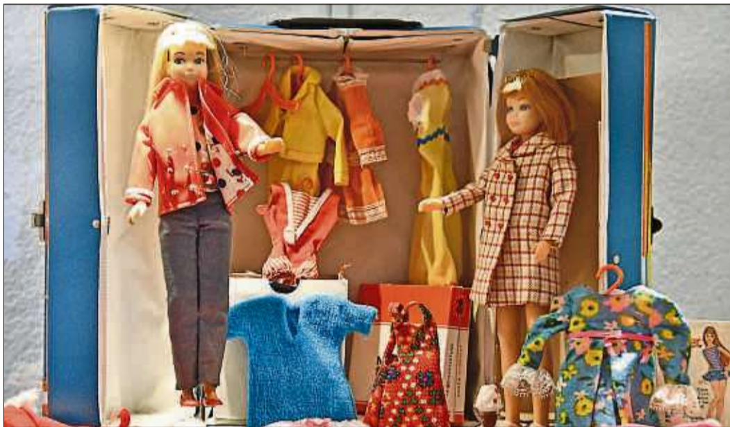
Am Sonntag, 8. März, besteht von 14 bis 18 Uhr die letzte Gelegenheit, die Sonderausstellung „Barbie, eine Puppenlegende wird 60!“ im Bergwinkel-Museum zu besuchen.

Das Museum ist derzeit von Freitag bis Sonntag jeweils von 14 bis 18 Uhr geöffnet. Der Eintritt beträgt 3 Euro für Erwachsene, Kinder bis 18 Jahre zahlen 2 Euro, für Kinder bis sechs Jahre ist der Eintritt frei. Gruppen haben die Möglichkeit, nach vorheriger Anmeldung das Museum auch außerhalb der Öffnungszeiten zu besichtigen. Weitere Informationen sind bei Birgit Schwarzer vom Büro für Touristik, Kultur und Freizeit der Stadt Schlüchtern, Krämerstraße 5, Telefon (06661) 85-359, E-Mail: b.schwarzer@schluetchtern.de, erhältlich.