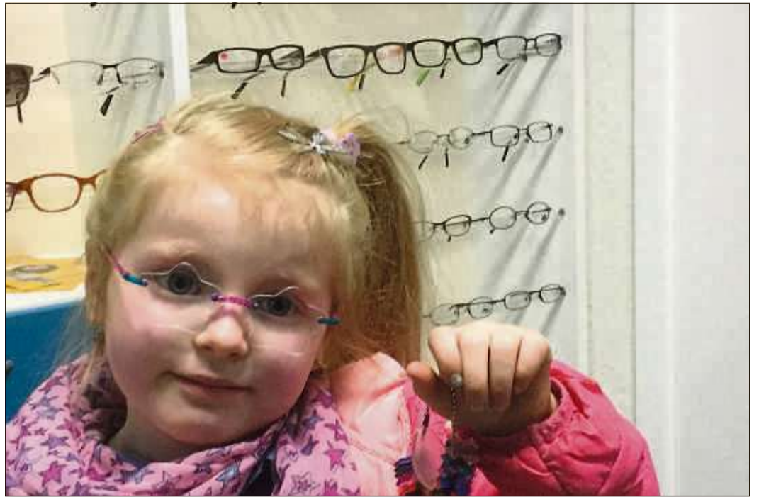
Ein süßer Hingucker: Für Kinderbrillen gibt es Gläser in Form von Sternen.

„Wenn an Ihrer Brille mal was passiert, geben wir alles, um Ihnen schnell und unkompliziert zu helfen“, heißt es bei Paul Meyer Augenoptik.