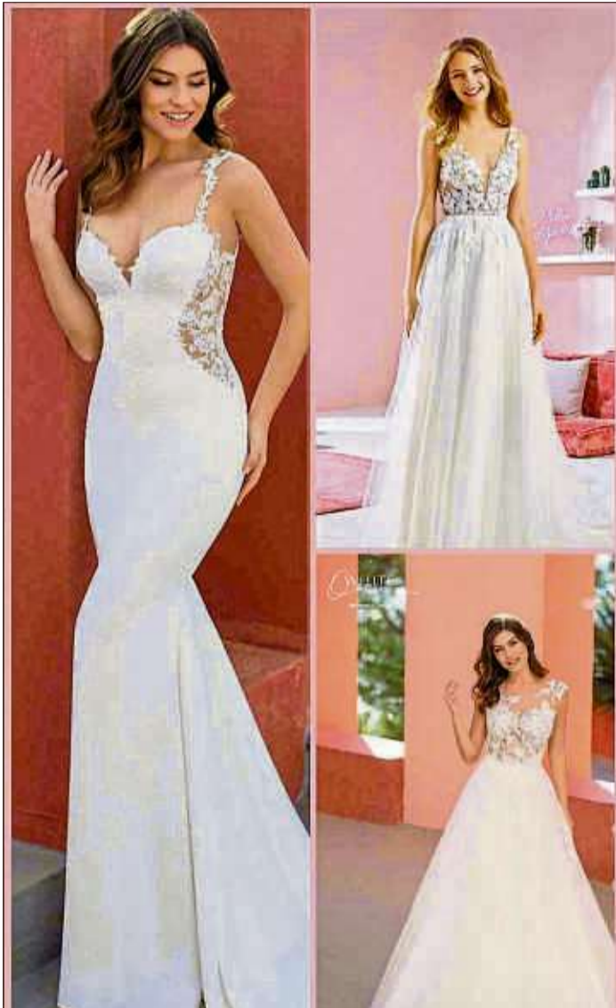
Traumhafte Brautkleider für den schönsten Tag im Leben gibt es bei „Le Mariage“ im Höbäcker Hof.

Vereinbare deinen persönlichen Beratungstermin unter der Nummer (06661) 9195300.