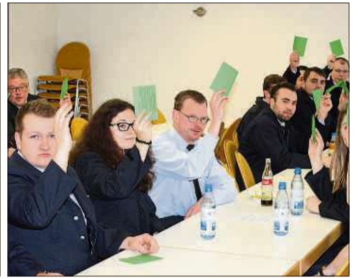
Zahlreiche Delegierte erhoben in der Verbandsversammlung ihre Stimmkarten.