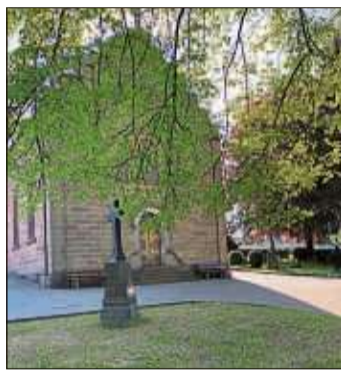
Trauerfeiern und Beerdigungen dürfen in Coronazeiten nur im engsten Kreis stattfinden.

Auch die Kosten seien vorab zu ermitteln. Allerdings, so der Fraktionssprecher abschließend, dürften die Kosten nicht das entscheidende Argument sein. Die BBB wünscht sich, dass der Magistrat sich mit dieser Frage beschäftigt und eine gute Lösung für die Menschen trifft.