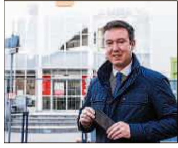
Bürgermeister Matthias Möller begibt sich am Sonntag auf einen Rundgang durch das Gebäude der Kreissparkasse. Facebook-User können live dabei sein.

Die Liveschaltung kann auf der Facebook-Seite des Bürgermeisters https://www.facebook.com/matthias.moeller.schluechtern/ verfolgt werden.