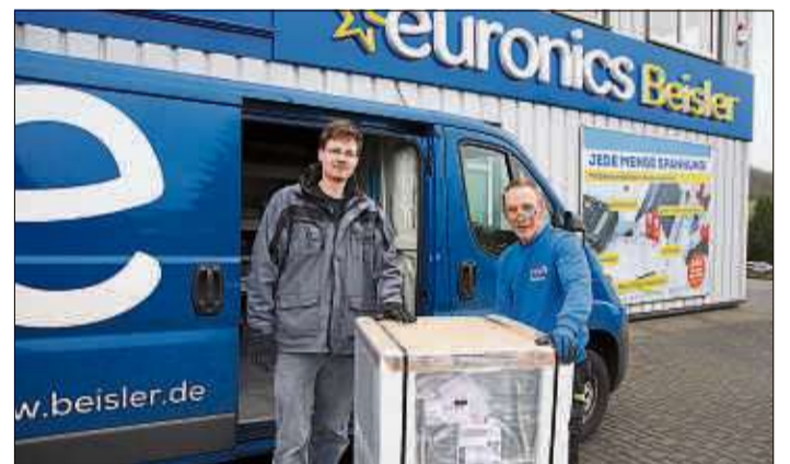
Beisler liefert und montiert die neuesten Produkte und Technologien.