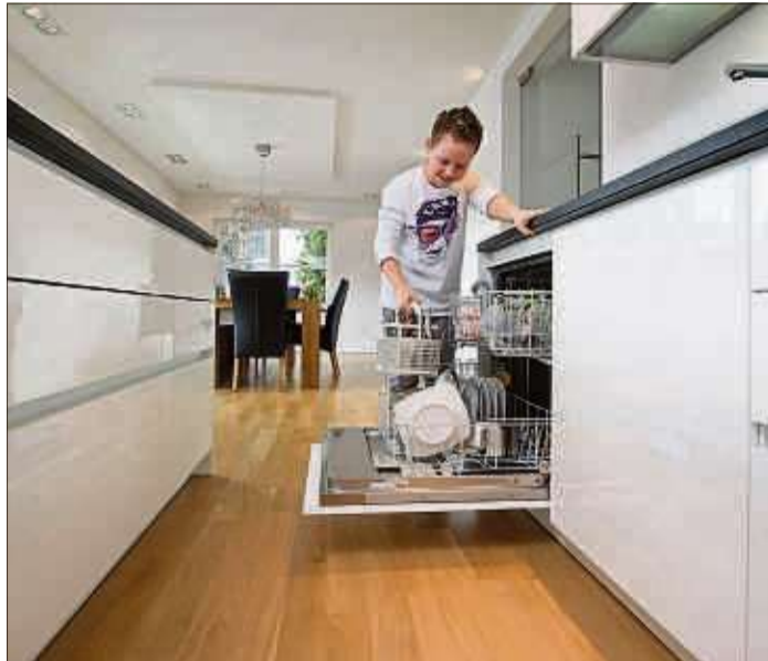
Im Wohn- und Aufenthaltsbereich wird Parkett schon seit dem 16. Jahrhundert verlegt. Jetzt greift der Trend auch auf Küche und Bad über. Kühl wirkende „Nasszellen“ und Kochnischen sind out. Gefragt ist Gemütlichkeit im ganzen Haus. Klebt man Parkett aus Harthölzern vollflächig auf den Untergrund, bleibt es auch in Küche und Bad jahrzehntelang schön.

Befolgt man die genannten Hinweise, ist Parkett ein Boden für alle Räume. Ein geklebter Parkettboden kann durch Schleifen und neu aufgetragener Oberflächen-