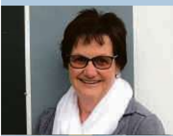
Eine Initiative des Vereins WITO e.V. und des Bergwinkel Wochen-Boten