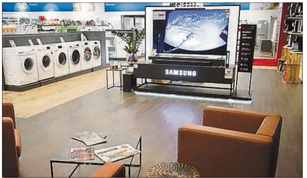
In Schlüchtern steht auch ein professionelles Fernsehstudio für ein Seh- und Klangerlebnis zur Verfügung.