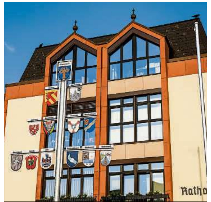
Das Rathaus Schlüchtern soll ab 1. Juni wieder für Besucher geöffnet sein.

Die Folgen des Coronavirus treffen die Beschäftigten in der freien Wirtschaft hart, doch auch die städtischen Mitarbeiterinnen und Mitarbeiter müssen mit Einschnitten rechnen. Da sich das Arbeitsvolumen in einzelnen Abteilungen stark verändert hat, ist die Stadtverwaltung Schlüchtern erstmals gezwungen, für einen Teil