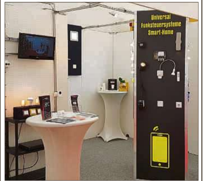
Smart Home Technik senkt nicht nur Heizkosten