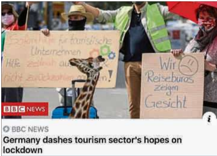
Die Solidarität der Reisebüros untereinander hat auch BBC in England beeindruckt.

Abendmahlsfeiern wird es erst einmal nicht geben, und auch Taufen und Trauungen können nur im ganz kleinen Kreis gefeiert werden. „Vorgesehen ist, auch die Gottesdienste an den folgenden Sonn- und Feiertagen in der Katharinenkirche zu feiern“, gibt der evangelische Pfarrer einen Ausblick.