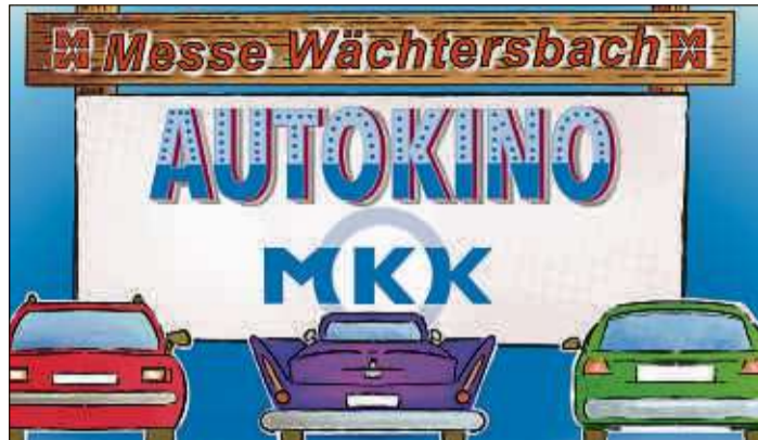
Im Autokino werden zwölf verschiedene Filme für jeden Geschmack gezeigt.

Aufgrund der neuen gelockerten Corona-Verordnungen wird es nun auch einen Lieferservice für Speisen und Getränke geben. Die Veranstalter versprechen ein