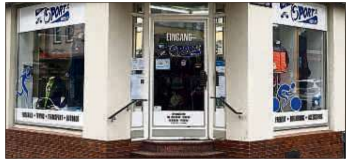
Kunden schätzen die familienfreundlichen Preise in Tim's Sport Outlet.

Die Öffnungszeiten sind Montag bis Freitag jeweils von 9 bis 18 Uhr sowie Samstag von 9 bis 14 Uhr.