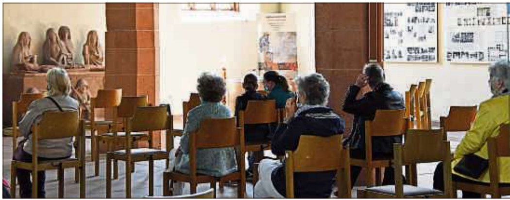
In der Katharinenkirche können die geltenden Auflagen gut umgesetzt werden.

STEINAU (NO). Nach zweimonatiger Corona-Zwangspause hat am Sonntag in Steinau erstmals wieder ein evangelischer Gottesdienst stattgefunden – nicht in der Reinhardtskirche, sondern in der Katharinenkirche am Kumpen. Und auch sonst ist vieles anders, als es die Gläubigen gewohnt sind.