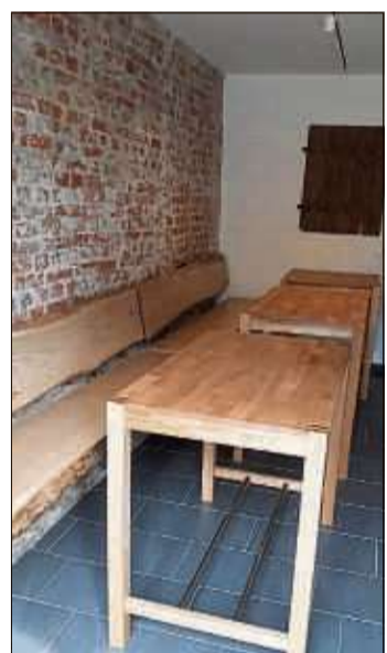
Die Gestaltung des Gastraums passt wunderbar zu dem markanten Backsteingebäude, in dem der Imbiss untergebracht ist.