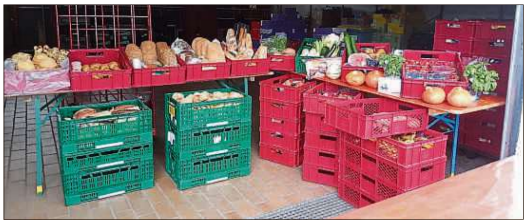
Auch für die Ausgabestelle der Tafel in Steinau werden ehrenamtliche Helfer gesucht.

Gabi Pricop koordinierte diesen Hilfseinsatz und schaffte auch die Voraussetzungen für den Tafelbetrieb in dieser schwierigen Zeit. Sie sorgte dafür, dass Arbeitsplätze räumlich getrennt wurden, Abstandsregeln und Hygienevorschriften beachtet werden. Sie war und ist täglich im Verteilerzentrum der Tafel und kümmert sich um einen reibungslosen und verantwortungsbewussten Arbeitsablauf. Zusammen mit einen wenigen ehrenamtlichen Helfern konnte so