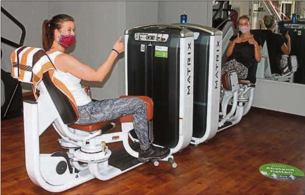
Neue Geräte für den Figurbereich lösen verklebte Faszien und stärken das Bindegewebe.