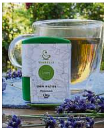
Tee ohne Beutel: Teaballs gibt es in fünf klassischen Geschmacksrichtungen – und neue kommen hinzu.