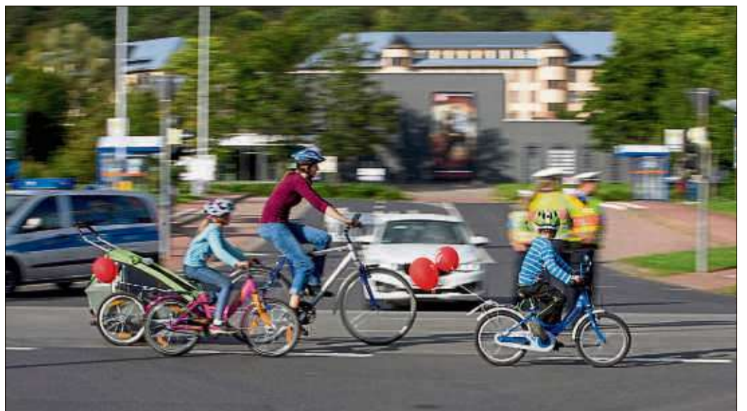
Noch gibt es Hoffnung, dass der Radler-sonntag am 13. September wieder stattfinden kann.