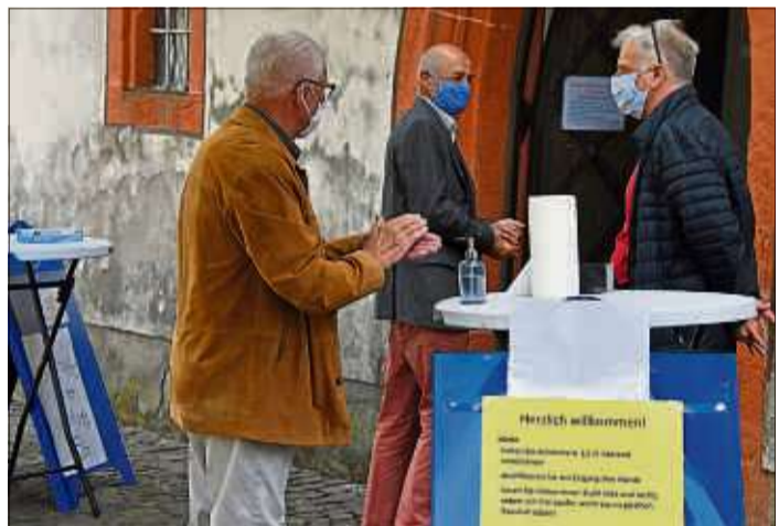
Vor dem Betreten der Katharinenkirche sind die Gottesdienstbesucher aufgefordert, ihre Hände zu desinfizieren.