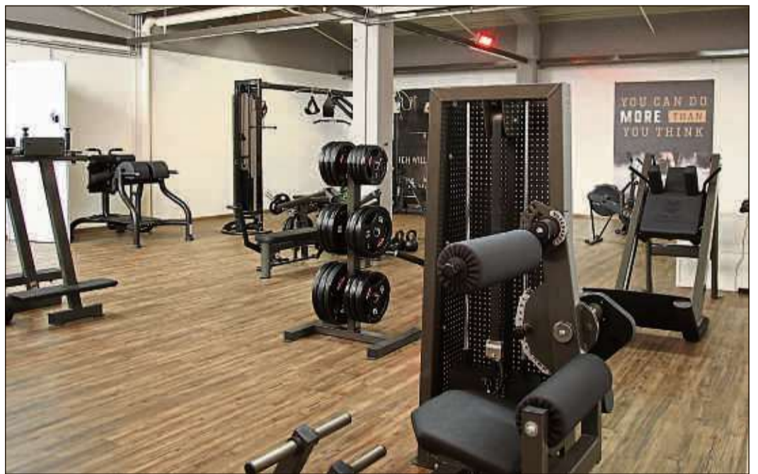
In seinem Fitnessstudio in Steinau setzt Rene Mildner alle Vorgaben und Auflagen mit großer Sorgfalt um.