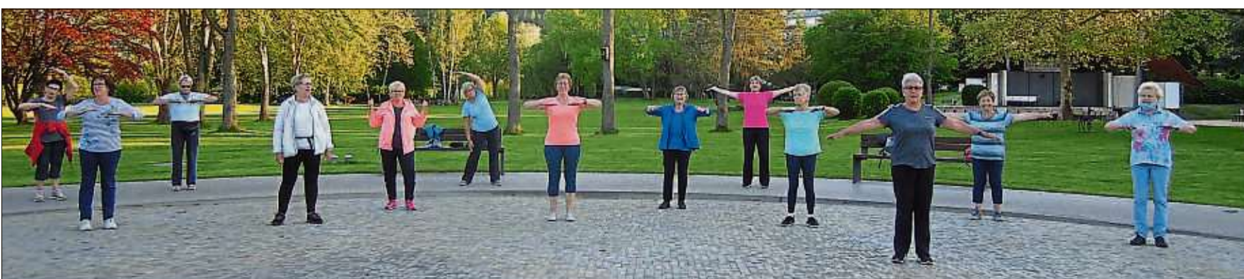
Beim gemeinsamen Sport im Freien war es für die Damen überhaupt kein Problem, die Abstandsregeln einzuhalten.

Sowohl beim gemeinsamen Sport als auch beim anschließenden kommunikativen Austausch war die Wahrung der Abstandsregeln für die sportlichen Damen zu keiner Zeit ein Problem.