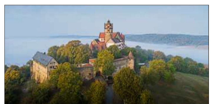
Die Ronneburg ist stets ein lohnendes Ausflugsziel in der Region.