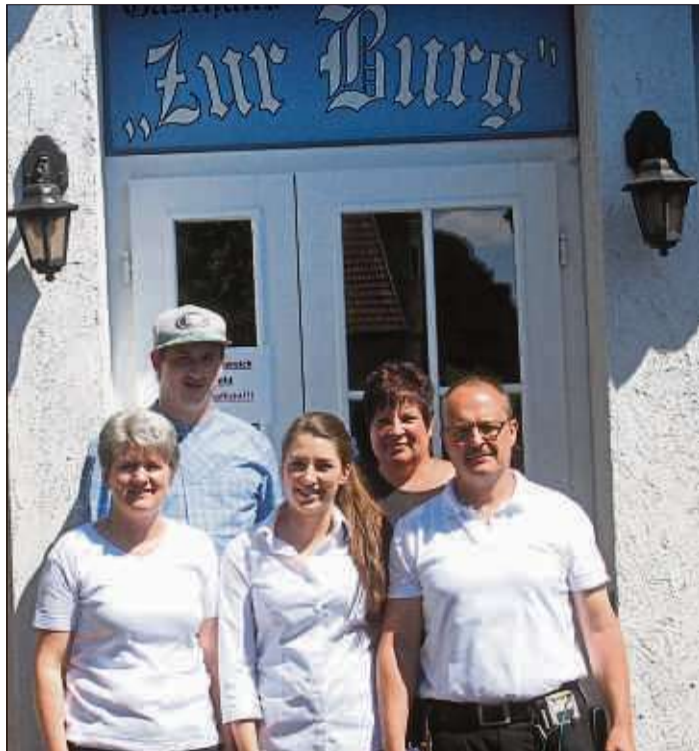
Die Familie Hölzer betreibt in Schwarzenfels das Gasthaus „Zur Burg“ mit einem großen Biergarten.