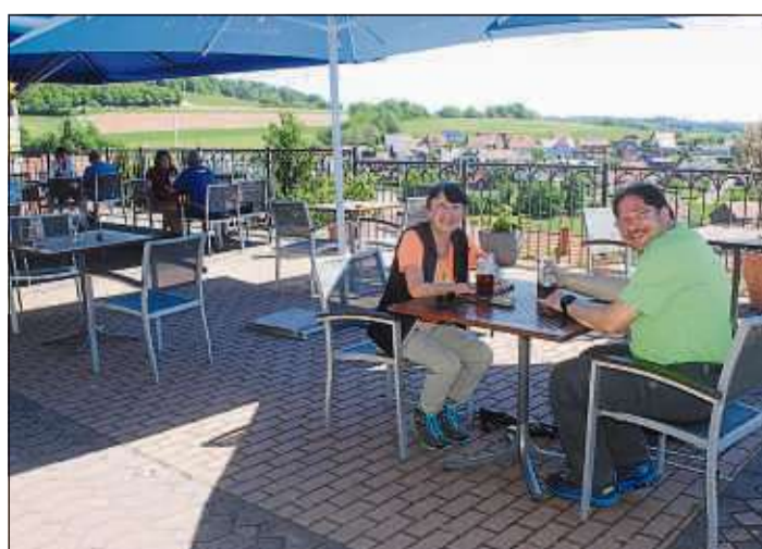
Über einen großen Biergarten verfügt das Gasthaus „Zur Burg“. Hier haben die Gäste einen wunderbaren Blick ins Tal.