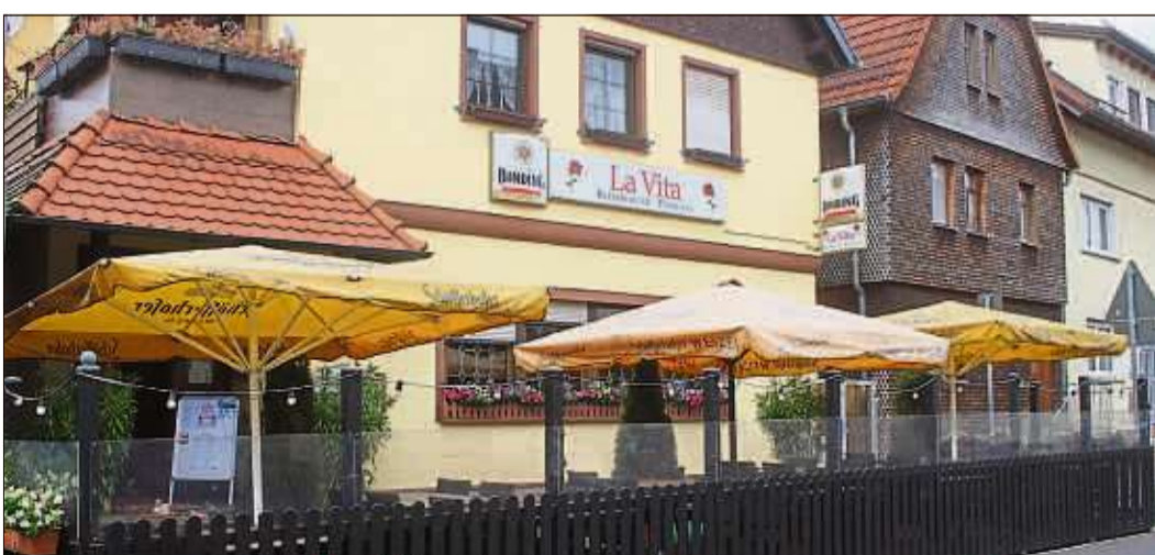
Nach den Bestimmungen, die für die hessische Gastronomie bis gestern galten, blieben der Pizzeria „La Vita“ im Außenbereich nur sieben Plätze für ihre Gäste.

Karl und Gabi Hölzer hoffen, mit einem Umsatz von 30 bis 40 Prozent in diesem Jahr über die Runden zu kommen. Dabei waren sie Anfang des Jahres komplett ausgebucht. Alle Buchungen seien aber inzwischen storniert worden. Der Schwarzenfelser Gastronom lässt sich dennoch nicht entmutigen, auch wenn ein Gast im Biergarten scherzhaft meint, der Wirt versprühe mehr Desinfektionsmittel als er Bier ausschenke.