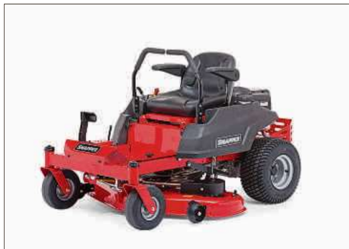
Der Snapper ZTX Zero Turn Mäher meistert jede Kurve, auch wenn sie noch so eng ist.

Traudt-Walkmühle Gartenbedarf und Motorgeräte Brüder-Grimm-Straße 28 36396 Steinau Telefon (06663) 332 Mobil (01 77) 666 33 39 www.traudt-walkmuehle.de info@traudt-walkmuehle.de