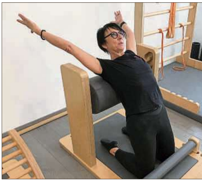
Auch mit „Five“, den Geräten für Rücken und Gelenke, kann das Immunsystem gezielt gestärkt werden.