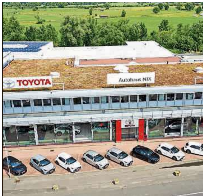
In diesem Jahr feiert das Familienunternehmen - hier eine Luftbildaufnahme vom Standort in Wächtersbach - 50 Jahre Autohaus Nix.