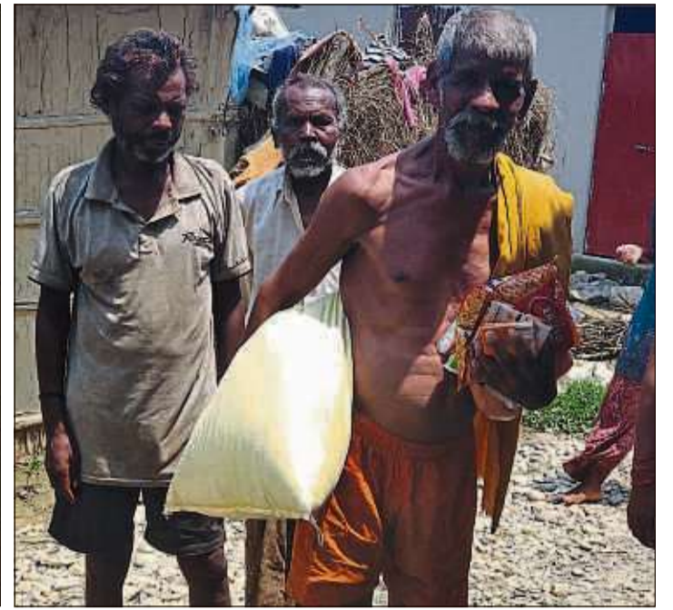
Erste Essenslieferungen treffen ein und werden verteilt.