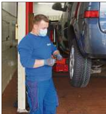
Reifen Simon bietet neben Rädern und Reifen für viele Bereiche auch einen Service rund ums Auto an.

Reifen Simon bildet in den Berufen Kfz-Mechatroniker/in, Industriekaufmann/-frau, Vulkaniseur/Reifenmechaniker/in und Fachkraft für Lagerlogistik aus.