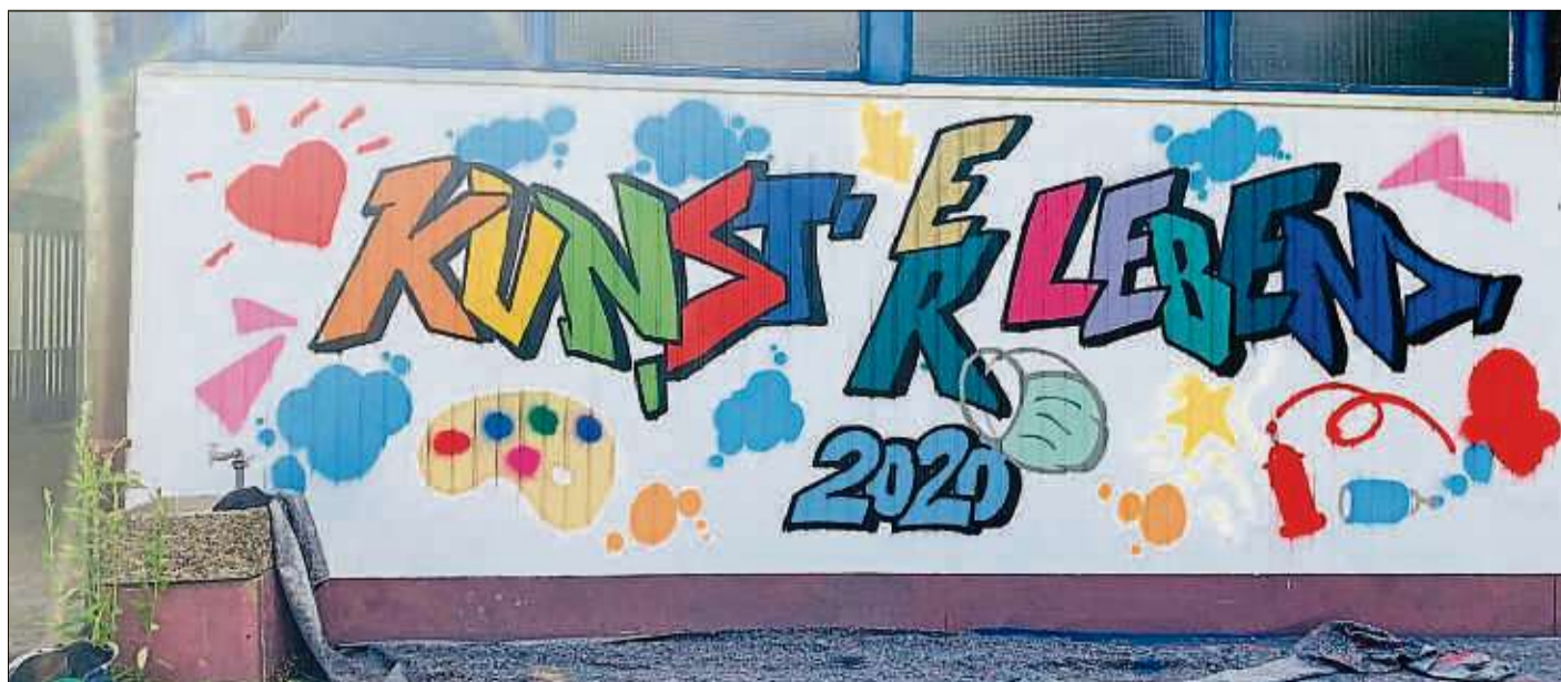
Das farbenfrohe Werk der jungen Künstler schmückt nun die Wand des Umkleidegebäudes im Freibad.

zung durch den Kurbetrieb. Kurdirektor Stefan Ziegler hatte die Wand weiß streichen lassen, und so den Untergrund für die Aktion geschaffen.