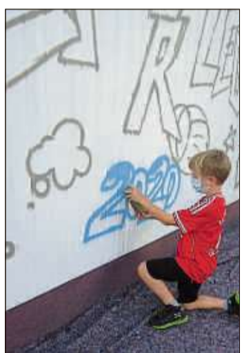
Die ersten Versuche klappten schon ganz gut.