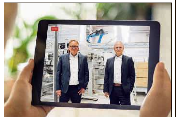
Der Hausbau-Infotag als Live-Stream wurde aufgelegt, weil der eigentliche für den Tag des deutschen Fertigbaus auf dem Werksgelände geplante Hausbau-Infotag abgesagt werden musste.

SCHLÜCHTERN (BWB). Einen Hausbau-Infotag als Online-Veranstaltung? Funktioniert! Das hat der Fertighaus-Anbieter Bien-Zenker mit seinem live auf YouTube gestreamten Event bewiesen. Die lockere Mischung aus vorbereiteten Info-Videos und Live-Interaktion kam bei den Zuschauern an.