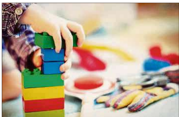
Die derzeitige Situation im Bereich der Kinderbetreuung hält Landrat Thorsten Stolz für völlig unzureichend.

„Kinder brauchen den Kontakt zu anderen Kindern, das ist wichtig für ihre Entwicklung, ganz unabhängig vom Berufsbild ihrer Eltern“, begründete Jugenddezernent Winfried Ottmann die Forderung. Das Prinzip der Notbetreuung, die einzig bestimmten Berufsgruppen vorbehalten ist, soll beendet werden. „Wir werden weiter im Sinne der Familien, Kinder und Eltern am Ball bleiben, da die derzeitige Situation im Bereich der Kinderbetreuung völlig unzureichend ist und ich werde weiterhin für pragmatische und unkonventionelle Lösungen außerhalb der derzeit geltenden gesetzlichen Regelungen“, erklärt Stolz abschließend.