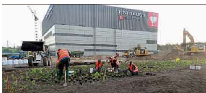
Im vergangenen Herbst wurden die Voraussetzungen geschaffen für ein Meer an Wildblumen – zur Freude von Wildbiene, Schmetterling & Co.

Zusätzlich zur XXL-Pflanzung blumenwiesen aus regionalem heimischer Wildstauden wurden auch viele Tausend Quadratmeter eingesät. Neben differenzierten Einzelsaaten gibt es auch den Schmetterlings- und Wildbienen-saum auf den Böschungen, Wild-