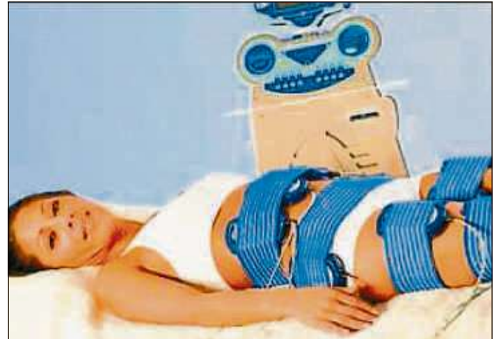
Die Kalt-Licht-Laser-Therapie sorgt über eine 3-in-1-Bio-Modulation dafür, dass Muskulatur aufgebaut, Gewicht reduziert und Hautgewebe gefestigt wird.