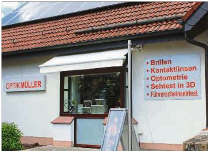
Optik Müller ist seit dem vergangenen Jahr am neuen Standort in der Sterbfritzer Bahnhofstraße.