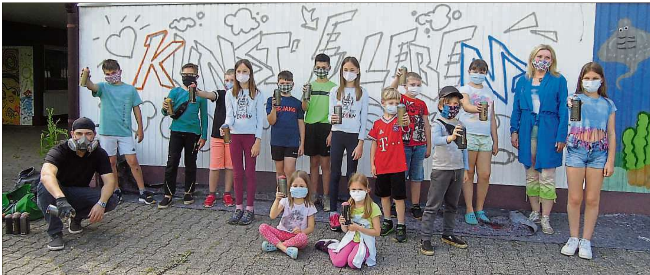
14 Kinder und Jugendliche wählten passende Spray-Farben für „ihren“ Buchstaben des Schriftzugs.