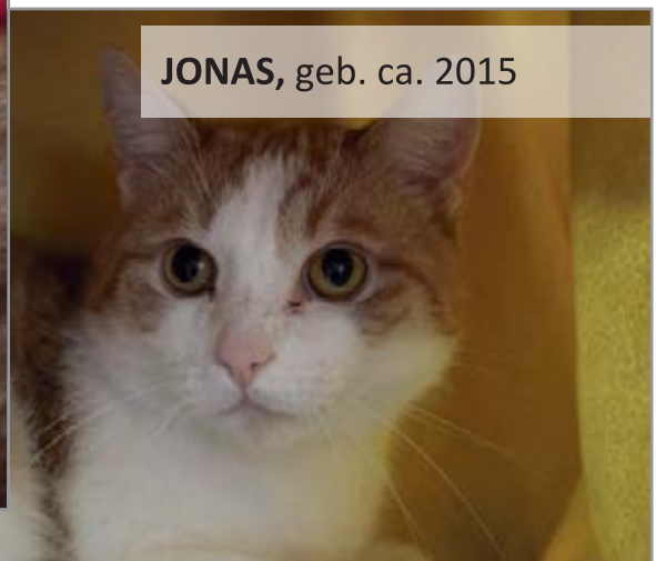
JONAS, geb. ca. 2015