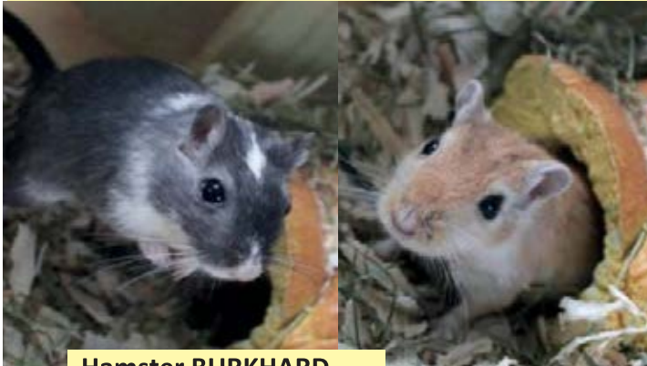
Rennmäuse SÖREN (grau) und BJÖRN (beige)