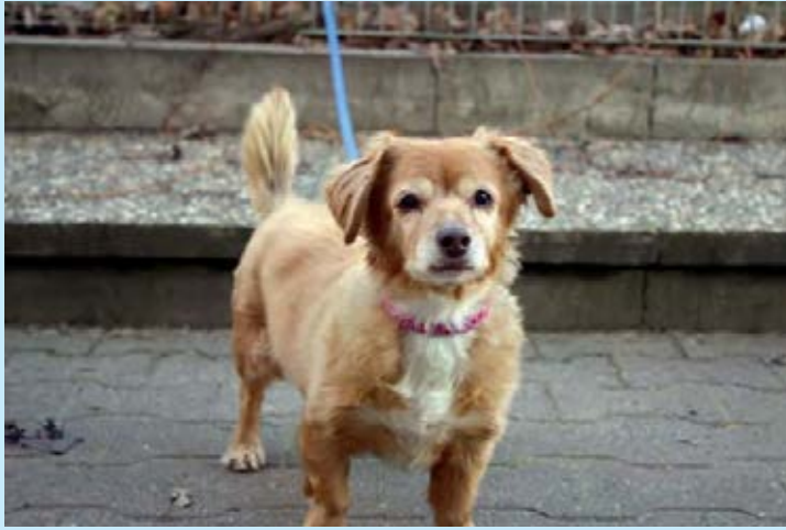
LISSY, geb. 2004 (auf Pflegestelle)