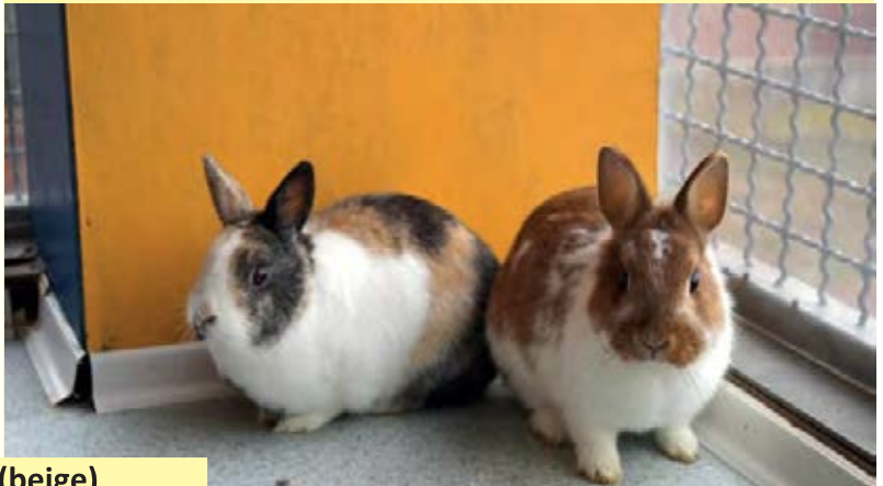
SELKO & ROSA