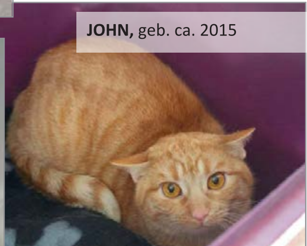
JOHN, geb. ca. 2015

Sie interessieren sich für eine bestimmte Katze und möchten gerne weitere Informationen?