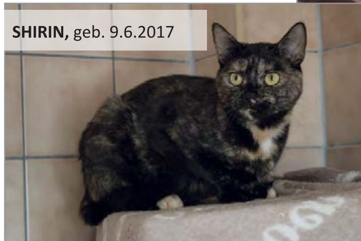
SHIRIN, geb. 9.6.2017