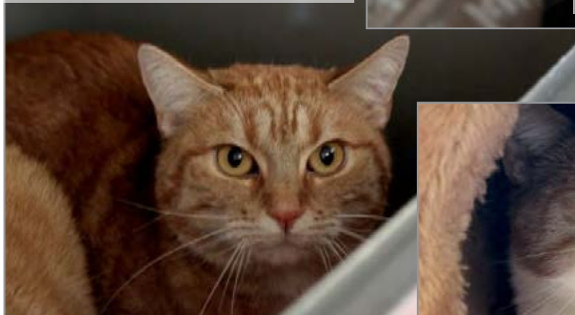
PHILIA, geb. ca. 2015