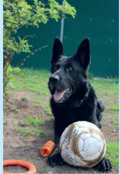
ELLIOT, geb. 9.2.2014