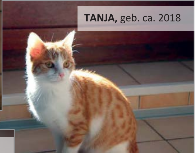
TANJA, geb. ca. 2018