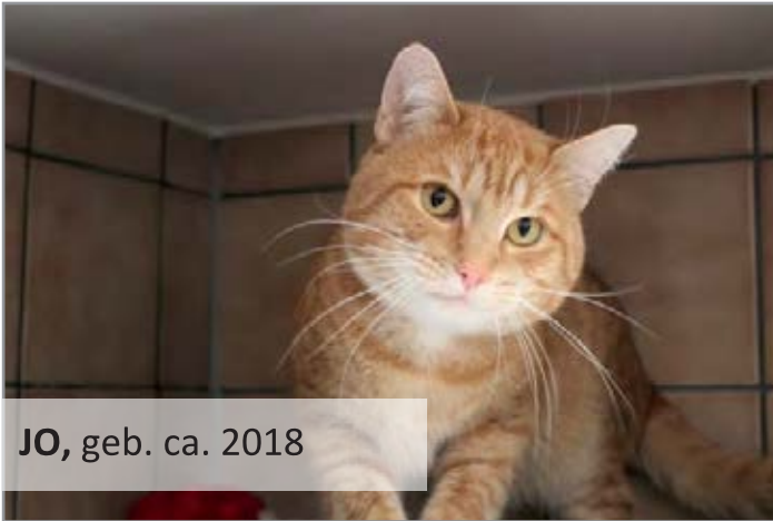
JO, geb. ca. 2018