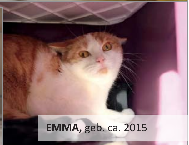
EMMA, geb. ca. 2015