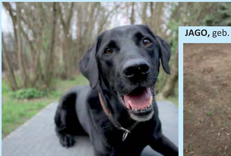
JAGO, geb. 9/2018