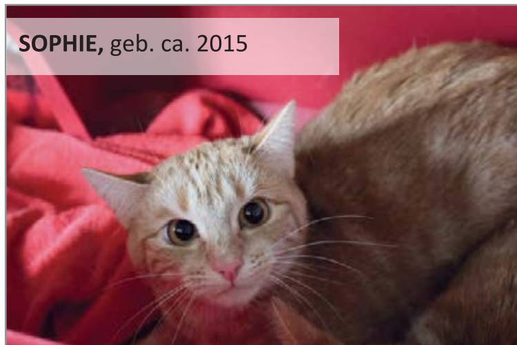
SOPHIE, geb. ca. 2015