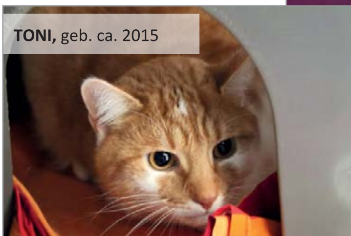
TONI, geb. ca. 2015