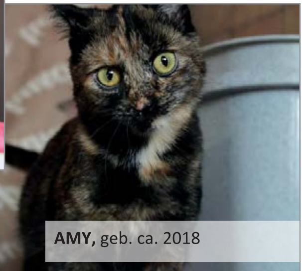
AMY, geb. ca. 2018