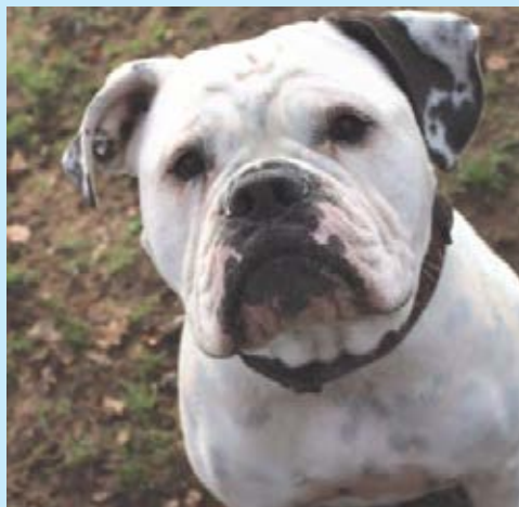
RUBY , geb. 1/2017