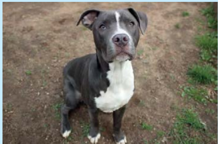
JAGO, geb. 9/2018