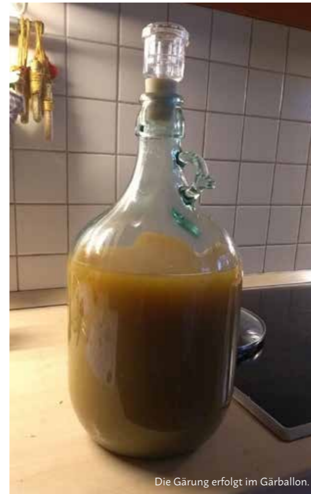
Die Gärung erfolgt im Gärballon.