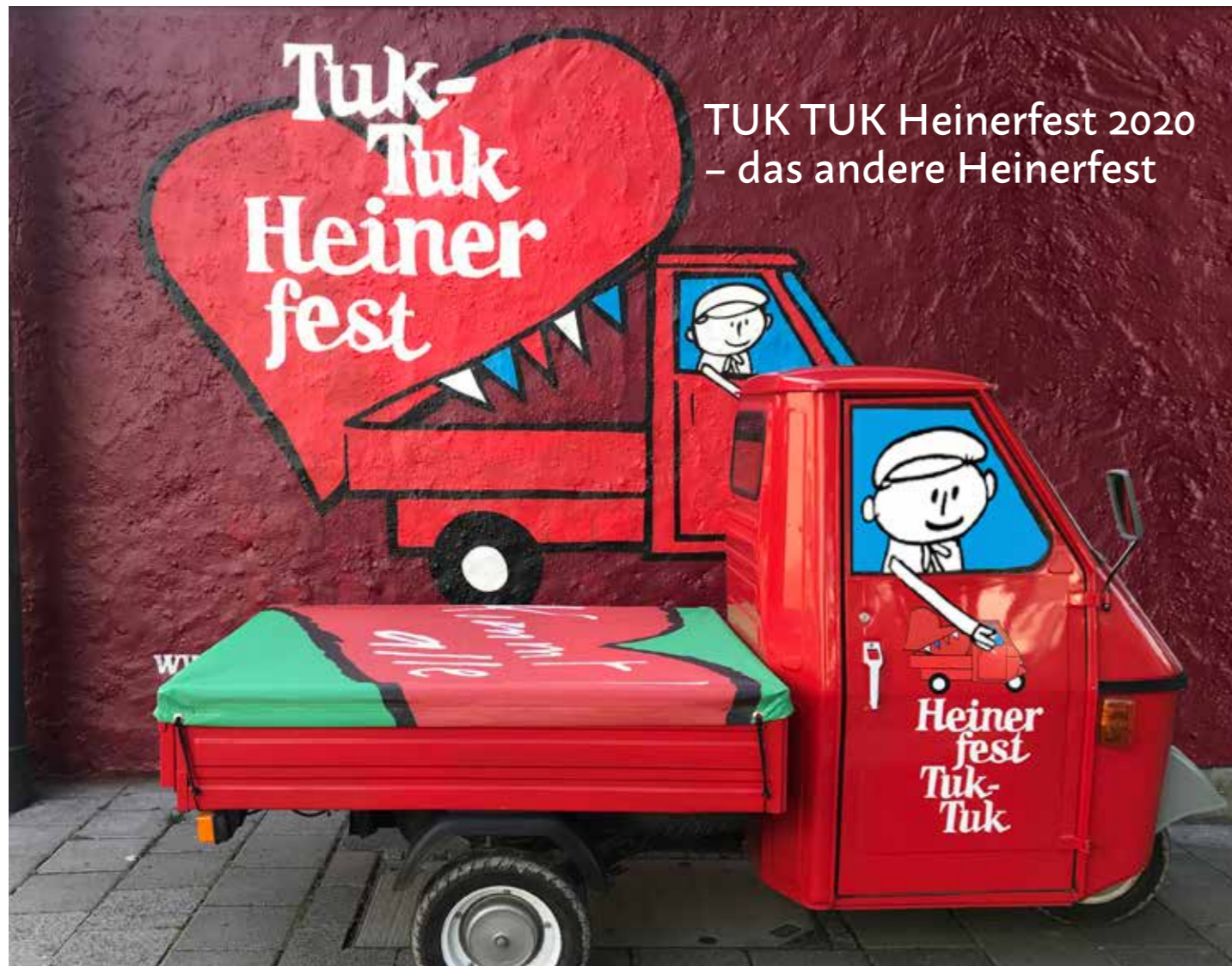
TUK TUK Heinerfest 2020 – das andere Heinerfest