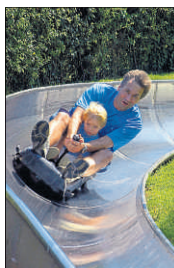
Die Sommerrodelbahn ist bei kleinen und großen Besuchern des Erlebnisparks sehr beliebt.

bad, Parkbahn, Ponyreiten und Berg- und Talbahn müsse derzeit verzichtet werden. Absolute Highlights seien Sommerrodelbahn, Floßfahrten und der Streichelzoo. „In dieser Saison haben wir die Erwartungen runter geschraubt, konnten aber Kurzarbeit vermeiden. Es hätte noch schlim-