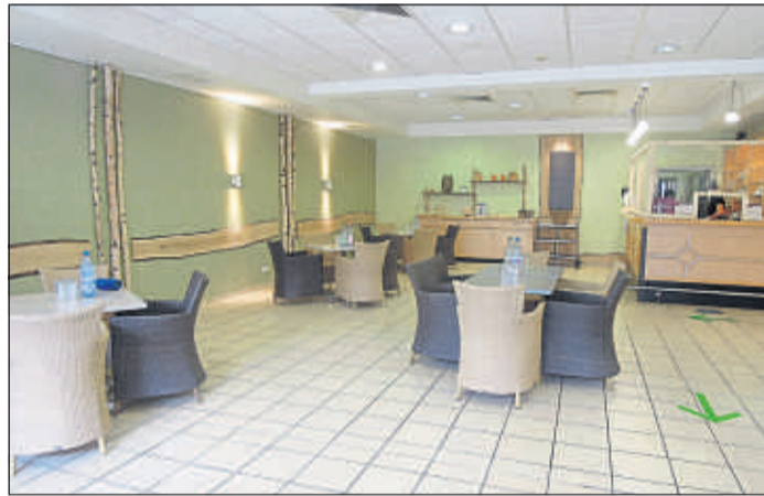
Das Bistro im Saunabereich ist gastlich hergerichtet.

Für die Badegäste besteht keine Pflicht, ihre Personalien zu regis-