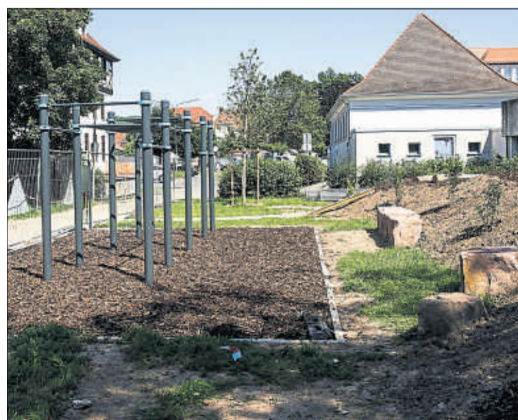
Die Lage des Outdoor-Fitness-Parcours ist ideal: Mehrere Schulen befinden sich in direkter Nachbarschaft.

nes QR-Codes anschauen kann. Dort gibt es Übungsvorschläge für den Parcours von den Trainerinnen des TV Schlüchtern.