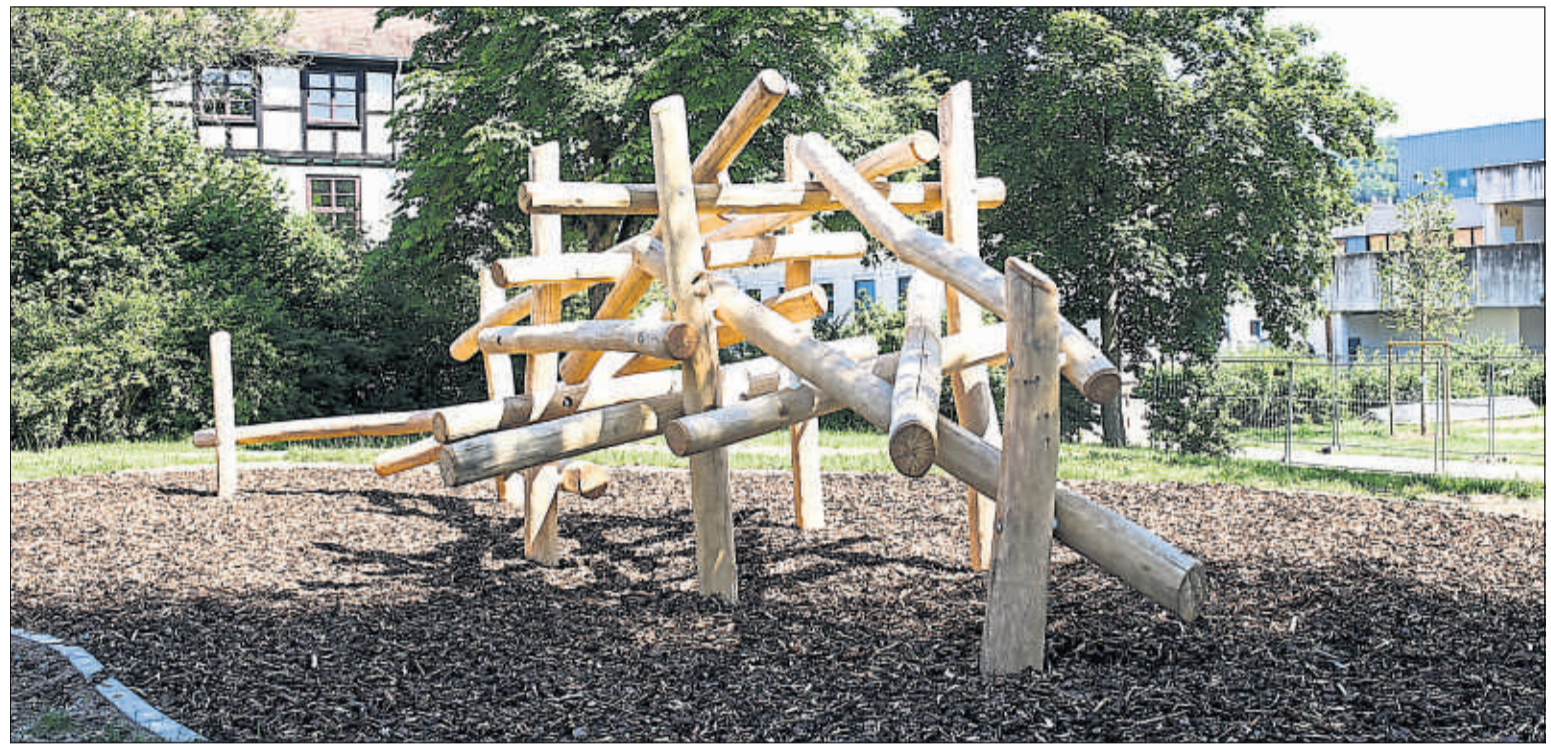
Das Balken-Mikado lädt zum Trainieren ein, ist aber allein in seiner Gestaltung ein echter Hingucker.