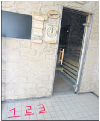
Zahlenmarkierungen weisen auf die Anzahl der Saunabesucher.

Auf einem Rundgang in zwei Gruppen besichtigten zahlreiche Inhaber von Beherbergungsbetrieben nicht nur das Ergebnis vielfältiger Reparatur- und Ver-