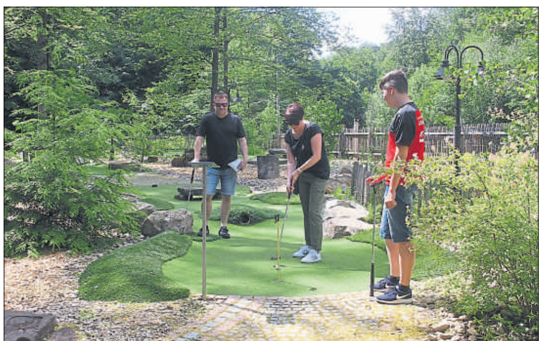
Beim Adventure-Golf gibt es wegen der Abstandsregeln keine Probleme – die Anlage ist groß genug.

Alle weiteren Informationen finden Interessierte unter www.acisbrunnen.de .