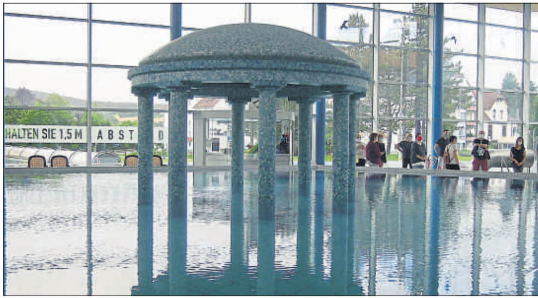
Die Schwimmbecken sind für die Badegäste vorbereitet, Markierungen weisen auf das Abstandsgebot.

gesamten Thermenbereich. Da Abstellflächen nicht mehr im gewohnten Umfang zur Verfügung stehen, werden die Gäste gebeten, auf die Mitnahme großer Taschen oder Trolleys zu verzichten und nur die nötigsten Utensilien mit-