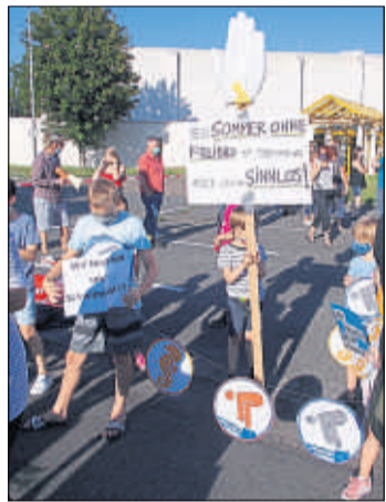
In Steinau demonstrierten Bürger jeden Alters für die Öffnung „ihres“ Freibades – mit Erfolg.

im Nichtschwimmerbecken und 15 im Planschbecken. Höchstens 504 Gäste dürfen sich insgesamt im Freibad Schlüchtern aufhalten. Im Huttener Kombibecken ist 20 Gästen der gleichzeitige Aufenthalt erlaubt. Zwei Kinder können gleichzeitig ins Planschbecken. Insgesamt dürfen 60 Gäste zur gleichen Zeit das Huttener Bad besuchen.