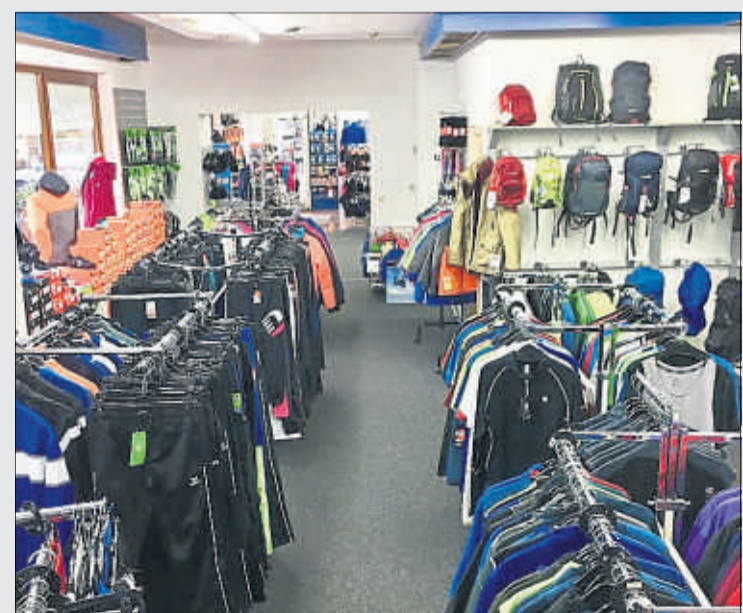
Der Schwerpunkt von Tim's Sport Outlet liegt auf Outdoor- und Wanderbekleidung sowie Laufen, Walken, Radfahren und Fitness.