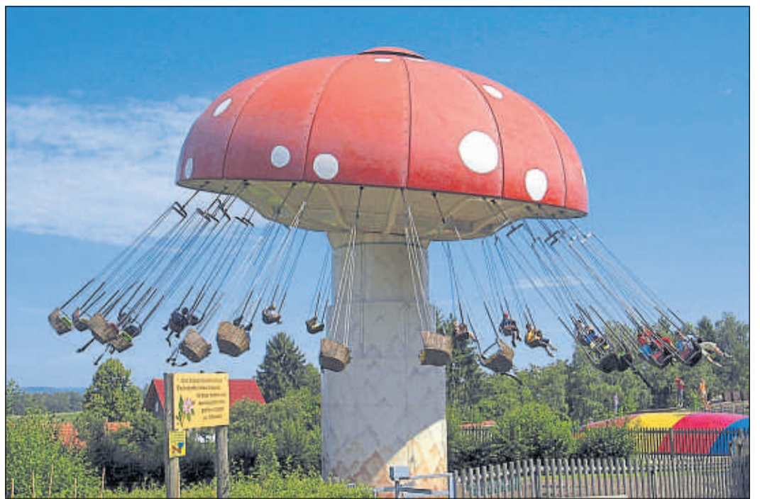
Auf dem Kettenkarussell „Fliegenpilz“ ein Stück Freiheit erleben – gerade in Corona-Zeiten ein Genuß.