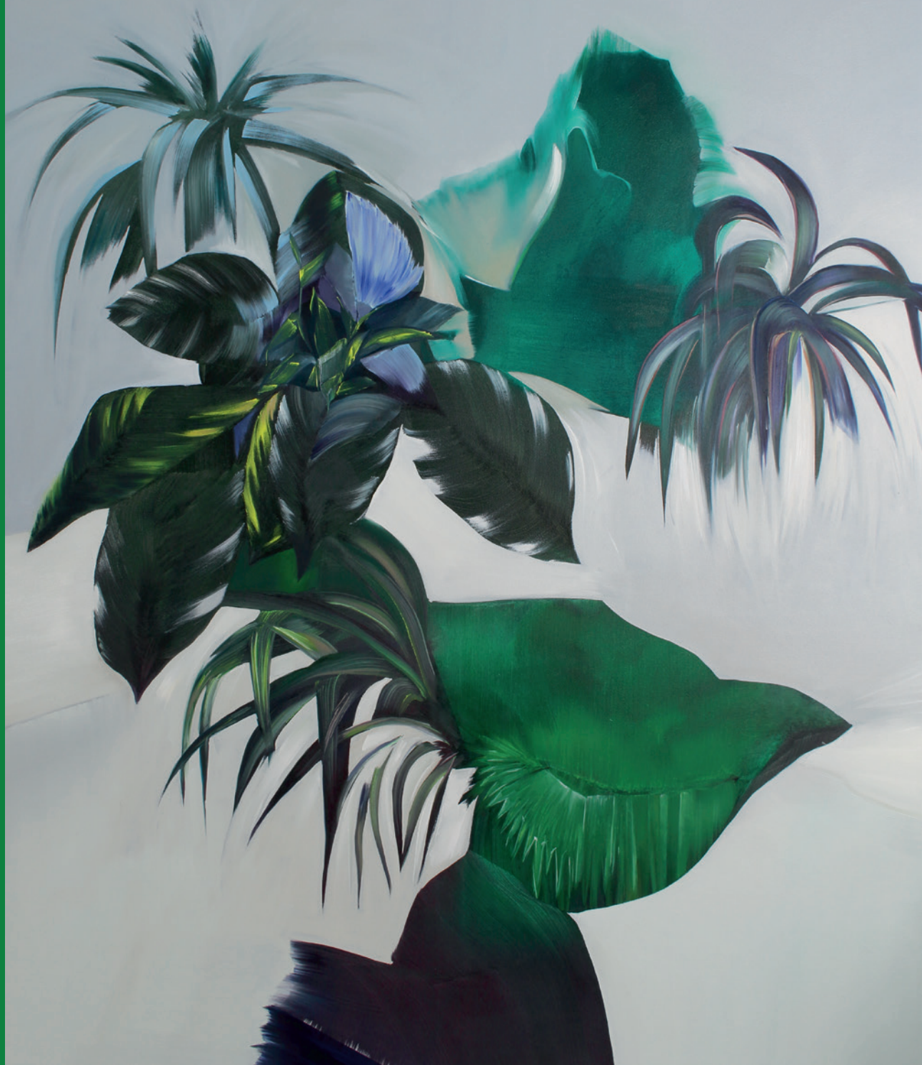
VEREINZELTER DSCHUNGEL 2019, Öl auf Leinwand, 170 x 140 cm