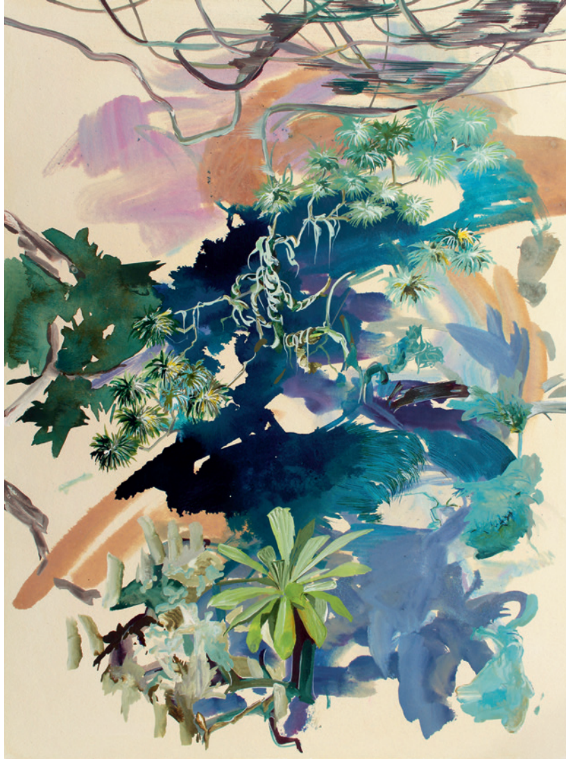
ÜBERGÄNGE 2018, Tusche auf Papier, 40 x 30 cm