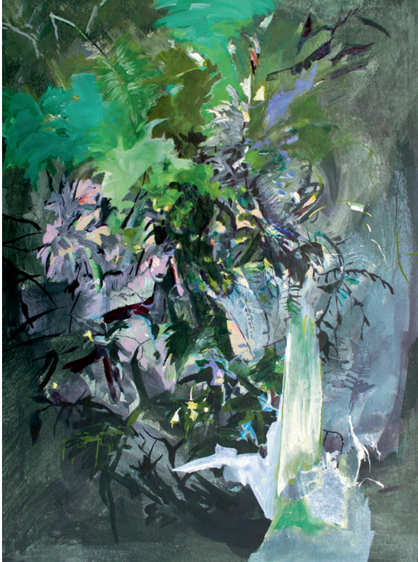
FLATTERN IM FLIRREN 2018, Tusche auf Papier, 32 x 24 cm