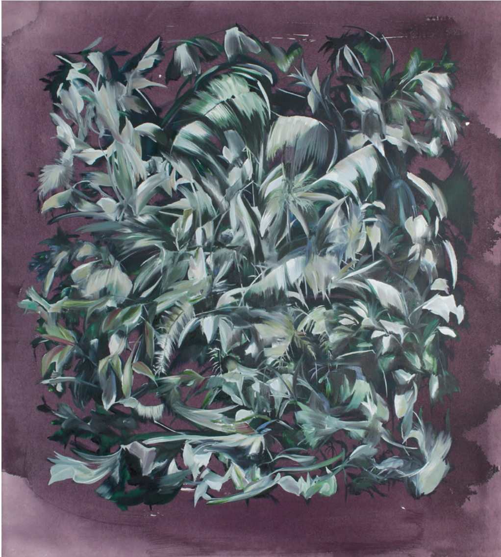
SILBERKALTER BLÄTTERGLANZ 2018, Öl auf Leinwand, 100 x 90 cm