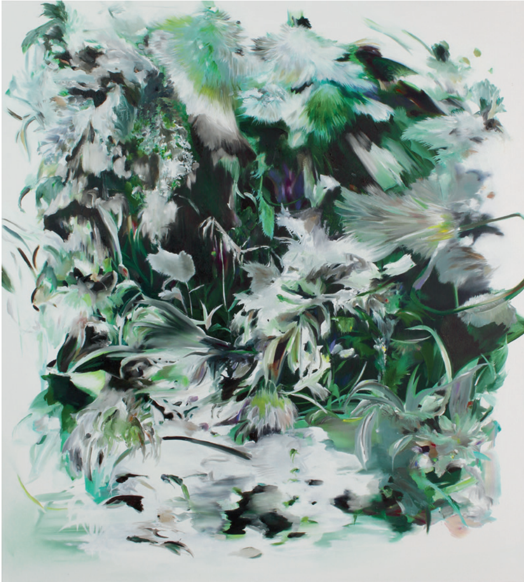
IN ZERBRECHENDER HELLE 2018, Öl auf Leinwand, 100 x 90 cm