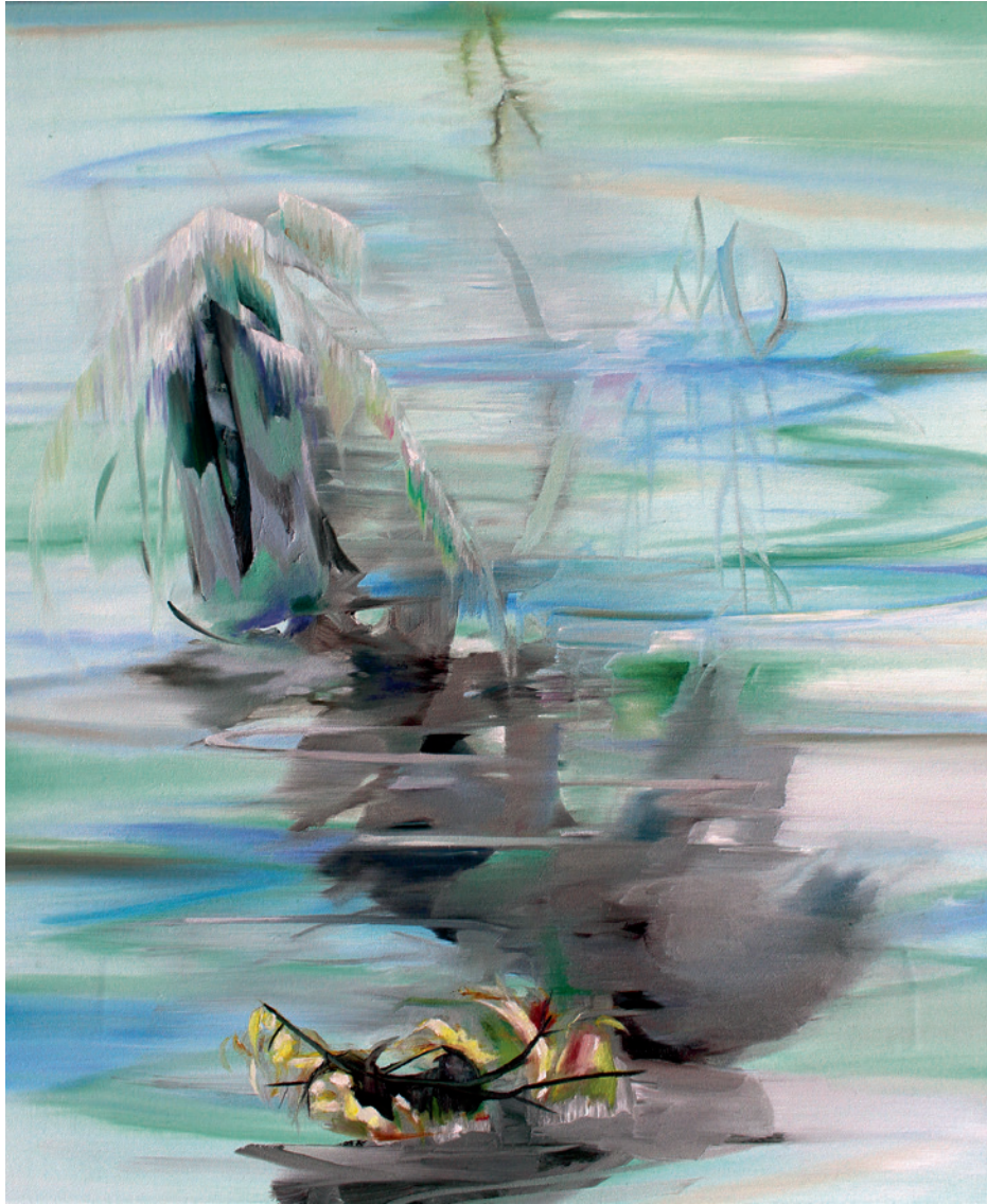
NEBELWASSER 2018, Öl auf Leinwand, 65 x 55 cm