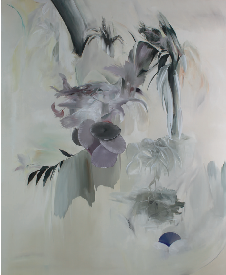
ERHABEN VERBUNDEN IN SANDIGEM STAUB