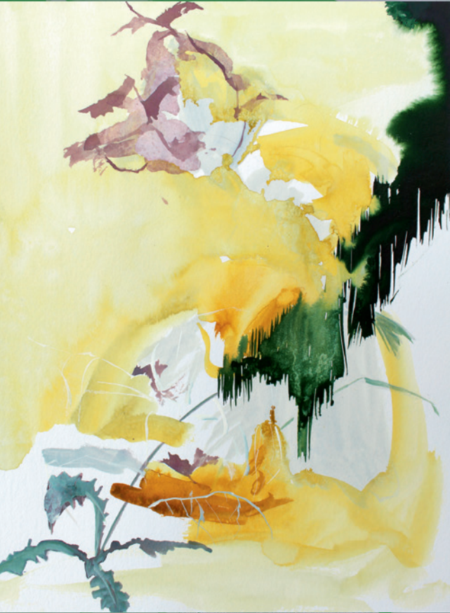
LEON HINTER GELBEN WOLKEN