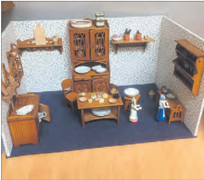
Eine entzückende Puppenstube, ausgestattet mit rustikalen Holzmöbeln, ist in der Sonderausstellung zu sehen.