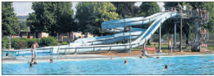
Die Rutsche im Schwimmbad bleibt zunächst gesperrt.

Das Angebot des Schwimmbades hängt im Wesentlichen vom Verhalten der Besucher und der Bereitschaft der Helfer ab, die Abstands- und Hygieneregeln einzuhalten beziehungsweise bei der Einhaltung der Regeln zu unterstützen. Dies ist ausschlaggebend