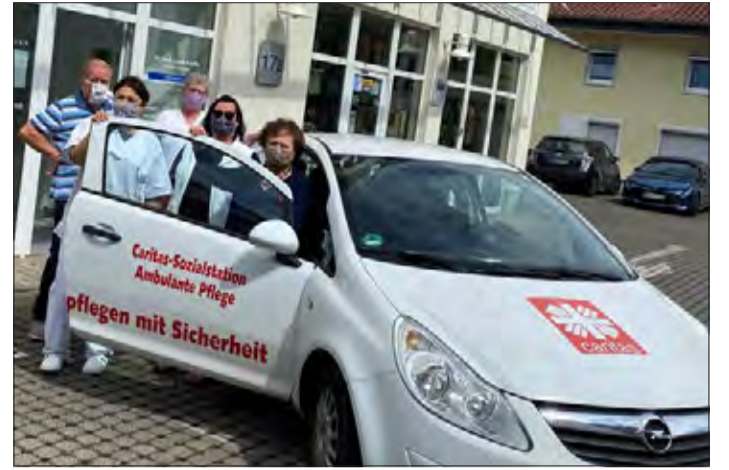
Einsatz in besonderen Zeiten: der ambulante Pflegedienst des Caritas-Verbandes in Bad Soden-Salmünster.