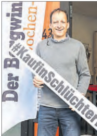
Lutz Bernhard, Bergwinkel Wochen-Bote