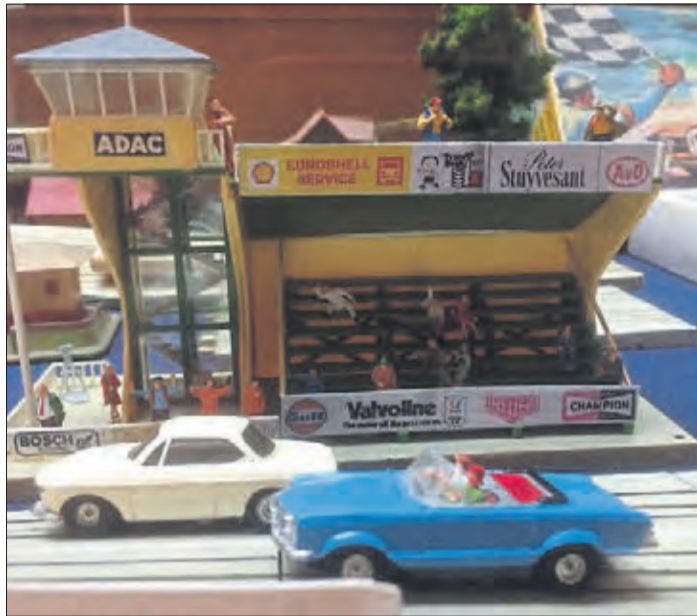
Die ausgestellten Spielsachen werden bei den erwachsenen Besuchern sicherlich viele Erinnerungen an die eigene Kindheit wecken.