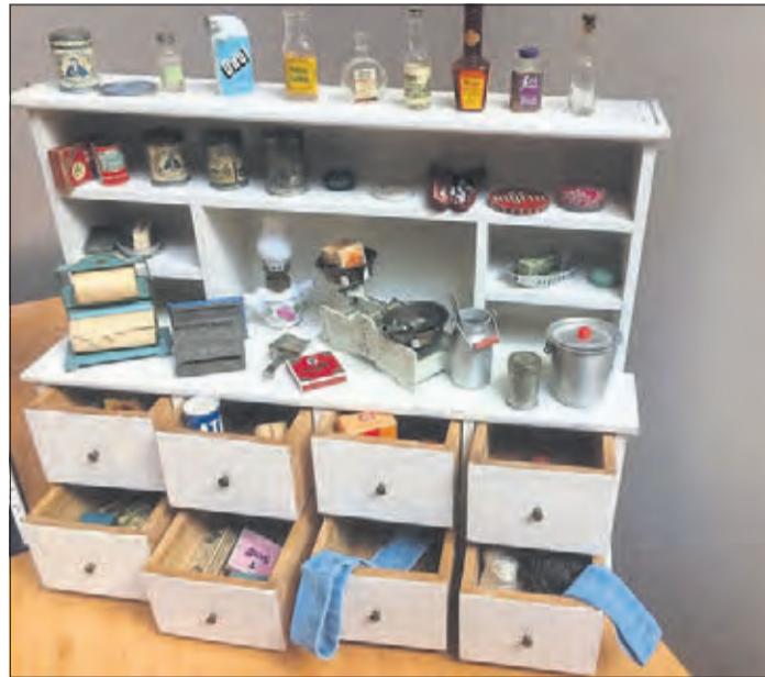
Mit großer Liebe zum Detail ist dieser Scharank bestückt – zu entdecken sind unter anderem ein Odol-Fläschchen und eine Melitta-Schachtel.