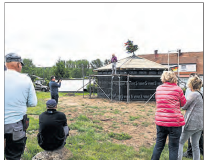
Der Richtspruch ist gesprochen. Der erste Honig soll im Wabenhaus in 2021 geerntet werden.

halfen und helfen etliche Ehrenamtliche bei der Errichtung des Wabenhonighauses.