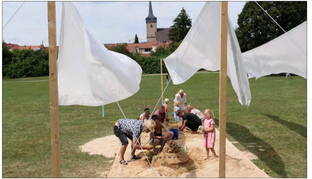
Mit Eifer widmete sich Groß und Klein dem Bau der Sandburgen auf der Mauerwiese.