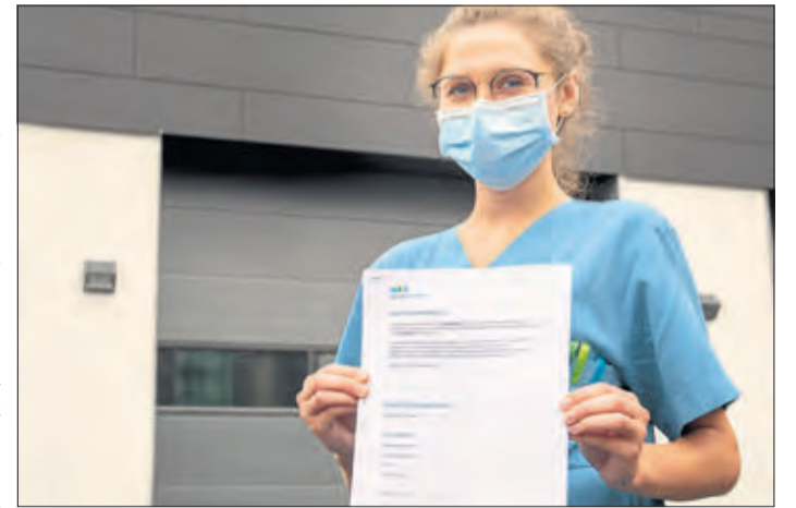
Besucher der Kliniken müssen ein Formular zur „Besuchsberechtigung“ ausfüllen.

Besucher, die die Kliniken betreten möchten, müssen ein entsprechendes Formular zur „Besuchsberechtigung“ ausfüllen, sich einem kurzen Gesundheitscheck unterziehen sowie Gesundheitsfragen wahrheitsgemäß beantworten. Beschleunigen können Besucher den Ablauf, in dem sie sich die Besuchsberechtigung bereits vorab auf der Klinik-Webseite ( www.mkkliniken.de/coronavirus.aspx ) herunterladen, ausdrucken und vorausgefüllt mitbringen. Nach der Prüfung der Dokumente und der Temperaturmessung können Besucher dann