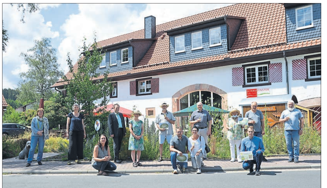
Die Gewinner der Wiesenmeisterschaft mit den Gratulanten bei der Preisübergabe vor der Geschäftsstelle des LPV in Jossgrund-Burgjoß.

ROMSTHAL (BWB). Unter Einhaltung der aktuell geltenden Hygiene- und Abstandsregeln lädt der MGW Heimatliebe Eckardroth alle Mitglieder für Freitag, 4. September, 19.30 Uhr, zur Jahresmitgliederversammlung in die Hüttengrundhalle in Romsthal ein.