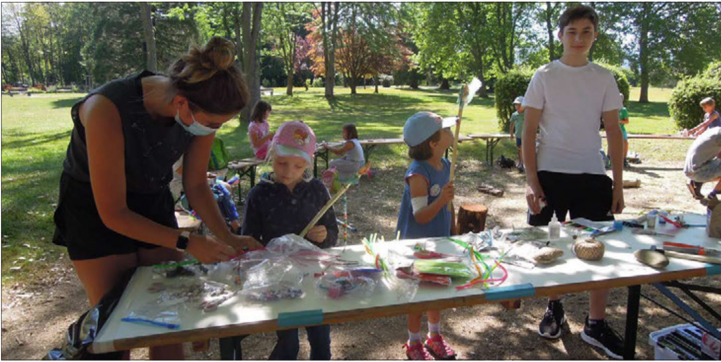
Stolz zeigten die Ferienspieler ihre geschnitzten und reich verzierten Zauberstäbe.