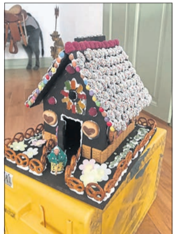
Das Knusperhaus kann in der Vorweihnachtszeit im ARTE-Magazin „Stadt Land Kunst“ bewundert werden.