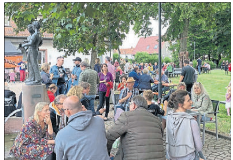
Für Begegnungen und gute Gespräche bietet der Markt beste Voraussetzungen.

halle fanden. Schließlich erlaubt es das ausgefeilte Hygienekonzept der Stadt nur 250 Menschen gleichzeitig, ihre Freizeit vor dem Stadtplatz zu verbringen. Auch am kommenden Freitag sollten die Besucher frühzeitig da sein. Denn dann spielt das Blasorchester der Stadtkapelle auf. Auch das übrige Angebot wird hervorragend genutzt. Seien es die ausgeschilderten Rad- und Wanderwege, die Ferienspiele für Kinder oder das Angebot des KulturWerks auf der Mauerwiese. „Die Männer und Frauen vom KulturWerk sind innovativ und engagiert. Es ist richtig klasse, was auf der Mauerwiese los ist“, sagt Möller. Gleiches gilt für die Schwimmbäder in Schlüchtern und Hutten sowie das Bergwinkel-Museum. „Die Bürgerinnen und Bürger, die in die Schwimmbäder kommen sind äußerst diszipliniert und halten sich an die Hygieneregeln“, sagt Matthias Möller. Bislang sei es zu keinerlei Klagen seitens des