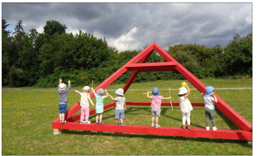
Beobachten, balancieren und klettern – die Sternenfänger-Kinder eroberten die Kunstwerke mit allen Sinnen.