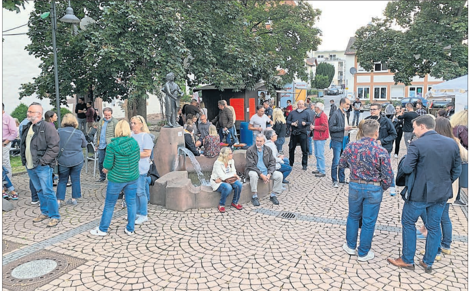
Die Einladung zum Feierabendmarkt, der jeden Freitagabend vor der Stadthalle stattfindet, wird von vielen Besuchern gerne angenommen.