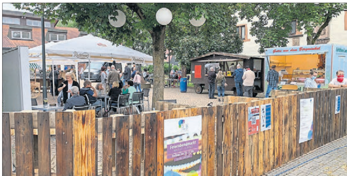
Am Freitag heißt es zum Feierabendmarkt: Früh da sein, denn das Blasorchester der Stadtkapelle spielt auf.

Ausdrücklich wirbt Möller auch noch einmal für das Kinoprogramm. Freitags (13 Uhr) und sonntags (15 Uhr) werden in der Stadthalle Filme für Kinder gezeigt, samstags (20 Uhr) und sonntags (18 Uhr) sind dann die Erwachsenen an der Reihe. „Aufgrund von Lizenzierungsaufgaben können wir leider nicht ankündigen, was wir zeigen. Aber ich kann sagen, dass wir ein qualitativ hohes Programm haben. Da ist für jeden Geschmack etwas dabei“, sagt Möller. Der Bürgermeister dankt allen, die zur Gestaltung von „Plan B“ beigetragen haben. „Das war richtig klasse, wie alle an einem Strang gezogen haben. Seien es die Mitarbeiter aus der Stadtverwaltung oder all die Ehrenamtlichen. Alle haben einen tollen Job gemacht.“ Nun hofft wirklich niemand, dass auch im Jahr 2021 wieder ein Alternativprogramm entwickelt werden muss. Aber eines ist Fakt: Schlüchtern und der Bürgermeister haben für den Notfall einen „Plan B“ in der Tasche.