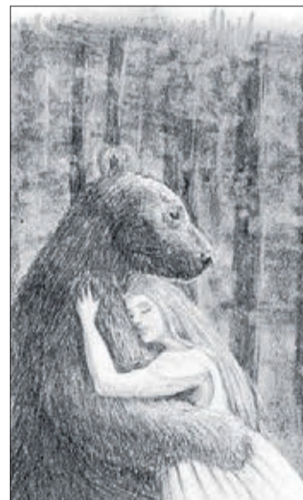
Zum Thema „Sterntaler“ gibt es zahlreiche Illustrationen.

Bei Fragen zum Projekt sind die beiden Wanderinnen zu jeder Zeit, auch nach dem 25. August