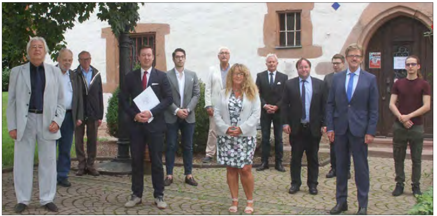
Der Vorstand der Europa-Akademie Schlüchtern vor dem Lauterschen Schlösschen.