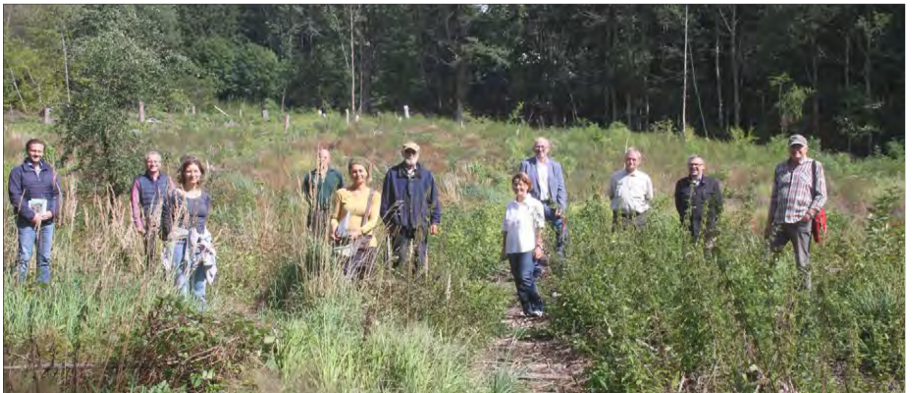
Aus der Brachfläche vor Drasenberg soll ein Zukunftswald entstehen.

Tausende Pflanzen sollen auf einer Forstfläche von einem Hektar von Schülern der Bergwinkel-Grundschule, der Stadt- und des Ulrich-von-Hutten-Gymnasiums gepflanzt und