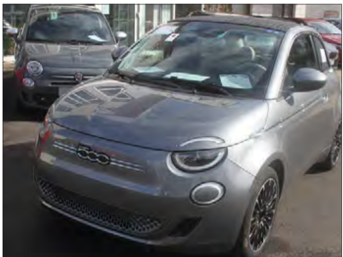
Der neue Elektro-500 kann bereits im Schlüchterner Fiat-Autohaus Wilhelm Fehl in der Grabenstraße besichtigt werden.

Zum Marktstart gebe es eine First Edition, die nur als Cabrio angeboten werde. „Der Fiat 500 kann teilautonom fahren. Dafür hat er verschiedene Assistenzsysteme an Bord.“