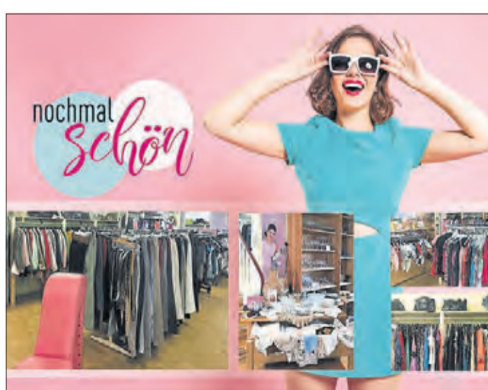
Im September ist Schlussverkauf im Second-Hand-Lädchen „nochmalschön“.

Mit einem Team von derzeit zwölf Frauen werden die Sach-