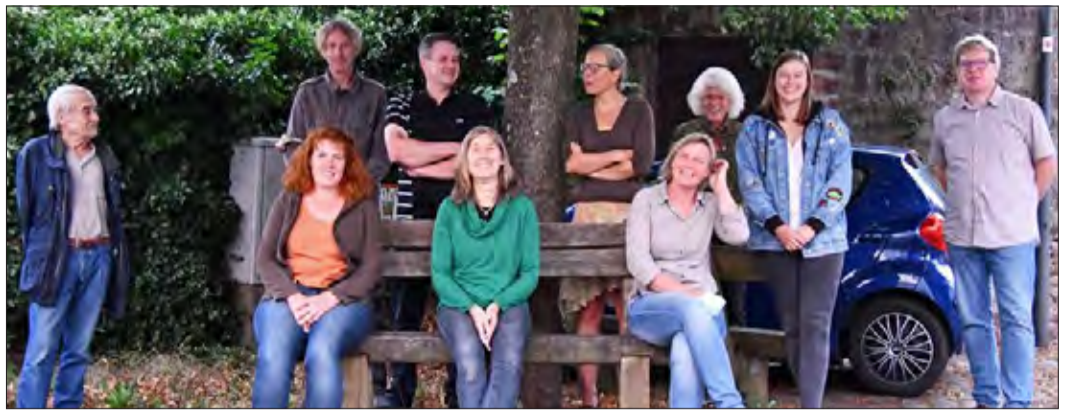
Auch nach dem Ende der NABU-Ortsgruppe Sinnatal wollen sich die ehemaligen Vorstandsmitglieder und Aktiven für den Schutz der heimischen Natur engagieren und begonnene Projekte fortführen.