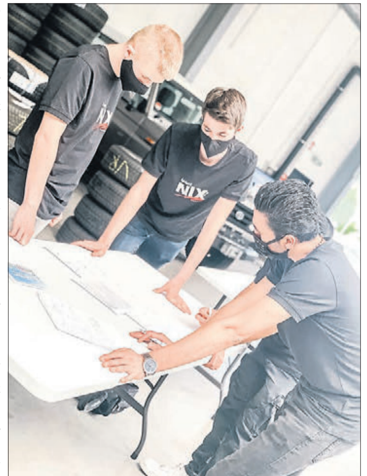
Mit einem zweitägigen Begrüßungsworkshop erleichterte Autohaus Nix den Auszubildenden den Start ins Berufsleben.

Bei ihrem zweiten Tag als Teil des Autohaus Nix-Teams lernten die Azubis die zentralen Abteilungen des Stammhauses in Wächtersbach kennen, erfuhren alles Wichtige zum Thema Berufsschule, Berichte und Organisatorisches im Arbeitsleben. Bei einer Busrundfahrt zu den Standorten im Rhein-Main Gebiet wurden die Strukturen und Abläufe im Autohaus sinnfällig gemacht. In den Katakomben des Lexus Forum Frankfurt hatten die Mädchen und Jungen die Gelegenheit, eine Reihe von Oldtimern zu bestaunen. Ein Highlight waren die Sportfahrzeuge von Lexus, deren Motor im Lexus Forum Darmstadt auch mal aufheulen durfte.