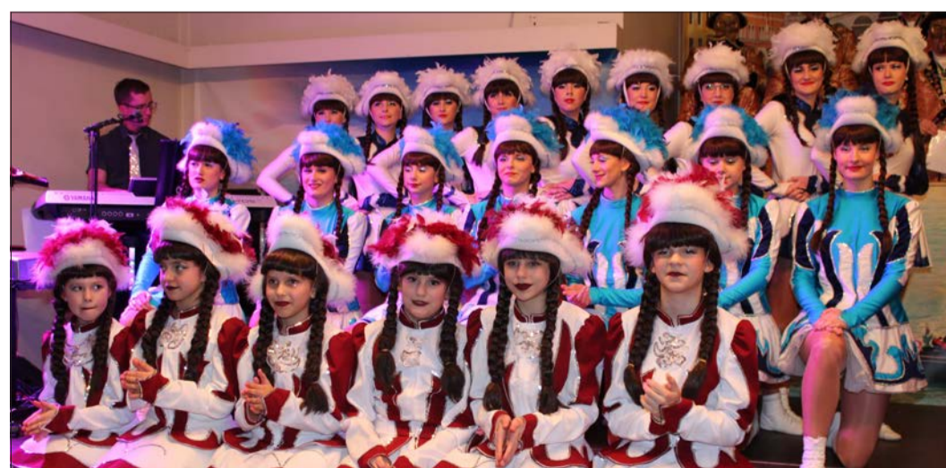
Dieses Bild wird es in der kommenden Kampagne in Wallroth nicht geben. Die Faschingsveranstaltungen sind Corona bedingt abgesagt.

Was viele befürchtet haben, ist jetzt Realität geworden: Die Kampagne 2020/21 fällt Corona zum Opfer. Nachdem bereits andere Faschingsvereine der Region bekannt gegeben haben, dass die gewohnten närrischen Großveranstaltungen nicht möglich sind, hat