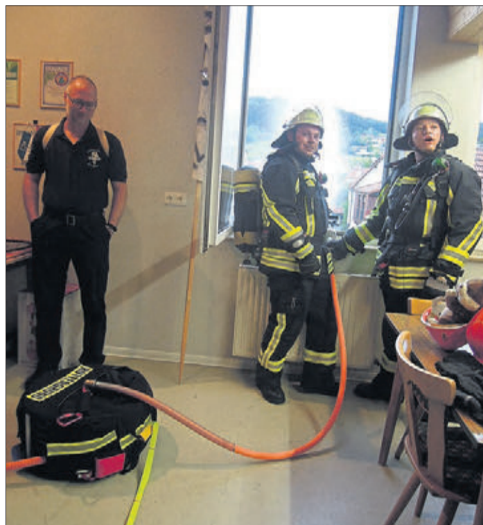
Mit dem Schlauchsystem TacBag (links unten) sind die Feuerwehrleute rascher am Einsatzort.