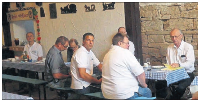
BBB-Mitglieder, Fraktionsmitglieder und Gäste waren zur Gedenkveranstaltung nach Elm gekommen.

abrufbar sowie kurze Clips von der Veranstaltung und anderen Ereignissen aus Schlüchterns Kommunalpolitik.