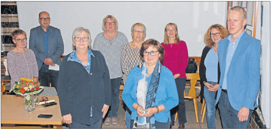
Der Vorstand der Lebenshilfe für Menschen mit Behinderung, Kreisvereinigung Schlüchtern.