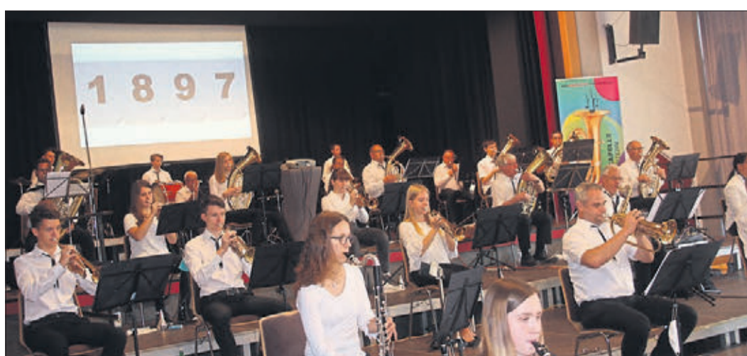
Das Sinfonische Blesorchester der Stadtkapelle konzertierte auf hohem Niveau.