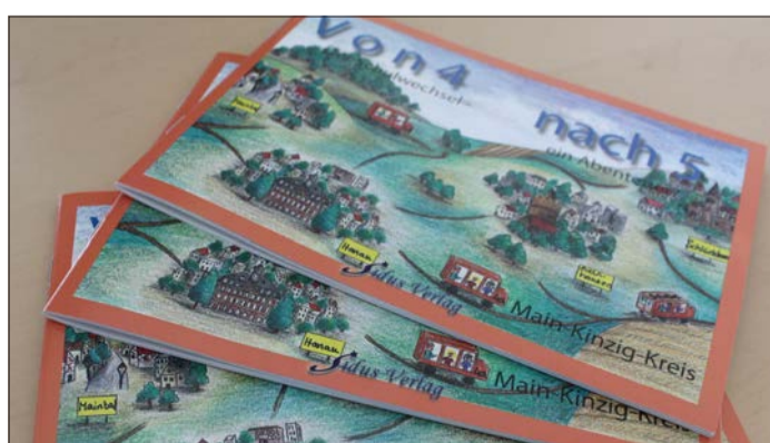
Die neue Auflage der Broschüre „Von 4 nach 5“ wird verteilt.