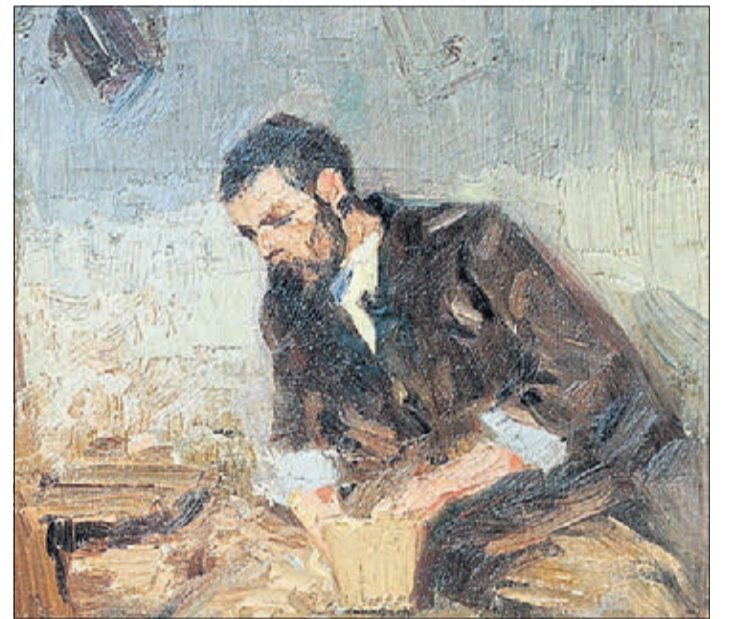
Einen Töpfer aus Wittgenborn hat Robert Sterl detailreich im Bild festgehalten.

öffnet. Der Zugang zu den Ausstellungsräumen erfolgt nach aktuellem Hygienekonzept etwa halbstündig. Besucher können die Zwischenzeit nutzen, um im Remisenkeller eine Erfrischung zu sich zu nehmen oder das Museum Steinau zu besuchen. Um