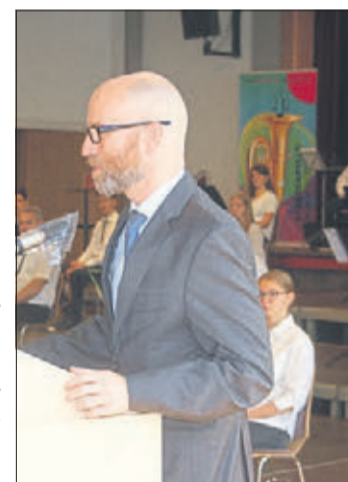
Der 9. November 1989 sei der glücklichste Tag des deutschen Volkes, davon ist Staatssekretär Dr. Peter Tauber überzeugt.

mals vor 30 Jahren als freiwilliger Beitritt der Deutschen Demokratischen Republik erfolgt sei. „Das war weder eine Übernahme, noch ein Anschluss oder gar eine Einverleibung.“ Für Ostdeutsche habe sich aber nahezu alles verändert. Während sich in der Bundesrepublik nach Kriegsende eine nivellierte Mittelschichtsgesellschaft herausgebildet habe, sei in der DDR ein Land der kleinen Leute entstanden. „Ostdeutsche und Westdeutsche unterscheiden sich in ihrem Verhältnis zur praktizierten Demokratie noch heute. Die Demokratiezufriedenheit liegt in den neuen Ländern konstant stets unter 50 Prozent. Links- und rechtspopulistische Parteien erhalten im Osten doppelt so hohe Stimmenanteile wie im Westen. Dennoch erscheint die deutsche Wiedervereinigung trotz aller Widrigkeiten und Probleme unter dem Strich als eine