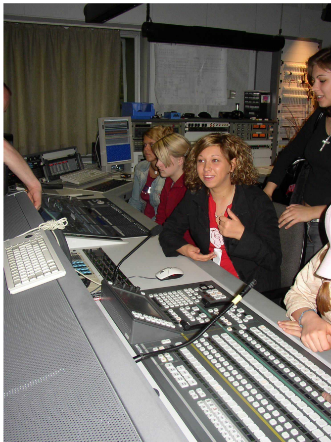
Mädchen am Bildmischpult beim ZDF in Mainz während der Produktion einer eigenen Probe-Talkshow