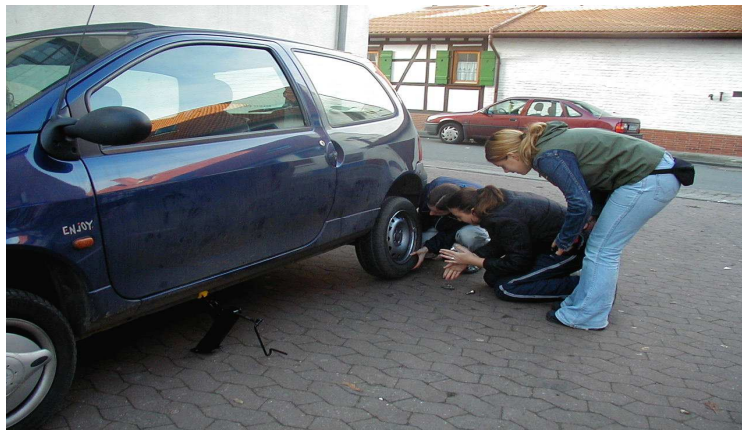
Mädchen beim Reifenwechsel