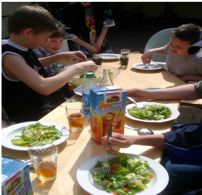
Jungen bei der gesunden und gelungenen Vorspeise

Bei einer Umfrage zu Beginn des Projektes ergab sich, dass fünf der acht Jungen zu Hause nur ganz selten beim Kochen mithelfen. Trotz dieser Ausgangslage war dann das Lernen voneinander, sowie die Zusammenarbeit wichtigste Basis für das doch allen gut schmeckende Essen. Das 3-Gänge-Menue bestand aus einem bunten Salat, Nudeln mit Hackfleisch- und Käsesoße und einem selbstgemachten Obstsalat.