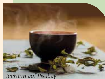
TeeFarm auf Pixabay

Ein Tee aus Eibischwurzeln wird ganz besonders zubereitet. Statt mit heißem Wasser wird ein gehäufter Teelöffel der Wurzelstückchen mit kaltem Wasser aufgegossen, eine