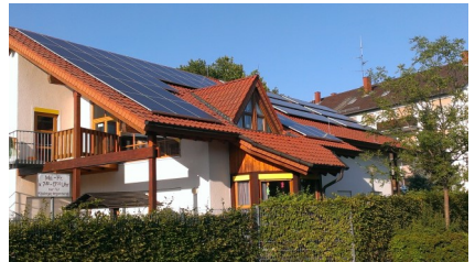
Die Kita im Schelmböhl

Die Ausbaugrenze von 52 Gigawatt Leistung für PV-Anlagen rückt in Sichtweite. Eine EEG-Vergütung darüber hinaus wird es dann nicht mehr geben. Daher steigt die Unsicherheit bei der Projektentwicklung - auch bei uns. Im Grunde sollte