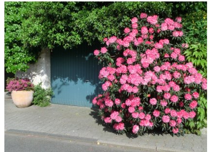
Gesehen in der Hochstraße