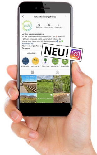
Die IUHAS auf Instagram

https://www.instagram.com/natuerlich_bergstrasse/