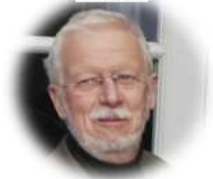
Fraktionsvorsitzender der IUHAS