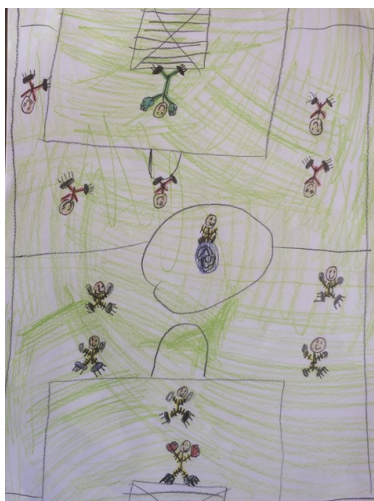
„Spiel des Jahres“ von Sebastian Weise, gemalt im 2. Schuljahr

Warum ist es so schwer, zusätzliche Freizeitangebote für unseren Nachwuchs bereitzustellen? Bereits 2017 wurde die Errichtung einer Streetball-Anlage von der Mehrheit der Gemeindevertreter abgelehnt. Auch damals war ein Sperrvermerk im Spiel und wurde trotz des Antrags der IUHAS nicht aufgehoben.