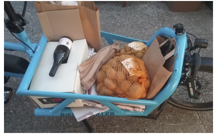
Großeinkauf mit dem Fahrrad

Der Konsument wählt online die Produkte aus und bezahlt ebenfalls online. Einmal in der Woche treffen sich Produzent und Konsumenten zum Austausch der Waren. Hierbei haben beide Gruppierungen die Möglichkeit, einander kennenzulernen. Auf der Seite der Konsumenten besteht häufig die Besorgnis, ob die Ware wirklich aus der Region stammt und wie weit diese bio ist. Diese verflüchtigt sich, wenn die Produzenten anwesend sind, vielleicht sogar auch auf ihren Hof einladen und die Produktion transparent machen.