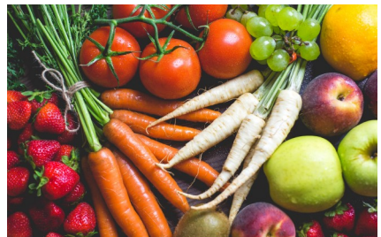
Produkte direkt vom Erzeuger

Für den Produzenten besteht der Vorteil, dass er nicht lange Stunden auf dem Markt verbringen muss. Er ist maximal einmal die Woche für zwei Stunden anwesend. Er weiß genau, was er mitnehmen muss, da die Ware ja schon bestellt und bezahlt ist. Gerade für Produzenten aus kleinen Ortschaften im ländlichen Raum ist dies eine gute zusätzliche Vermarktungsmöglichkeit. Jederzeit kann er sein Sortiment verändern, d.h. neue Produkte einstellen oder nicht mehr vorhandene herausnehmen.