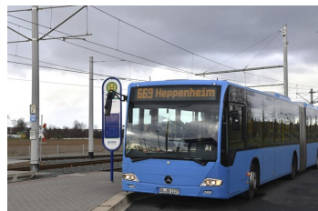
ÖPNV in Alsbach-Hähnlein

Bisher kostet die Hin- und Rückfahrt in der "Wabe", in der Alsbach-Hähnlein liegt, 4,20 Euro - egal, ob man von Hähnlein in die Pfarrtanne zum Einkaufen, nach Alsbach zum Arzt oder nach Malchen zum Besuch eines Restaurants fährt. Unser Anliegen ist es, insbesondere Menschen, die auf den Öffentlichen Personennahverkehr (ÖPNV) angewiesen sind, ein günstiges Angebot zu machen. Außerdem kann erwartet werden, dass es einige Umsteiger vom Auto auf den ÖPNV geben wird. Damit würde die vorhandene Infrastruktur besser genutzt werden.