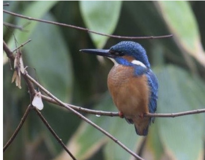
Ein Eisvogel, gesichtet in einem Garten in der Straße Am Katherinenberg in Alsbach