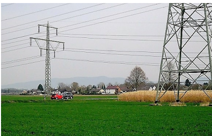
Hochspannungsleitungen am Ortsrand von Hähnlein

Die Planungen für die Veränderung der Überland-Stromleitungen westlich von Hähnlein durch die Firma Amprion laufen. Neben der neuen Gleichstromleitung (Ultraset) sollen die Masten der bestehenden 380 kV-Leitung durch neue ersetzt werden.