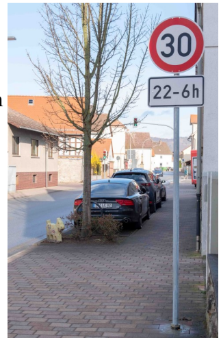
Tempo 30 in Hähnlein: Die Ziege passt auf

Endlich ist es soweit: Tempo 30 im zentralen Bereich der Ortsdurchfahrt im OT Hähnlein. Der Wunsch nach einer Beruhigung im Innerortsbereich der L3112 existiert schon lange. Fahrt nahm das Thema nochmals auf durch eine Aktion der IUHAS: Die Gaase-Paadie am 1. Juli 2018. Die Gaas (Ziege) ist das Symboltier für Hähnlein. Früher galt sie als die Kuh des kleinen Mannes. Anlass für die Veranstaltung war das Werben mit kunstvoll gestalteten Ziegen aus Beton für Tempo 30 in der Ortsdurchfahrt von Hähnlein. Nach erneuten Lärmmessungen hat Hessenmobil als verantwortliche Behörde zumindest für die Nachtstunden ein Tempo-Limit verfügt. Tagsüber müssen weiterhin die Ziegen für eine Temporeduzierung werben.