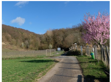
Weinlage Schöntal im OT Alsbach

Aber nun hat Alsbach-Hähnlein seit gut 3 Jahren einen eigenen ortsansässigen Winzer, der es versteht, das schöne Alsbacher Schöntal als Winzer zu bewirtschaften. Schon jetzt ist dieser Wein für Weinkenner der Geheimtipp unter den Bergsträsser Weinen. Und genau dieser Winzer sucht seit Jahren ein geeignetes Grundstück in unserer