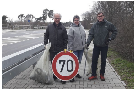
Müllsammelaktion: Fundstück auf dem Fahrradweg

Auffallend war die weiterhin hohe Anzahl von Einwegbechern. Die Problematik ist nicht neu, bleibt aber aktuell. Genauso wie die Plastiktüte ist der Einwegbecher ein Zeichen für den achtlosen Umgang mit Ressourcen.