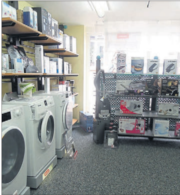
Groß- und Kleingeräte verschiedener Hersteller sind im Elektrofachgeschäft Weitzel zu haben.