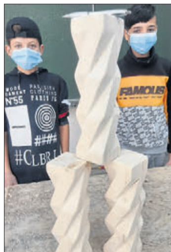
Alle Werkstücke konnten von den stolzen Schülern mit nach Hause genommen werden.

auch der Aspekt „Ordnung am Arbeitsplatz“ wurde keineswegs vernachlässigt.