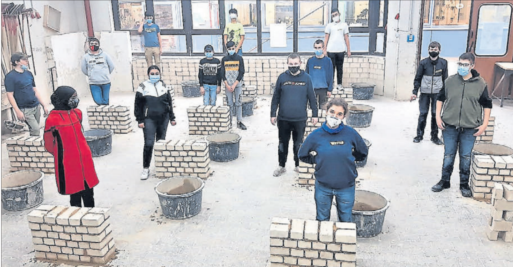
Die Achtklässler des Hauptschulzweiges der Stadt Schlüchtern erhielten auf der Lehrbaustelle des Bildungszentrums die Gelegenheit, handwerkliche Ausbildungsberufe kennenzulernen und ihre Fähigkeiten auszuprobieren.