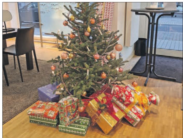
Viele Weihnachtspäckchen kamen bei der Aktion von Neusehland zusammen.