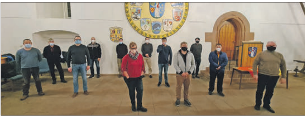
Zur Kommunalwahl im nächsten Jahr tritt die Unabhängige Bürgerliste (UBL) mit bekannten, aber auch vielen neuen Gesichtern an.