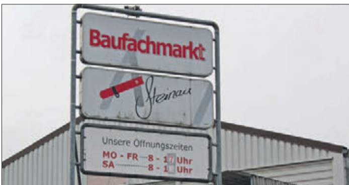
Nach 20-jährigem Betrieb schließt nun der Steinauer Baufachmarkt.

Doch damit ist nun endgültig Schluss. Zum Jahresende schließt