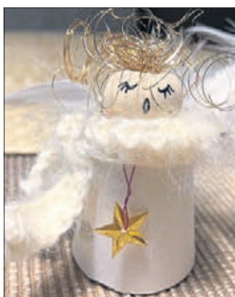
Einer der kunstvoll gestalteten Breunis.

Zu Ostern hatten die Frauen Zwiebeleier verteilt, und auch einige Baumstämme im Dorf ver-