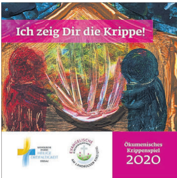
Das Cover des Krippenspielheftes.

gelischer Kindergarten „Unterm Regenbogen“ Wallroth, katholischer Kindertagesstätte „Unterm Regenbogen“ Ulmbach Text, Auswahl, Redaktion: Pfarrerehepaar Eisenbach Satz/Layout: Jochen Schäfer (Kressenbach)