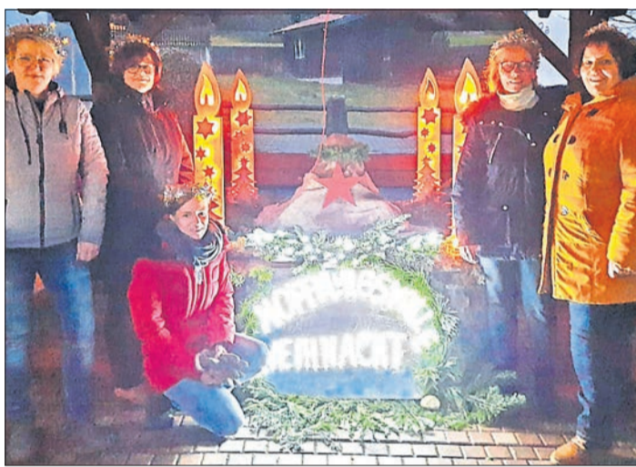
Die kreativen Breuningser Frauen trafen sich für ihre Verteilaktion vor dem Brunnen am Feuerwehrgerätehaus.

Abschließend appelliert der Vorsitzende an die Bevölkerung, sich dem sozialen Netzwerk der AWO anzuschließen und Mitglied zu werden. Aufnahmeanträge können bei ihm abgefordert werden.