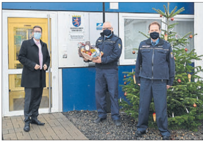
Landrat Thorsten Stolz (links) besuchte die Polizeistationen im Main-Kinzig-Kreis, auch den Kollegen der Polizeistation in Schlüchtern überbrachte er einen Präsentkorb.