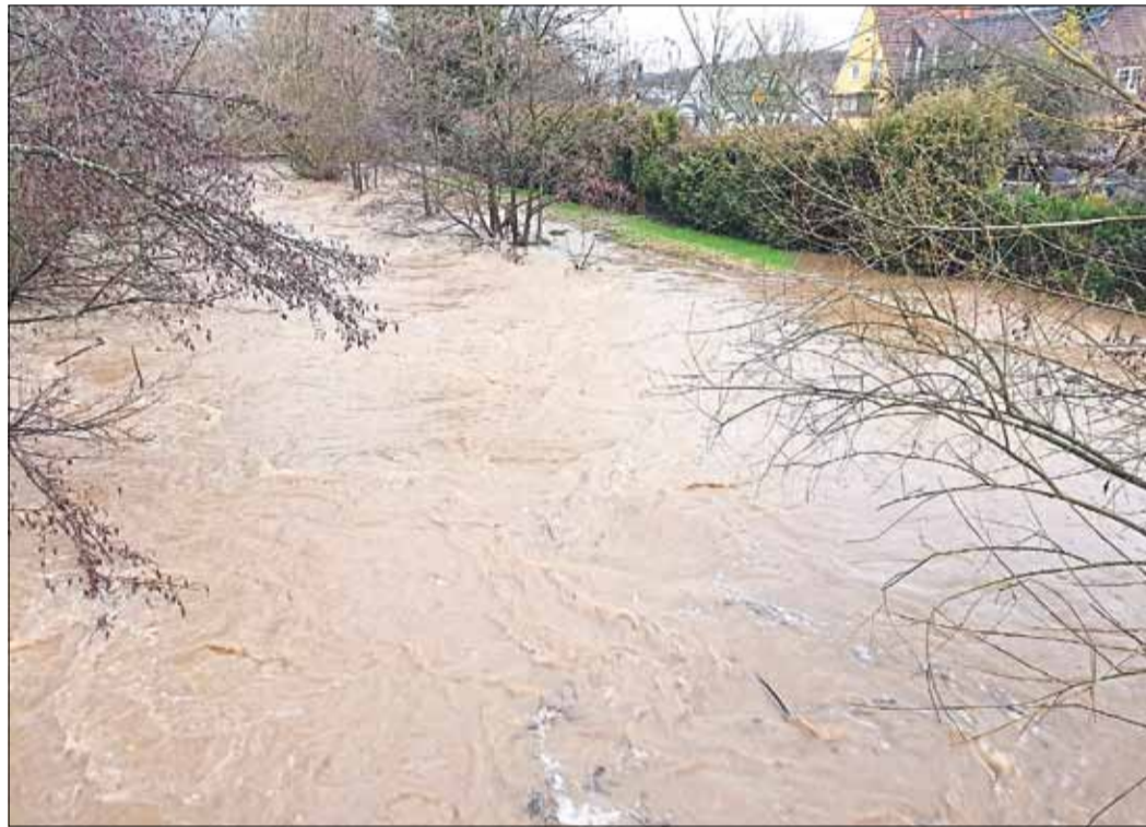
Land unter – zum Teil stark gefrorene Böden, Schneeschmelze und Dauerregen führten vielerorts zu Hochwasser.