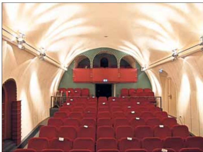
Derzeit bleiben die Sitze des Theatriums Steinau zwar leer, dafür erhielt der Saal einige neue Farbakzente.

2020 spontan ins Leben gerufen, entwickelte sich das Sommertheater, das an drei Wochenenden im