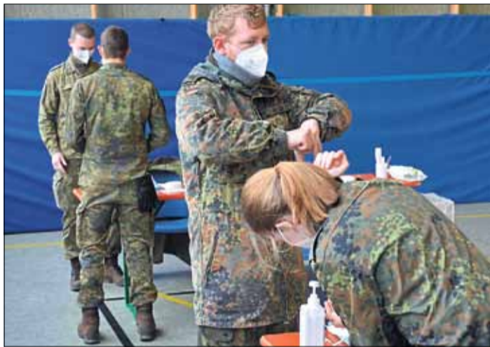
Im Jugendzentrum Ronneburg wurden die Soldatinnen und Soldaten für ihre Aufgabe in den Altenheimen ausgebildet.

MAIN-KINZIG-KREIS (BWB). Seit vergangener Dienstag helfen Kräfte der Bundeswehr in mehreren Altenheimen im Main-Kinzig-Kreis bei der Durchführung der Schnelltests. Die rund 50 Soldatinnen und Soldaten waren am Montag im Jugendzentrum Ronneburg von Beschäftigten des Deutschen Roten Kreuzes auf diese neue Aufgabe vorbereitet worden.