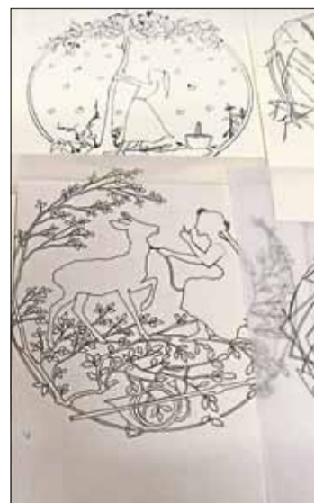
Einige der insgesamt 30 Märchenmotive in Scherenschnittoptik.