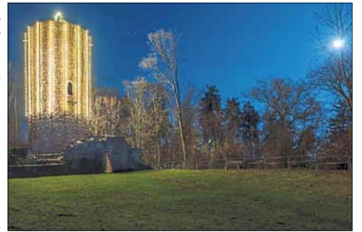
Weithin sichtbar leuchtet eine große Kerze auf der Burgruine Stolzenberg über das gesamte Stadtgebiet.

Sie ruft dazu auf, jeden Freitag bei Einbruch der Dämmerung ein Licht als Zeichen der Solidarität für die Coronaopfer gut sichtbar im Fenster aufzustellen. „In Zeiten von Corona ist der Tod oft einsam – für Sterbende und Hinterbliebene. Eine tröstende Hand in schweren Zeiten ist vielfach nicht möglich“, weiß Bürgermeister Brasch und ergänzt: „Jedes Licht ist ein Zeichen für Solidarität und