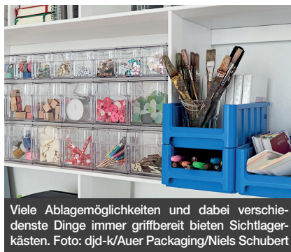
Viele Ablagemöglichkeiten und dabei verschiedenste Dinge immer griffbereit bieten Sichtlagerkästen.