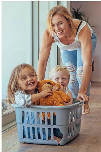
Die Familie macht Freude, kostet aber auch viel Energie.

(djd-k). Moderne Frauen müssen Partnerschaft, Kinder, Beruf, Haushalt, Freunde und Hobbys unter einen Hut bekommen. Meist bewältigen sie all diese Aufgaben mit bewundernswerter Energie. Nur an den Tagen vor den Tagen wird es vielen Frauen zu viel. Das prämenstruelle