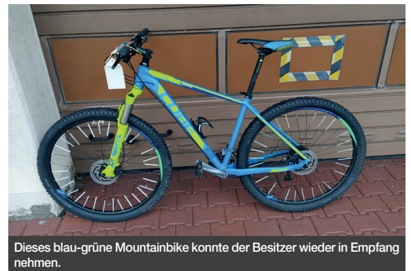
Dieses blau-grüne Mountainbike konnte der Besitzer wieder in Empfang nehmen.

Neben den gestohlenen Rädern, die man zu finden gehofft hatte, fanden die Ermittler auch ein neuwertiges Mountainbike der Marke Cube. Sie schöpften Verdacht, dass es sich bei dem Cube-Rad ebenfalls um Diebesgut handelt, da der Mann keinen Eigentumsnachweis z.B. eine Rechnung vorlegen konnte. Deshalb nahmen sie es kurzerhand als Zufallsfund mit. Die Recherchen nach der Geschichte des Rades verliefen jedoch nicht einfach. Der eigentliche Besitzer hatte offenbar das Rad nicht als gestohlen gemeldet oder seinen Verlust noch gar nicht bemerkt. Es fand sich dazu keine Strafanzeige. Wem gehörte also das Rad und wie war es in die Wohnung in Bad Nauheim gelangt? Eine Veröffentlichung in der Presse brachte die mit den Ermittlungen betraute Polizistin weiter. Es meldete sich jemand der