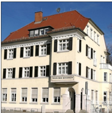
Haus der Senioren in Rüsselsheim

Wer etwas bewegen will, muss dort, wo entschieden wird, mitsprechen. Entsprechend hat sich die Generationenhilfe Rüsselsheim an den Seniorenbeiratswahlen der Stadt in den Jahren 2003, 2007, 2011 und 2016 jeweils mit einer eigenen Liste beteiligt und arbeitet seit dieser Zeit an maßgeblicher Stelle im Vorstand des Beirats mit.