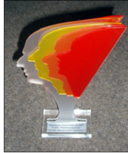
Hess. Altenhilfe-Preis 2007

Im Jahr 2007 wurde die Generationenhilfe Rüsselsheim e.V. für ihr neues, damals wohl bundesweit einzigartiges Projekt der Patientenbegleitung mit dem Hessischen Altenhilfe-Preis ausgezeichnet. Dieses Projekt setzt sich zum Ziel, einsamen alten Menschen die Entlassung aus dem Rüsselsheimer Krankenhaus durch Vorbesprechung und Begleitung zu erleichtern.