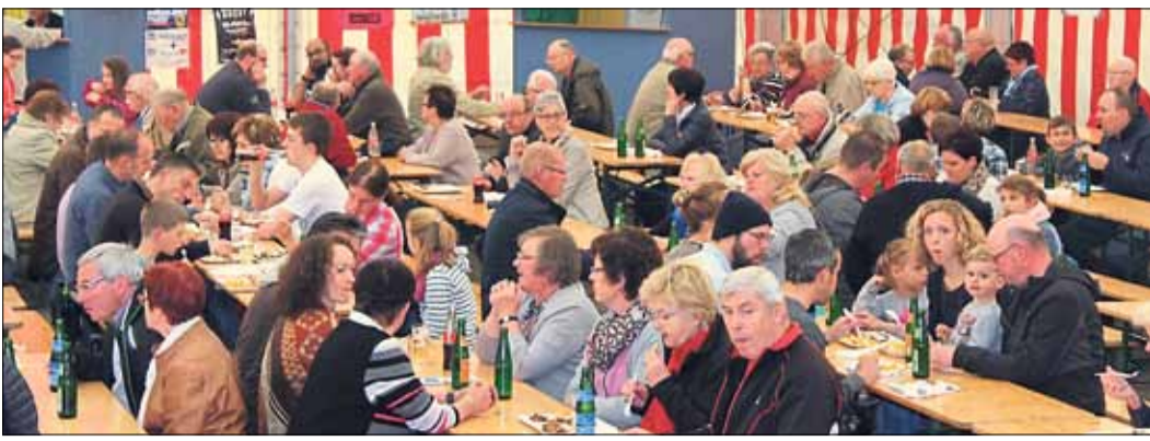
Wie alljährlich herrschte auch beim letzten Forellenfest im Mai 2019 Hochbetrieb im Festzelt.