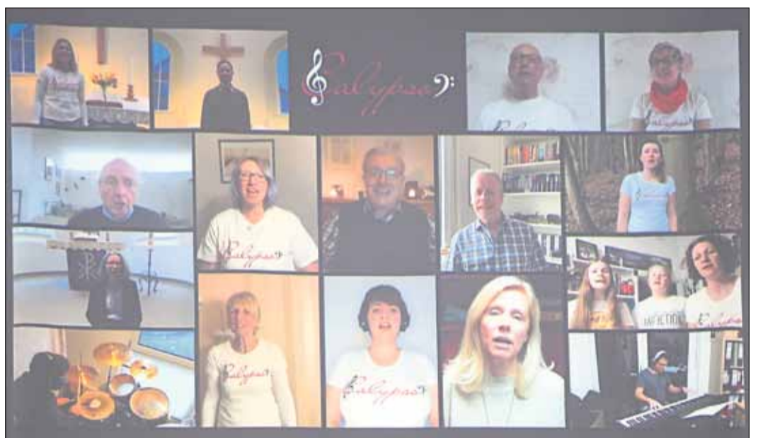
Einige Sängerinnen und Sänger bei ihren Video-Aufnahmen.