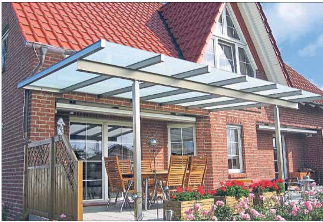
Terrassendächer bieten das besondere Etwas.

Ein Wintergarten wiederum ist ein geschlossener Raum, der den Wohnbereich vergrößert und aus viel Glas gebaut wird. Damit es auch im Sommer angenehm kühl bleibt, stehen verschiedene Sonnenschutz-Isoliergläser zur Verfügung. Es gibt beschichtete Verglasungen, die bis zu 80 Prozent der aufheizenden Wärmestrahlung reflektieren, oder glasinter-