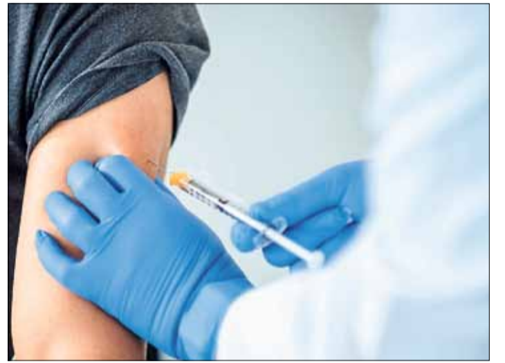
In unserer Telefonaktion erhalten die Anrufer wissenschaftlich fundierte Informationen zur Corona-Schutzimpfung.

mit wissenschaftlich fundierten Informationen zur Verfügung. Sie haben Fragen zur Sicherheit und