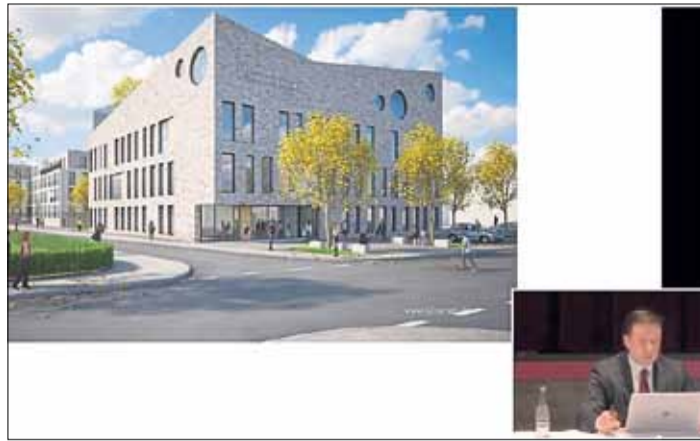
So könnte das Kultur- und Begegnungszentrum aussehen.

stünden weitere fünf Gebäude. „Damit schaffen wir Wohnraum für 250 bis 300 Menschen.“ Möller geht davon aus, dass sich ausreichend Bieter fänden.