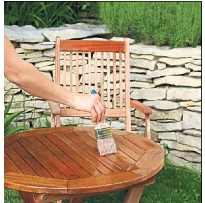
Einfache Anwendung mit dem Pinsel ohne Grundierung. Die Lasuren trocknen schnell und sind ergiebig.

H2-Lasuren eignen sich auch für größere Flächen im Außenbereich wie Zäune, Pergolen, Sichtschutzwände und aufgrund ihrer Elastizität auch für Holzfassaden, die sonst leicht splintern. Sie lassen sich ohne Grundierung leicht mit dem Pinsel auftragen, trocknen schnell und sind ergiebig. Bei glatt geschliffenem Holz genügt in der