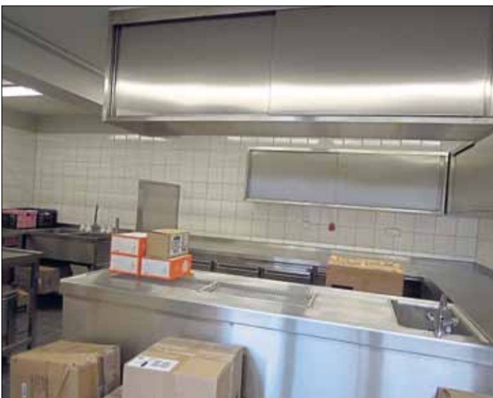
In der Küche warten die Utensilien auf das Einräumen in die Schränke.

tionen. Der Verein „Generationentreff Salmünster“ hat derzeit 150 Mitglieder, weitere seien gerne willkommen, betonte Weber. www.generationentreff-salmuenster.de