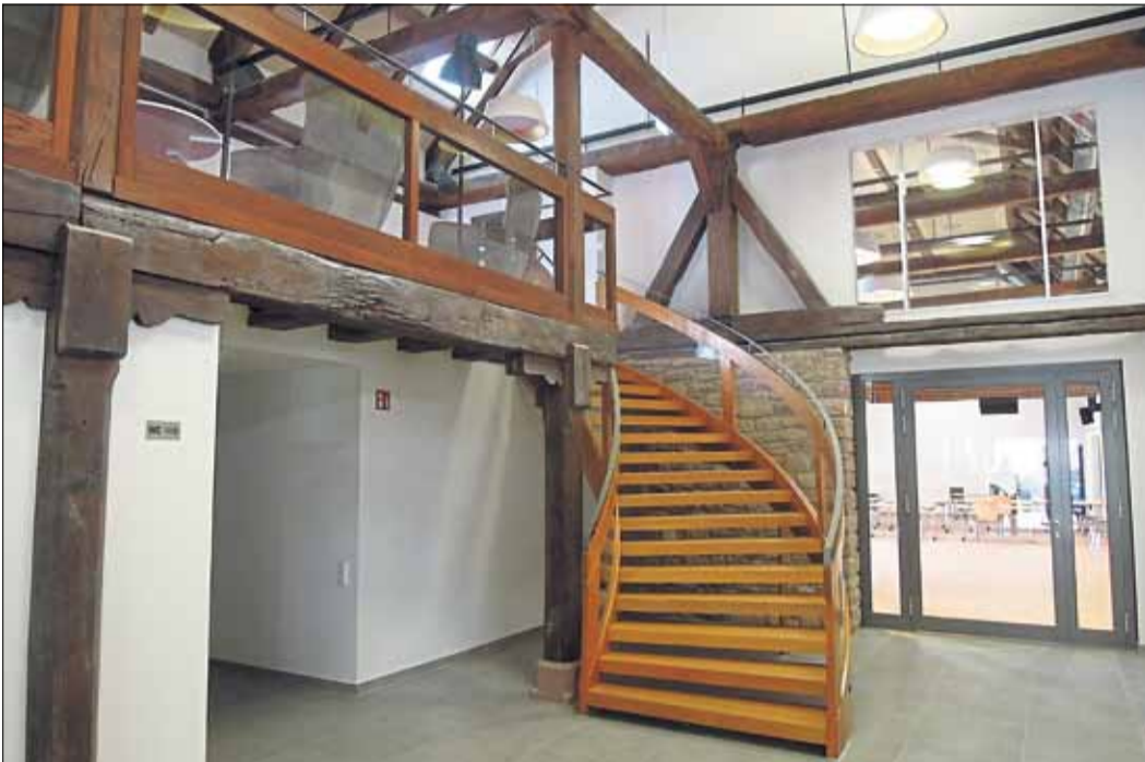
Die aufgearbeitete Holzterrasse führt mit elegantem Schwung ins Obergeschoss mit Galerie.