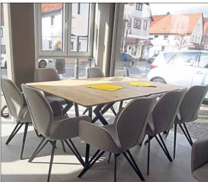
Im Erdgeschoss hat der Gruppenraum „Kinzigal“ durch zwei Glasfronten enge Verbindung zum Stadtleben.