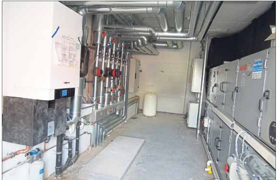
Heizung und Lüftungsanlage sind im Dachgeschoss untergebracht.