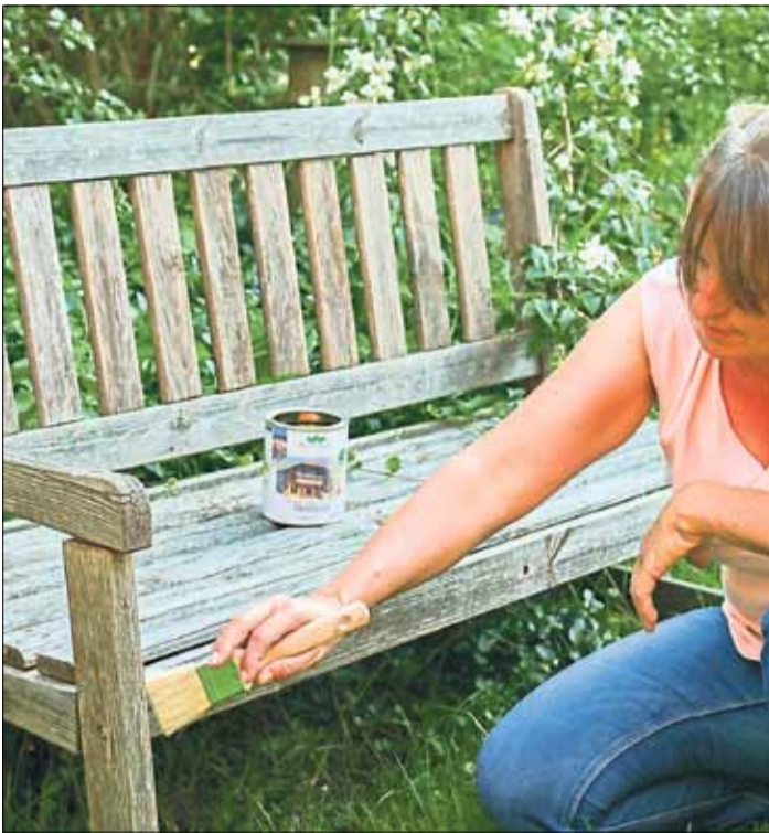
Das Holz im Außenbereich hat sichtlich unter Nässe, Schnee und Frost gelitten.