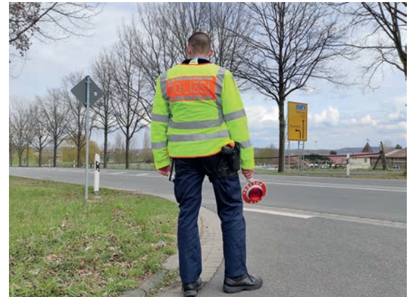
Die Kontrollgruppe der Wetterauer Polizeidirektion führte am 15. April an der B521 bei Altenstadt Verkehrskontrollen durch.

Positiv anzumerken ist, dass im genannten Zeitraum keine Verstöße gegen bestehende Bestimmungen zur Bekämpfung der Pandemie festgestellt wurden.