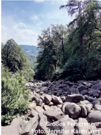
Großes Felsenmeer

Die Felsblöcke laden zum Klettern und Spielen ein