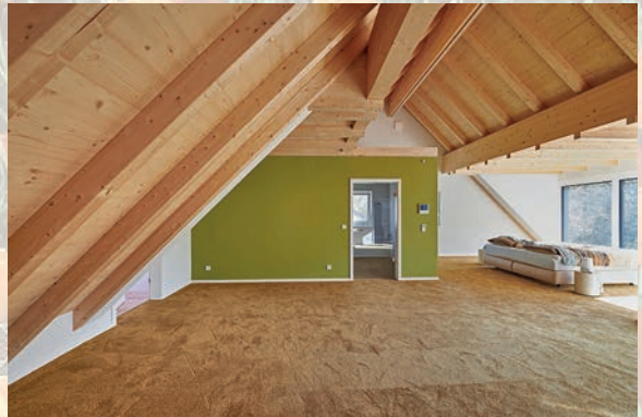
Wohnraum ist teuer. Die Grundfläche des Hauses sollte daher in jedem Stockwerk optimal genutzt werden.

(djd). In den 2010er-Jahren lebten erstmals mehr als 50 Prozent der Menschen weltweit in Städten. Für 2050 rechnen die Vereinten Nationen mit einem Anstieg auf 70 Prozent. Zwar schreitet der Trend zur Urbanisierung in Deutschland nicht so schnell voran wie in anderen Weltregionen. Dennoch ist auch hierzulande zu beobachten, dass Grundstücke und Wohnraum nicht nur in den Metropolen, sondern ebenfalls in den Mittelstädten knapp werden. Fläche ist teuer – bei Neubauten und in der baulichen Erweiterung von Altbauten nimmt daher das Thema raumsparendes Bauen an Bedeutung zu. Gefragt sind clevere Grundrisse und Baumaterialien, die nicht mehr Grundfläche verbrauchen als unbedingt nötig.