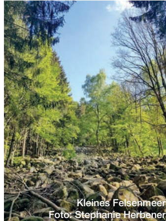
Kleines Felsenmeer

Das spektakuläre Naturdenkmal Felsenmeer liegt an den Hängen des Felsbergs im Lautertal und ist das Produkt von geologischen Prozessen, die vor etwa 340 Millionen Jahren begannen. Damals driften zwei Kontinente aufeinander zu und kollidierten im Gebiet