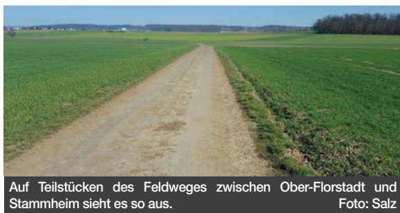
Auf Teilstücken des Feldweges zwischen Ober-Florstadt und Stammheim sieht es so aus.