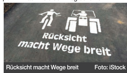
Rücksicht macht Wege breit

Die allermeisten Landwirte kehren nach erfolgter Feldbestellung die Wege, sofern das nötig ist. Dazu haben die Ortslandwirte zumindest in Florstadt entsprechende ausleihbare Werkzeuge, die unkompliziert an den Zugmaschinen angebracht werden können. Es gibt allerdings immer wieder schwarze Schafe, die hier allen Radfahrer*innen das Leben schwer machen. Dies sollte aufhören. Salz: „Sicherer. Genau so muss man es sich beim Radfahren vorstellen, wenn große oder festgefahrene Lehmklumpen auf dem Weg liegen. Es ruckelt und die Geschwindigkeit wird deutlich vermindert. Das macht keinen Spaß!