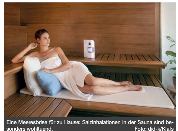
Eine Meeresbrise für zu Hause: Salzinhaltungen in der Sauna sind besonders wohltuend.

(djd-k). Regelmäßiges Saunieren tut Körper und Geist gut und stärkt gleichzeitig das Immunsystem. Nochmals verstärken lässt sich der wohltuende Effekt durch eine Salzinhaltung. Fast wie bei einem ausgiebigen Strandspaziergang können feine Aerosole dafür sorgen, die Lufte zu reinigen. Tiefes Einatmen kann entzündungshemmend und desinfizierend wirken. Ebenso freut sich die Haut über den reinigenden Salznebel. Kompakte Geräte wie der Microsalt SaltProX von Klafs ermöglichen diese entspannende Anwendung auch zu Hause in der privaten