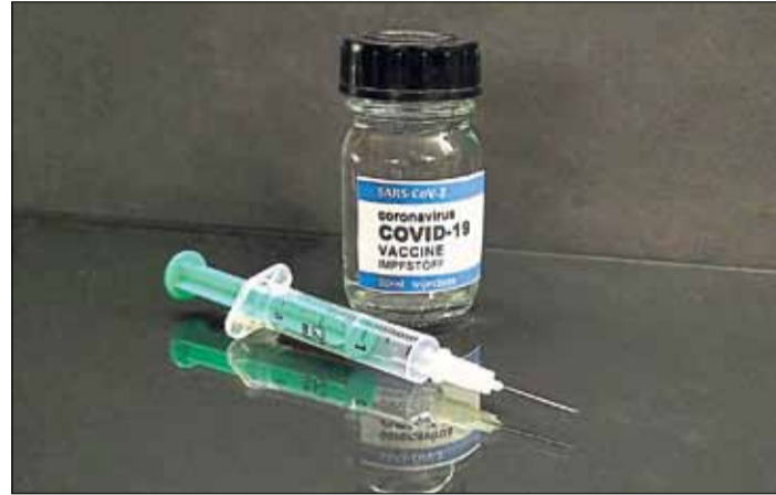
Unsere Leserinnen und Leser hatten viele Fragen rund um die Corona-Schutzimpfung. Das Expertenteam der Bundeszentrale für gesundheitliche Aufklärung hatte die Antworten.

dert bei Erkrankungen die Symptome. Keiner der zweimal geimpften Studienteilnehmer musste nach einer AstraZeneca-Impfung wegen einer Corona-Infektion im Krankenhaus behandelt werden.