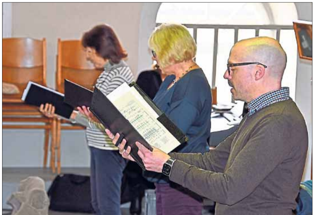
Von der Empore aus bescheren die Sängerinnen und Sänger den Gottesdienstbesuchern einen angenehmen Hörerlebnis.