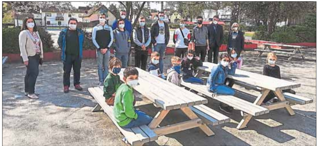
Die Grundschul Kinder nahmen die neuen Bänke sofort in Besitz und freuen sich mit der Schulleitung und dem Kollegium über die Sitzgelegenheiten.

SCHLÜCHTERN (BWB). Dieses Schuljahr ist durch die Corona-Pandemie geprägt. Aus diesem Grund blieb es den Schülerinnen und Schülern, die die Bildungsgänge zur Berufsvorbereitung an der Kinzig-Schule besuchen, verwehrt, ein betriebliches Praktikum zu absolvieren, um dort praktische Erfahrungen zu sammeln und Kontakte mit Ausbildungsbetrieben zu knüpfen.