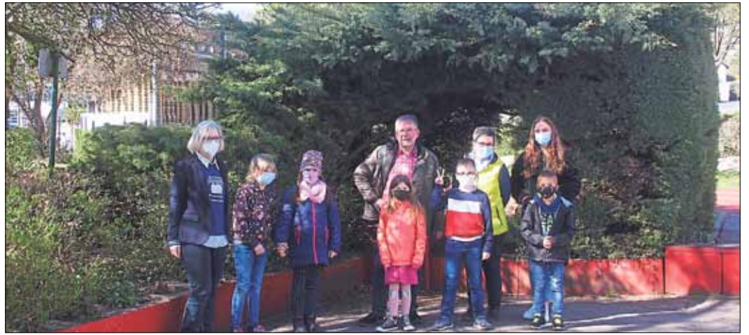
Die Grundschulkindern spielen in den Pausen gern in den Hecken.