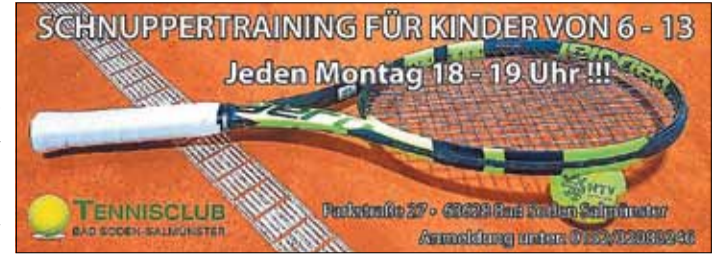
Der Tennisclub Bad Soden-Salmünster lädt Kinder im Alter von sechs bis 13 Jahren zum Schnuppertraining ein.

ellen Corona-Auflagen müsse genügend getestete Trainer bereit- unbeding eine Voranmeldung stehen. Dazu reichen ein Anruf erfolgen, damit die erlaubten oder eine WhatsApp-Nachricht Gruppengrößen eingehalten und an (01 52) 32 08 32 46 völlig aus.