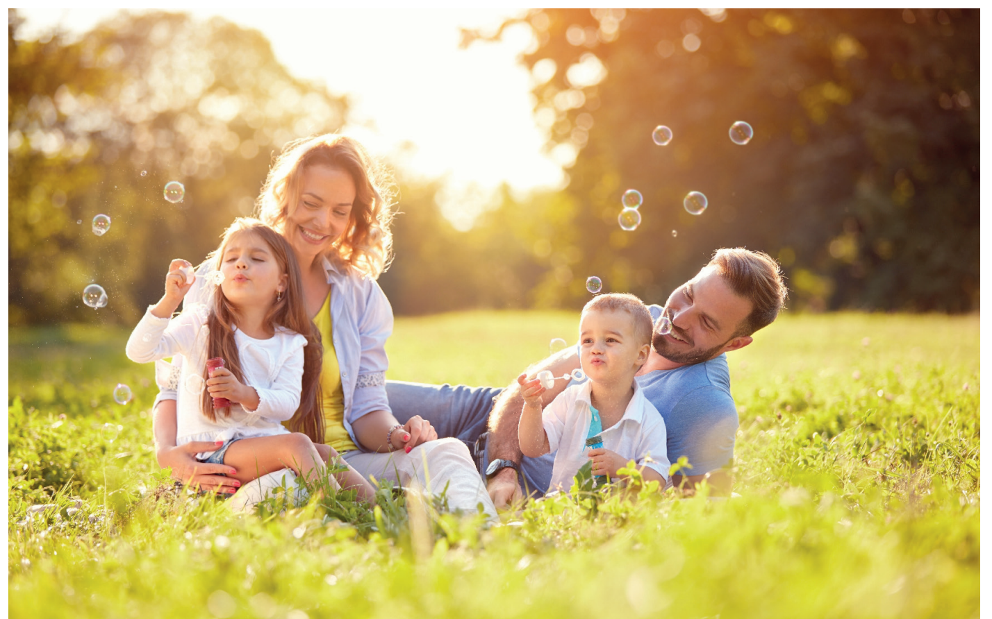
Unsere Familie – unsere Entscheidung. Homöopathie bleibt für uns unverzichtbar.

Dürfen mündige Patienten eine Behandlungsmethode wählen, die sie für sich und andere als wirksam und effektiv erlebt haben? Sollten Krankenkassen nicht Leistungen übernehmen, die den Patienten nutzen und die Gesundheitskosten niedrig halten? Ja, antworten etwa 75 Prozent der deutschen Bevölkerung und blicken verständnislos auf häufig interessengeleitete Versuche, eine beliebte Heilmethode in Verruf zu bringen – die Homöopathie. Denn eine brandneue Studie beweist einmal mehr deren therapeutischen und auch wirtschaftlichen Nutzen. Während weiterhin beein-