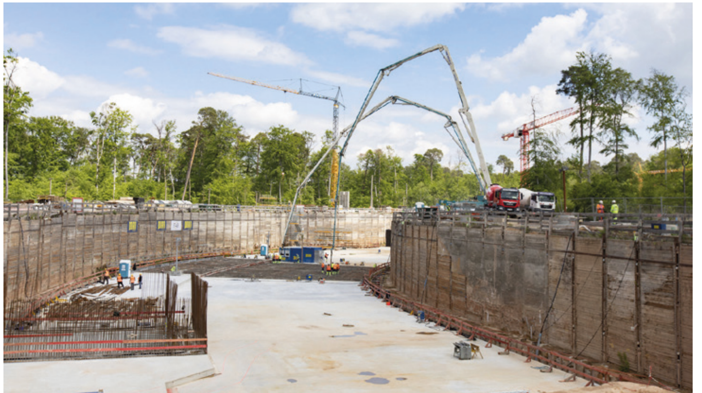
Wo vor wenigen Jahren der erste Spatenstich gesetzt wurde, ist nun ein wichtiger Schritt erreicht: Die Rohbauarbeiten für den SIS100 sind vollendet.

(ip) Er ist ein zentraler Teil des künftigen Beschleunigerzentrums FAIR, das derzeit in internationaler Zusammenarbeit beim GSI Helmholtzzentrum in Darmstadt entsteht, und zugleich das Herzstück eines der größten Bauvorhaben für die Forschung weltweit: der große, 1100 Meter umfassende unterirdische Ringbeschleuniger SIS100 auf dem nördlichen FAIR-Baufeld. Wo vor wenigen Jahren der erste Spatenstich gesetzt und damit der Start der Hoch- und Tiefbauarbeiten markiert wurde, ist nun ein wichtiger Schritt erreicht: Die Rohbauarbeiten für den SIS100 sind vollendet, der Ringschluss der Tunnelanlage ist erfolgt, die Betonage der letzten Tunneldecke gegossen. Der Ringschluss stellt ein wichtiges Etappenziel im Realisierungsablauf des gesamten FAIR-Projekts dar.