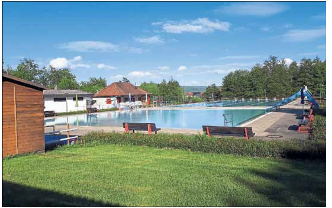
Für den Besuch im Freibad in Schlüchtern können die Badegäste zwischen zwei Zeitfenstern wählen. Die Registrierung der Besucher erfolgt über die App „MyBodyPass“.