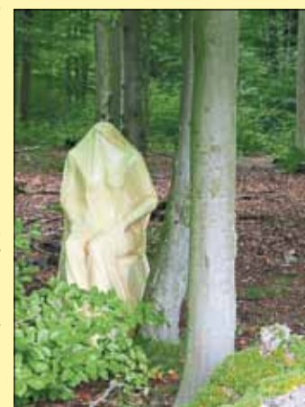
Die Skulpturen mit märchenhaftem Hintergrund entstanden während eines Symposiums am Acisbrunnen.

Weitere Informationen und Angebote sind auch im Internet unter www.naturpark-hessischer-spessart.de zu finden.