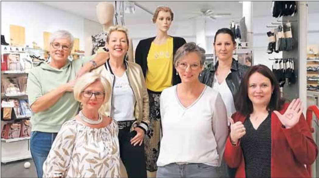
Endlich wieder geöffnet. Das Team von Jeans Shop Rech freut sich darauf, nach fünf Monaten der Schließung wieder Kundinnen und Kunden in modischen Dingen beraten zu können.