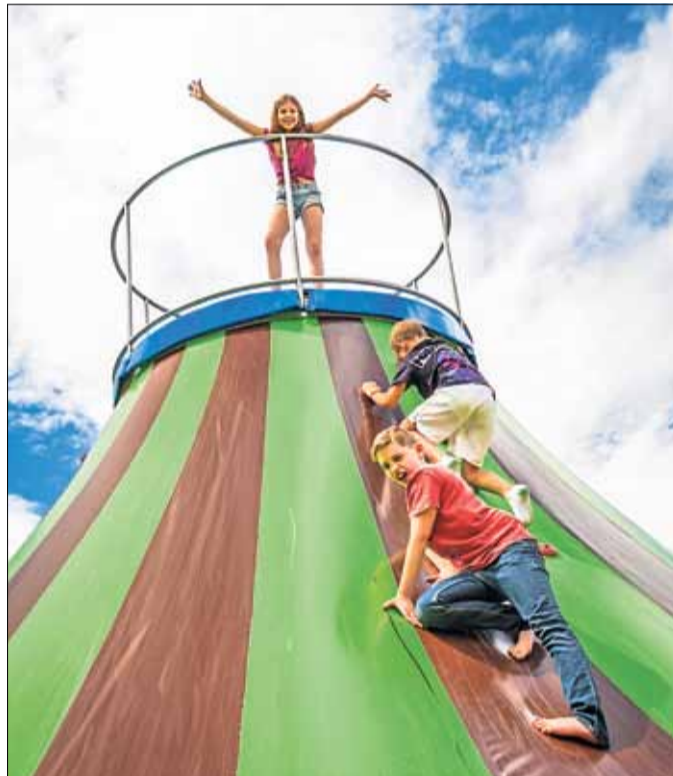
KraxelKegel: Hier geht es für die Kinder hoch hinaus.

„Bei einer möglichen Auslastung von 60 Prozent können rund 3000 Personen in den Erlebnispark. Das ist eine komfortable Ausgangslage“, betonte Theo Zwermann und zeigte sich zuversichtlich, dass „wir auch dieses Jahr wirtschaftlich einigermaßen durch die Pandemie kommen“. Weitere Informationen finden Sie unter „erlebnispark-steinau.de“.