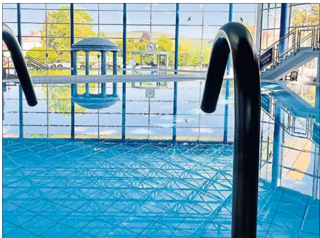
Noch ruhen die Sprudel und Fontänen in der Spessart Therme.