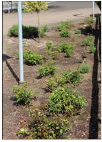
Eines der zahlreichen Beete in der Bellingser Ortsmitte, die von Helfern des Dorfvereins gepflegt werden.

Wandervers getreten und hat von diesem bestimmte Aufgaben übernommen: Die Pflege und In-