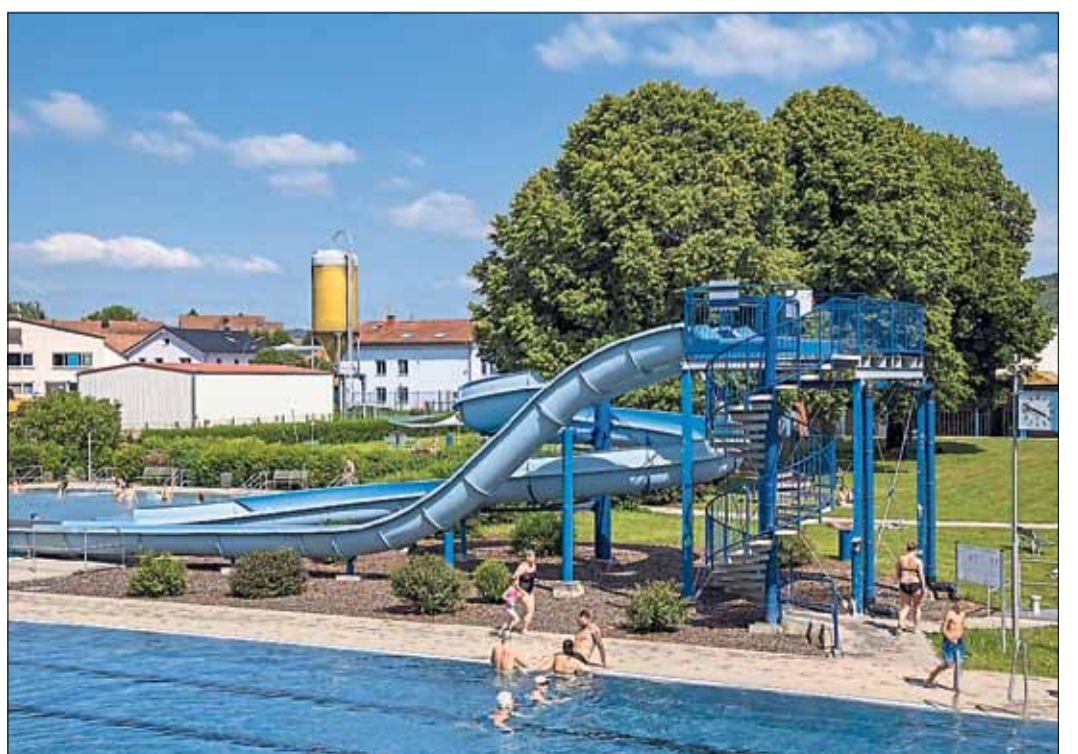
Die Rutschen im Steinauer Schwimmbad, das am kommenden Sonntag seine Türen öffnet, garantieren fröhlichen Badespaß.

Die Kurstadt möchte mit einem besonderen Angebot in der Spessart Therme die Auswirkungen der Freibad-Schließung im Sinne der Familien auffangen. „Für Kinder und Familien wird es dort erneut ein attraktives Angebot während der hessischen Sommerferien in der Zeit vom 19. Juli bis 27. August geben“, erläutert Brasch. „Natürlich unter Vorbehalt und mit Blick auf die aktuelle Corona-Situation.“ Und so wird Maskottchen „Dodi“ auch in diesem Sommer kleine und große Gäste zu den „Familientagen am Wellen-Freibad“ begrüßen. Dienstags und donnerstags gibt es dann noch mehr Wellenspaß, einen Malwettbewerb für Kinder sowie Pommes zu Freibadpreisen für zwei Euro.