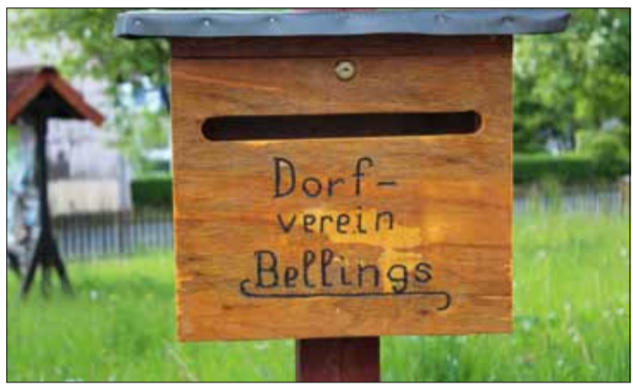
Über solch einen Briefkasten ist neuerdings der Dorfverein Bellings erreichbar.

gunsten gemeinnütziger Zwecke. Schon zu Jahresbeginn ist der neue Dorfverein in die Fußstapfen des Bellingser Heimat- und