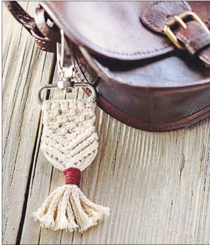
Ein hübscher Hingucker an jeder Handtasche: Der Schlüsselanhänger aus Makramee.