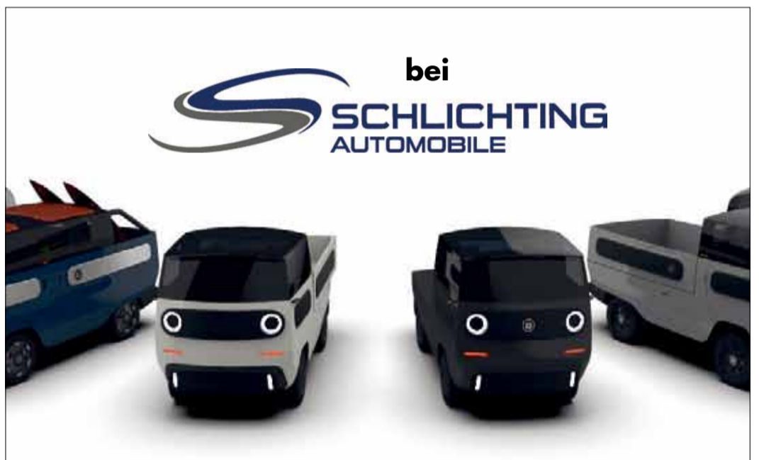
Elektrisch, modular, umweltfreundlich, nachhaltig: der eBussy.

Wer sich einen eBussy unverbindlich vorbestellen möchte, kann dies auf der Seite des Autohaus Schlichting unter www.ebussy-mkk.de tun. Bis zum 31. Mai erhält jeder einen Nachlass von 1000 Euro bei einem Kauf. Ab Juni ist das Fahrzeug vorbestellbar.