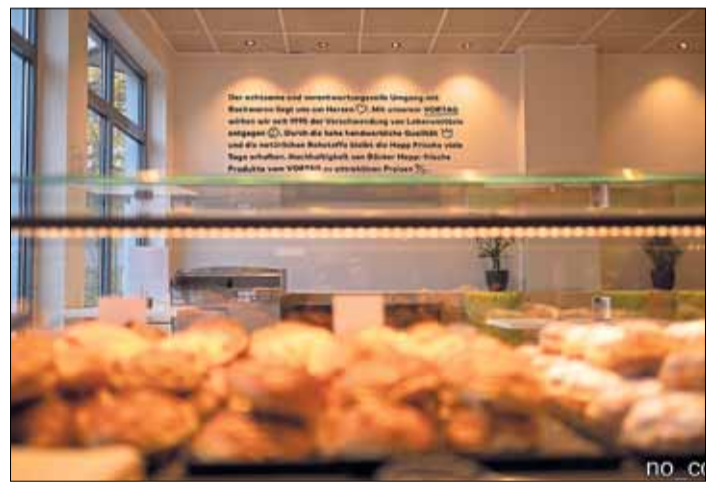
Die Marke „Vortag“ steht für einen verantwortungsvollen Umgang mit Lebensmitteln.