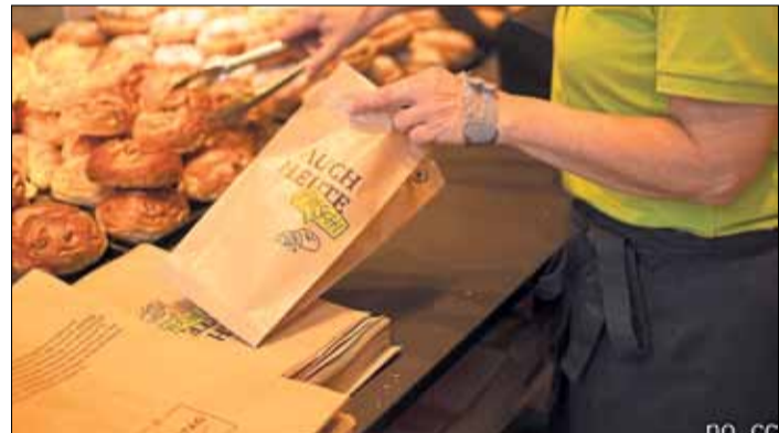
Brot, Brötchen, Kuchen und Gebäcke gibt es im Vortagsladen zur Hälfte des normalen Preises.