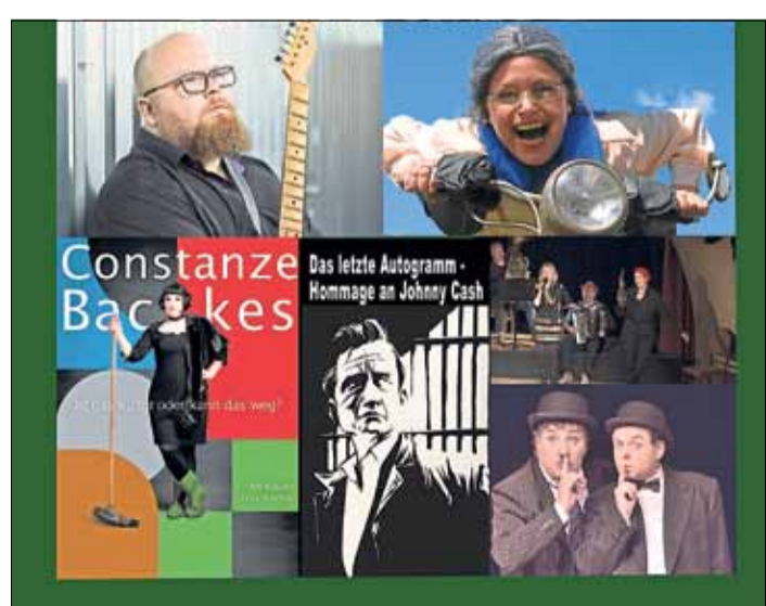
Das Theatrium hat zum „Steinauer Kultursommer Open Air“ ein tolles Programm zusammengestellt, das für jeden Musik- und Kulturinteressierten eine Veranstaltung bereithält.

Ein Höhepunkt im Juli wird die Premiere des Stückes „Das letzte Autogramm – Hommage an Johnny Cash“ am Freitag, 23. Juli, um 20.30 Uhr sein. Als „Man in Black“ wurde Johnny Cash zur lebenden Legende, der trotz tiefster Abstürze immer wieder einen