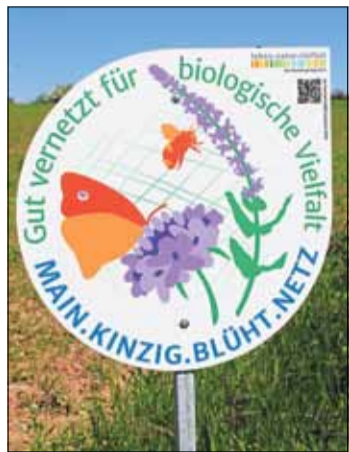
Dieses Schild weist auf die Blühflächen hin.

STERBFRIITZ (FGW). Eine blühende Landschaft sowie eine Verbesserung der Biodiversität sind dem Sterbfritzer Dorfverein „Starwetz lebt“ ein großes Anliegen. Jüngst wurden mehrere Blühflächen angelegt – unter dem Motto „Starwetz pflanzt und sät“.