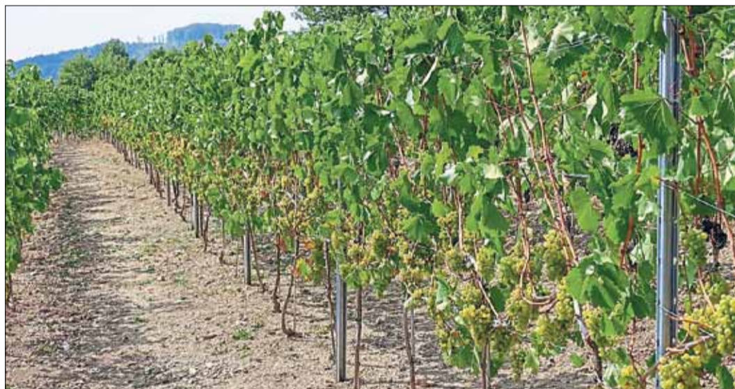
Der Katharinengarten der Weinbruderschaft ist eine Station der dreistündigen Führung.