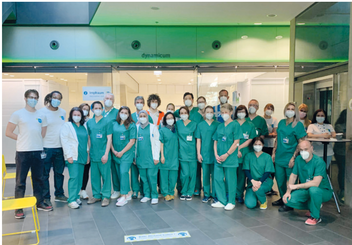
Foto: Mitarbeitende des Impfzentrums, © Wissenschaftsstadt Darmstadt

OB Partsch: „Lob für reibungslose Abläufe“ / Dank an die Mitarbeitenden