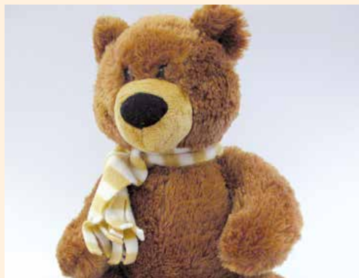
Der plüschige Vorlesestundenhelfer Doktor Brumm hofft auf viele Postkarten von Riedstädter Kindern.

Der Erscheinungstermin der August-Ausgabe des FORUM Magazins ist am 31. Juni 2021