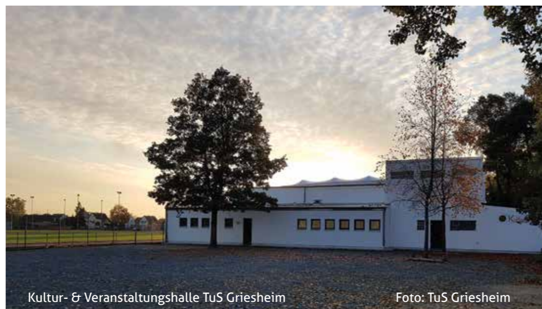
Kultur- & Veranstaltungshalle TuS Griesheim