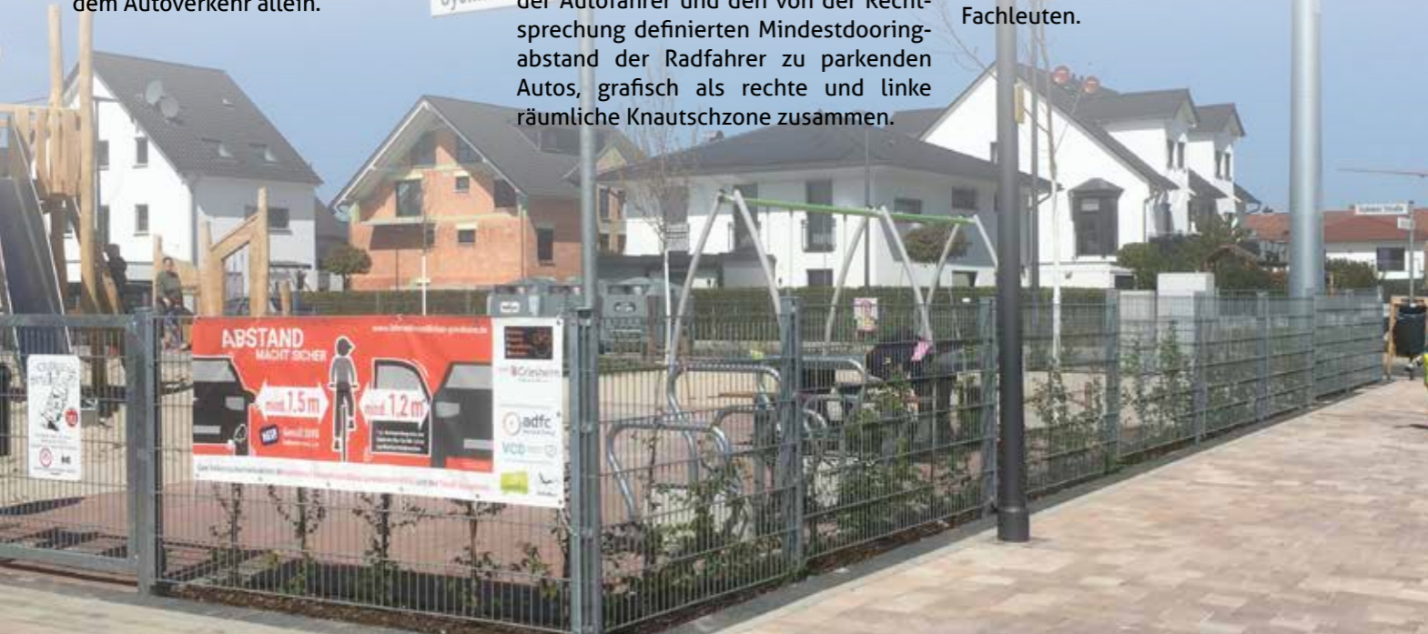
Abstand macht sicher-Banner der IFFG und Stadt Griesheim am Spielplatz Gyönker Straße

Wer mit dem Rad einkauft, der kauft am Ort und stärkt somit den heimischen Handel. Griesheim besitzt aktuell vier Einkaufsmeilen: die Wilhelm-Leuschner-Straße (Stadtzentrum), der südliche