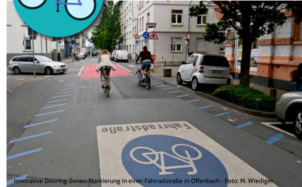
Innovative Dooring-Zonen-Markierung in einer Fahrradstraße in Offenbach

Schäfer in der Flughafenstraße macht vor, wie man es auch als kleiner Laden mit vier einfachen Fahrrad-Anlehnbügeln schon super machen kann. Jeder gute Fahrradparkplatz in Griesheim zeigt: Hier sind Radfahrer willkommen!