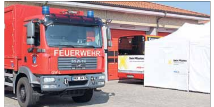
Der Impfbus und die Pavillons der Aktion „Dein Pflaster“ wurden am Samstag für die Sonderimpfkation in Schlüchtern eingesetzt.

Willi-Salzmänn-Halle (Heldenberger Straße 14-16) alle Interessierten eine Erstimpfung mit AstraZeneca-Impfstoff ohne Termin erhalten; neun Wochen später, am 4. September, gibt es für sie dann die Zweitimpfung. Die medizinischen Teams empfangen die Interessierten im Zeitraum von 9 bis 15 Uhr.