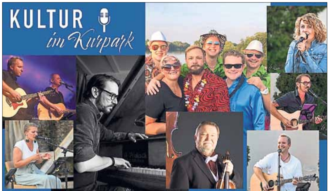
Comedy, Marionettentheater, Kino und ganz viel Musik: das alles verspricht in diesem Sommer die neue Veranstaltungsreihe „Kultur im Kurpark“.

Uhr: Freitagsgebet. Die Predigt wird auf Deutsch und Urdu gehalten. Im Gebetszentrum findet unter anderem täglich um 21.30 Uhr das Abend- und Nachtgebet (Maghrib & Isha) statt.