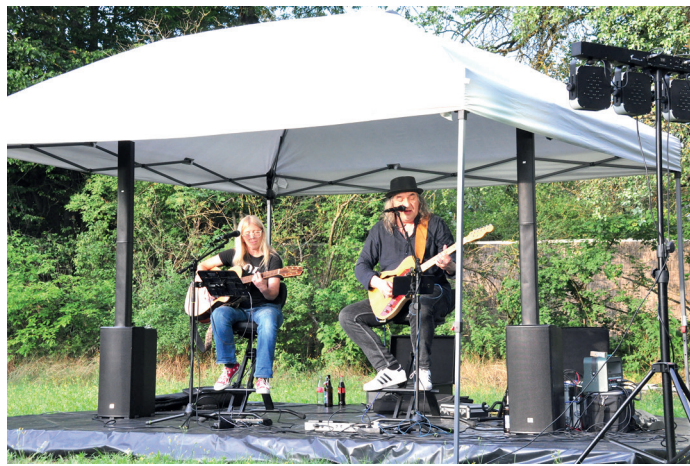
Love on the Rocks: zwei Gitarren, zwei tolle Stimmen und jede Menge »good vibrations«

Nach Verbandstagung am Abend Live-Musik mit »Love on the Rocks«