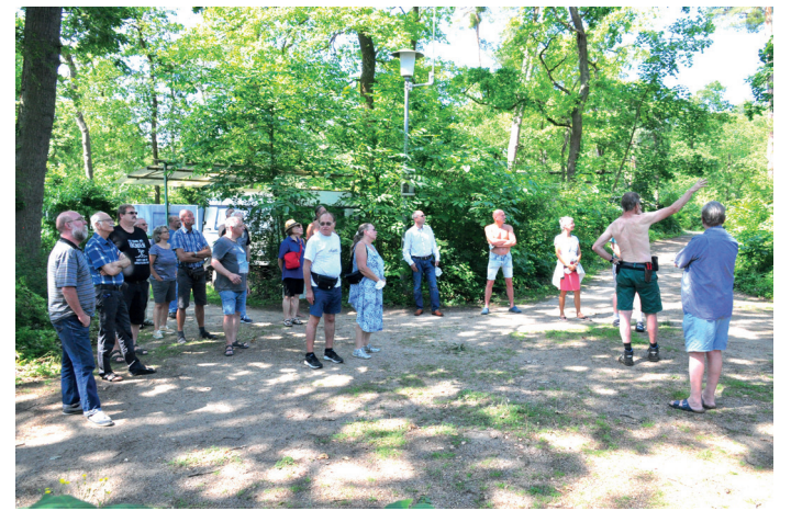
Die Delegierten erhalten beim Rundgang über das Gelände Erläuterungen über die von Stürmen und Trockenheit verursachten Baumschäden.

Fans nicht enttäuscht: Neben den zweistimmig vortragenen Hits aus den 70ern bis 90ern spielten sie diesmal auch eigene Stücke, die sie in der – dank Corona – konzertfreien Zwischenzeit geschrieben haben. Auf der Wiese vor der – in gebührendem Abstand aufgebauten – Bühne wurde dazu fleißig getanzt, zu späterer Stunde wieder illuminiert von Lichterketten und dem Abendhimmel. Dazu gab es Deftiges vom Grill sowie Vegetarisches und Rohkost, alles von Vereinsmitgliedern ehrenamtlich gebrutzelt und geschnippelt. Das ließen sich auch die rund zwei Dutzend Delegierten