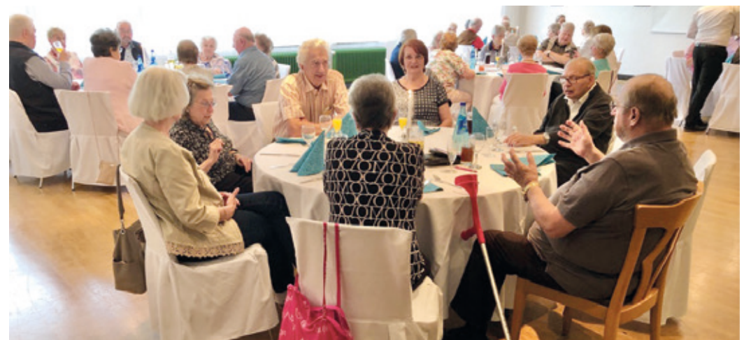
Endlich wieder Stammtisch, zufriedene Teilnehmer an allen Tischen.

Am Donnerstag, 1. Juli 2021 war es endlich soweit, die Senioren Union der CDU in Erzhausen hatte sich mit dem Team der Bürgerhaus-Gastronomie für den 1. Post-Corona Stammtisch auf dieses Datum abgestimmt. Diese Nachricht wurde per Anzeige im Erzhäuser Anzeiger, via WhatsApp und E-Mail unter der Mitgliedschaft verbreitet. Endlich, nach 15 Monate Abstinenz, der letzte Stammtisch fand am 12. März 2020 statt, war es wieder möglich sich in größerer Runde unter Freunden zu treffen, gab es doch viel zu erzählen über die Zeit der, vom Gesetzgeber und Virus erzwungenen, sozialen Distanz zu lieben Freunden und Bekannten. Eine Pandemie ist hoffentlich irgendwann, irgendwo, irgendwann... einmal vorbei – aber dann, irgendwann, irgendwo, irgendwann, sehr wir uns hoffentlich... gesund wieder! Und so war es dann auch, erfolgreich wurde die Mitgliedschaft durch eine enge Kooperation mit der Erzhäuser Heegbach Apotheke mit Masken bedient. Dann war das Thema Herdenimmunität via impfen, ja oder nein oder weiß noch nicht, angesagt. Die Registrierung für Corona Impftermine war für viele Personen teilweise eine logistische Herausforderung, weniger Internet affine Mitglieder der Senioren Union waren froh, wenn