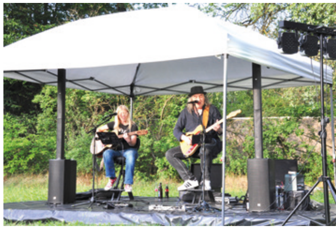
Love on the Rocks: zwei Gitarren, zwei tolle Stimmen und jede Menge »good vibrations«

Nach Verbandstagung am Abend Live-Musik mit »Love on the Rocks«