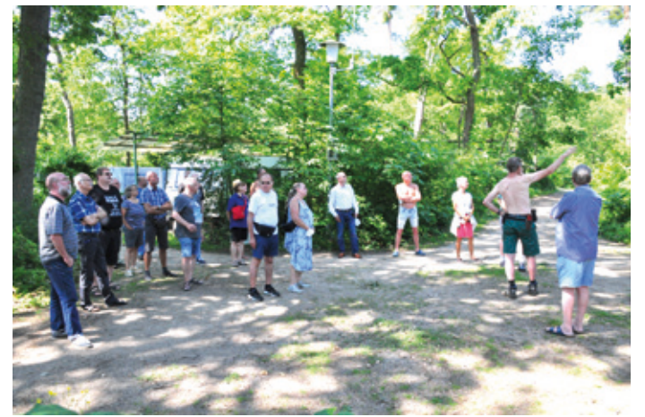
Die Delegierten erhalten beim Rundgang über das Gelände Erläuterungen über die von Stürmen und Trockenheit verursachten Baumschäden.

Fans nicht enttäuscht: Neben den zweistimmig vortragenen Hits aus den 70ern bis 90ern spielten sie diesmal auch eigene Stücke, die sie in der – dank Corona – konzertfreien Zwischenzeit geschrieben haben. Auf der Wiese vor der – in gebührendem Abstand aufgebauten – Bühne wurde dazu fleißig getanzt, zu späterer Stunde wieder illuminiert von Lichterketten und dem Abendhimmel. Dazu gab es Deftiges vom Grill sowie Vegetarisches und Rohkost, alles von Vereinsmitgliedern ehrenamtlich gebrutzelt und geschnippelt. Das ließen sich auch die rund zwei Dutzend Delegierten