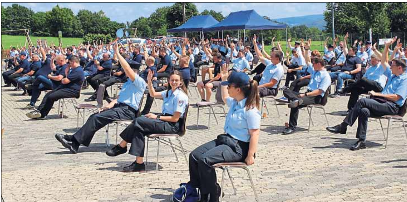
Auf dem Parkplatz des Breitenbacher Gemeinschaftshauses gaben bei der gemeinsamen Hauptversammlung aller Feuerwehren der Stadt Schlüchtern rund 250 Teilnehmer ihr Votum per Handzeichen ab.

Auch ist die Stadtbrandinspektion für die ordnungsgemäße Ausrüstung sowie für die Instandhaltung der Einrichtungen und Anlagen zur Brandbekämpfung und allgemeinen Hilfe zuständig und hat die städtischen Gremien diesbezüglich zu beraten. Unterstützt wird die Stadtbrandinspektion vom Wehrführerausschuss mit den Führungskräften aller Feuerwehren. In diesem Gremium werden sämtliche Angelegenheiten des Brandschutzes koordiniert.