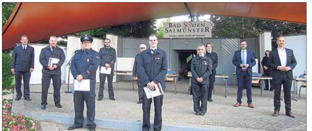
Mitglieder der Jugendfeuerwehr erhielten eine Florian-Medaille für aktive Dienstjahre.