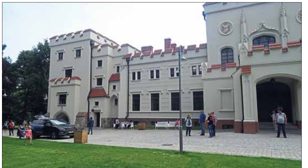
Unser Bild zeigt das im Stadtgebiet von Jarocin gelegene, gerade restaurierte Schloss des Fürsten Hugo von Radolin, der in mehrere Positionen im preußischen diplomatischen Dienst tätig war.

Ein Höhepunkt der Studien- und Begegnungsreise ist der gesellige „Schlüchtern-Jarociner Abend“, zu dem die Gäste aus Schlüchtern traditionsgemäß am Abend vor der Heimreise ihre polnischen Gastgeber zu einem unterhaltsamen, kurzweiligen Gedanken- und Meinungsaustausch einladen. In diesem Jahr werden Stadtverordnetenvorsteher Joachim Truss sowie Stadtrat Reinhold Beier Schlüchtern offiziell repräsentieren. Vorherrschende Themen werden sich dabei auf die Intensivierung des weiteren Austausches zwischen den beiden Städten beziehen. Eine besondere Bedeutung kommt dabei der Erweiterung des Austausches zwischen den Schulen zu sowie der verstärkten Förderung des Austausches auf der Ebene der Sportvereine. Was hier noch ausbaufähig ist, ist im Bereich der Feuerwehren bereits bestens gelungen.