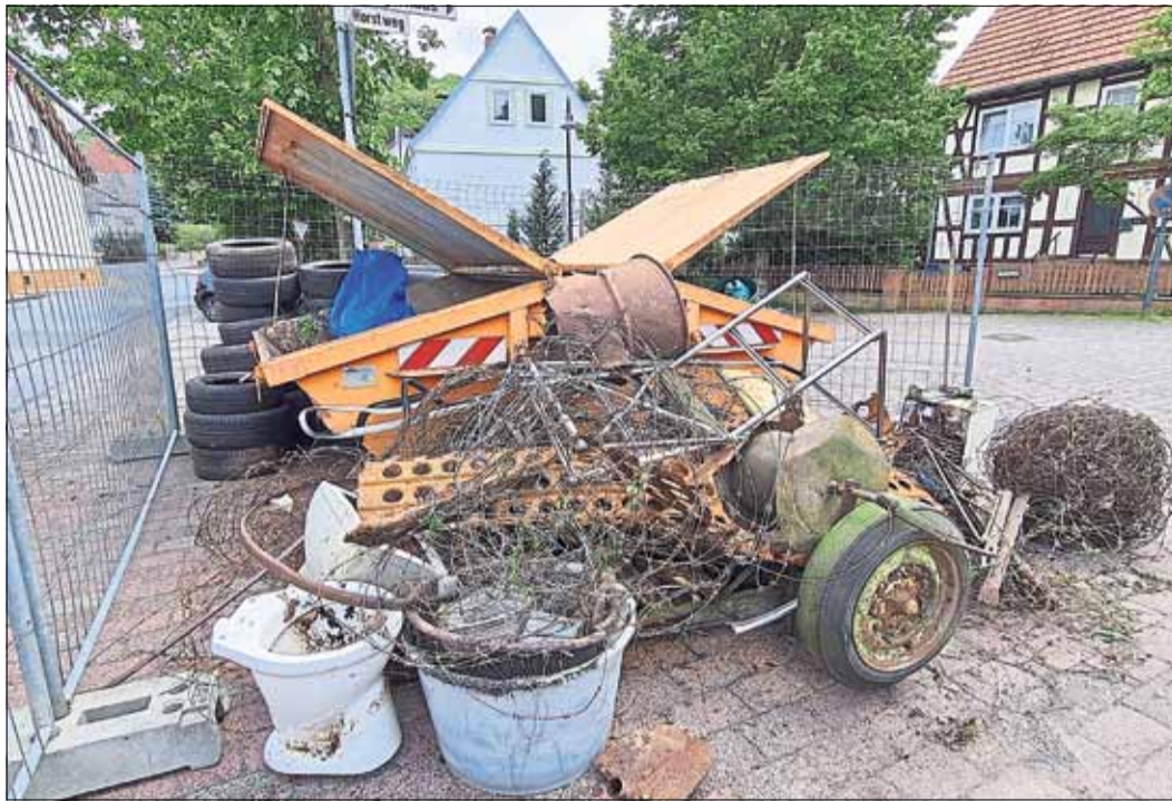
Ein Teil des Unrats, der bei der Aktion „Sauberes Bellings“ von zahlreichen Helfern eingesammelt wurde.

Zum Abschluss gab es für die zahlreichen Helfer eine Ver-