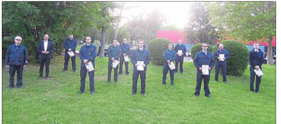
Etliche Wehrleute wurden zu Führungskräften befördert.