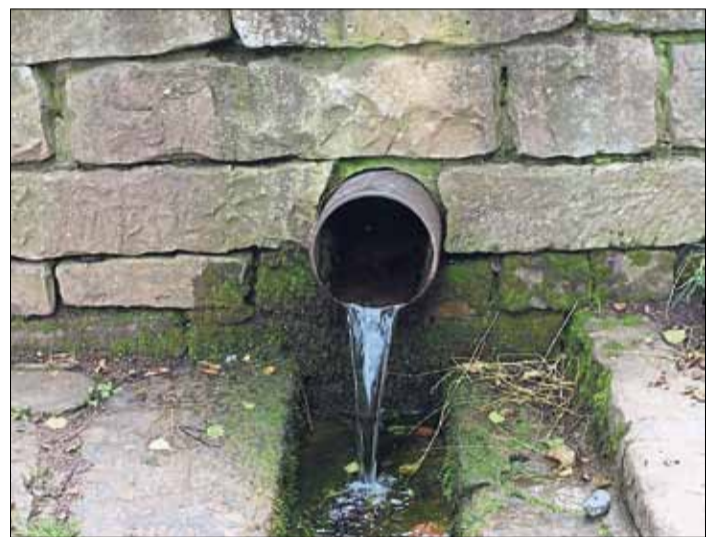
Die Kinzig-Quelle in Sterbfritz, deren Areal der Dorfverein aufwerten will.

Die Förderung von Kunst und Kultur gehört weiterhin zu den satzungsgemäßen Aufgaben des Sterbfritzer Dorfvereins, ebenso die Erforschung und Pflege der Heimatgeschichte sowie die Förderung der Dorfgemeinschaft.