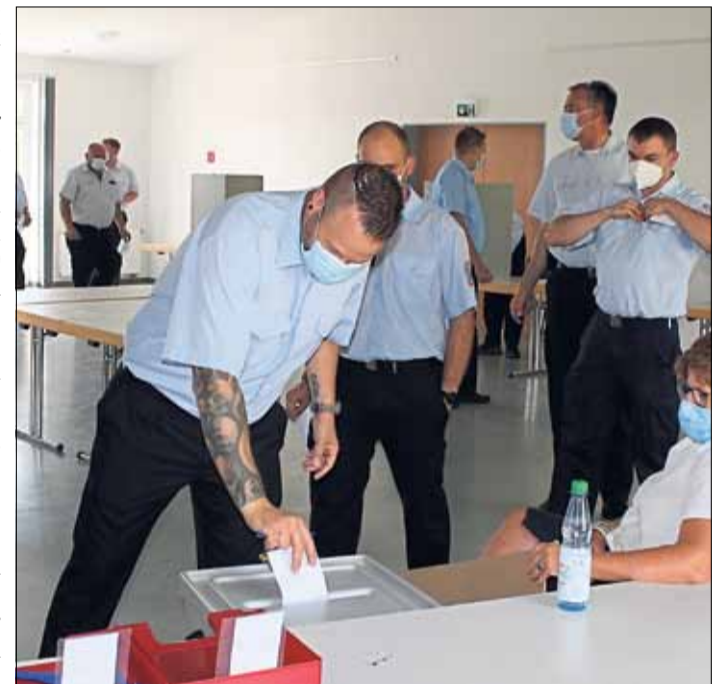
Die Wahl des Stadtbrandinspektors erfolgte in geheimer Wahl. Im Breitenbacher Gemeinschaftshaus waren Wahlkabinen und die Wahlurne aufgestellt.