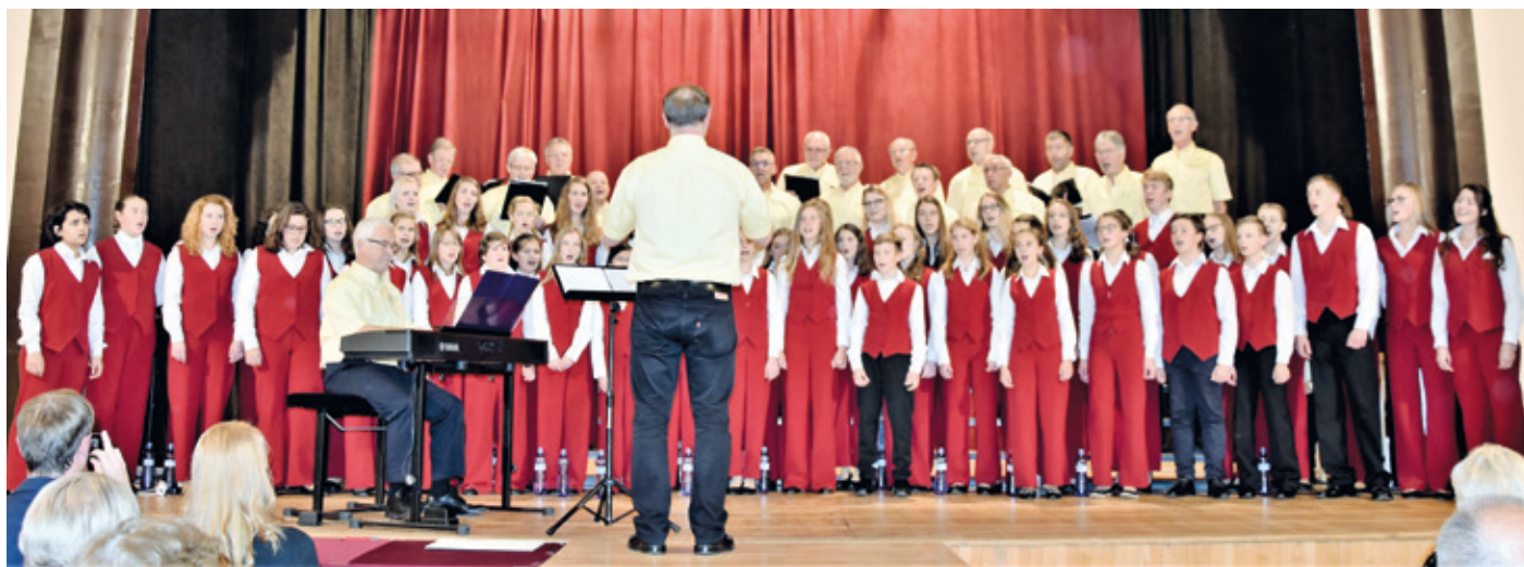
Das Foto zeigt den Zvonky-Chor und die Erzhäuser Sänger am 20. Oktober 2017 bei einem gemeinsamen Auftritt in Mnichovo Hradiste.

Männerchor und Partnerschaftsverein Erzhausen freuen sich auf ein Wiedersehen