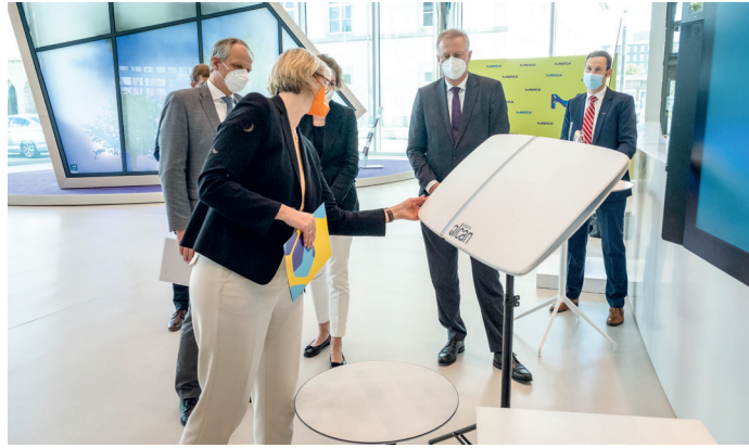
Anja Karliczek beim Gespräch über unsere flüssigkristallbasierte Lösung für smarte Antennen, die zuverlässige Internetverbindungen selbst in den entlegensten Gebieten der Welt ermöglicht.