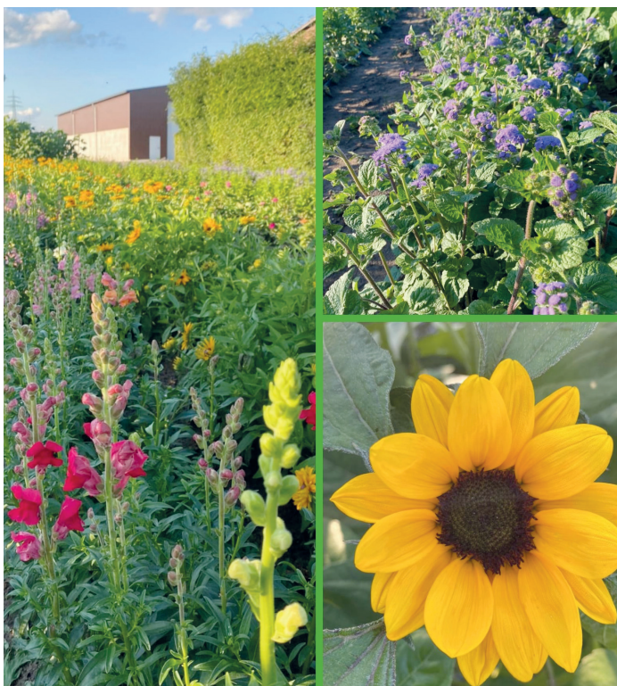
(mb) Das Sommerblumenfeld beim Bauernladen Benz lässt wieder Herzen höher schlagen. Zum Selberschneiden oder gebundene Sträuße im Hoffladen. Holen Sie sich den Sommer in seiner Farbenpracht nach Hause.