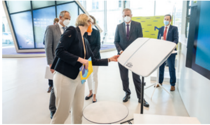
Anja Karliczek beim Gespräch über unsere flüssigkristallbasierte Lösung für smarte Antennen, die zuverlässige Internetverbindungen selbst in den entlegensten Gebieten der Welt ermöglicht.