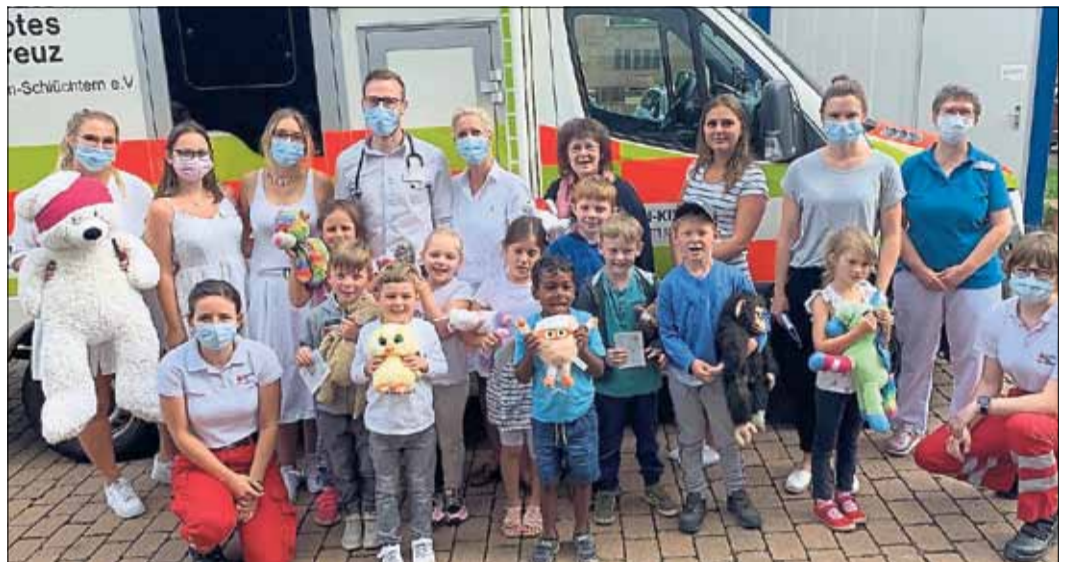
Bei diesem Termin hatten alle Spaß: Kinder, Erzieherinnen, das Hausärzte-MKK-Team sowie die Sanitäter der Rettungswache Bad Soden-Salmünster.