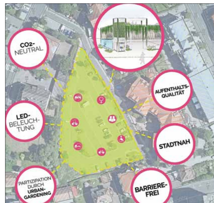
Die Graphik zeigt, wie die Aufteilung der Parkplätze erfolgen wird.

Denn irgendwann solle auch einmal Schluss mit den Bauprojekten sein: „Es muss dann auch mal wieder Ruhe einkommen.“ Der Bürgermeister macht auch klar, dass das Parkhaus finanziell kein Risiko darstellt. „Das ist für uns kein Abenteuer, sondern klar kalkuliert. Wir haben in den vergangenen Jahren gut gewirtschaftet und pfeifen nicht aus dem letzten Loch.“