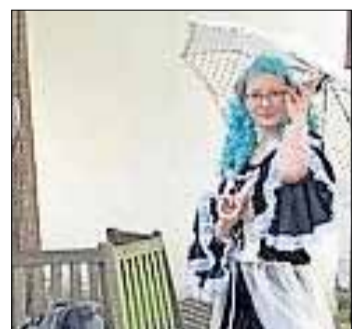
Auch in 2013 gab es ein Märchenspiel – hier eine Szene daraus.