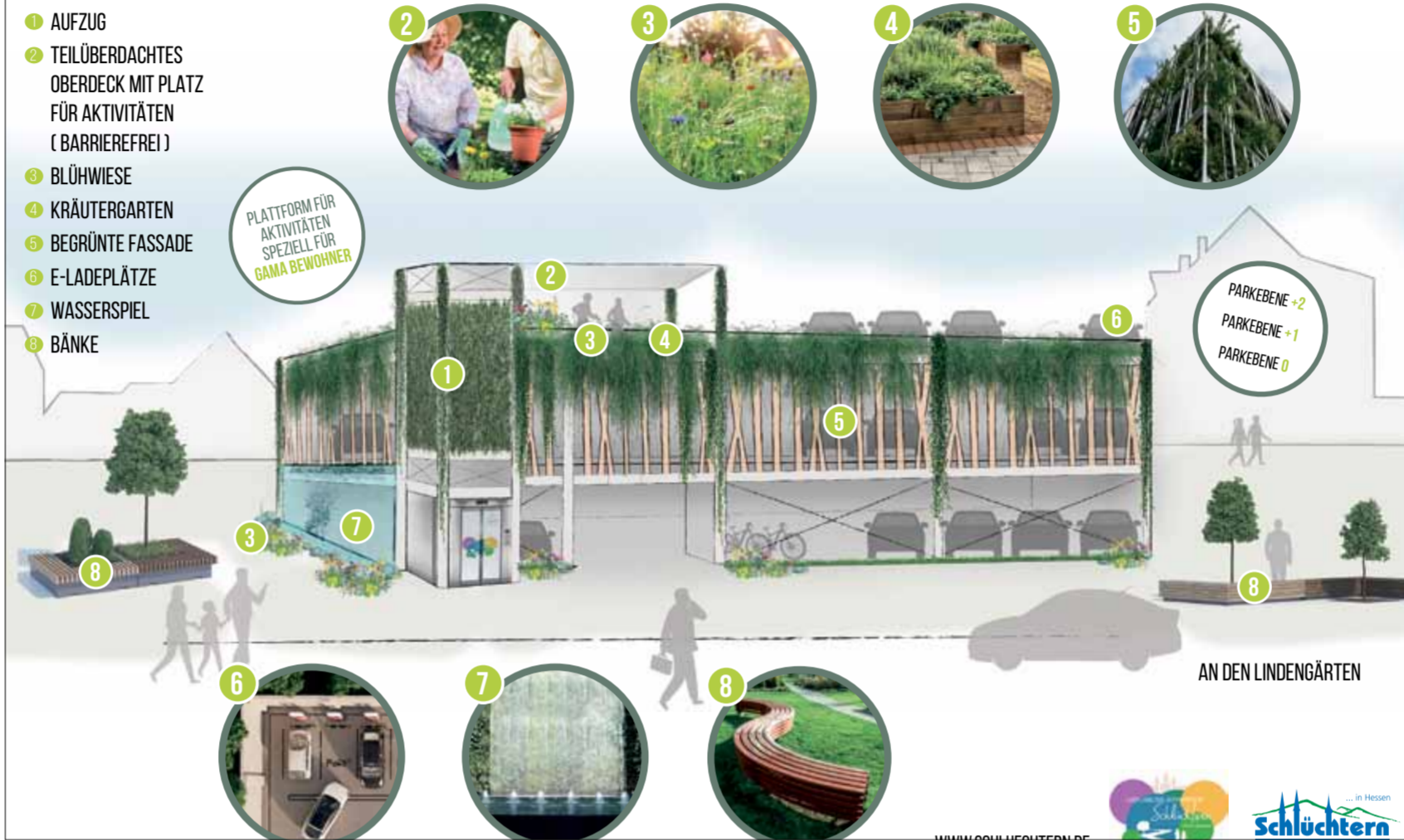
In der Visualisierung ist gut sehen, wie das Parkhaus auf dem „Heinlein“-Gelände aussehen soll. Angedacht sind drei Ebenen mit 180 Stellplätzen. Viele klug durchdachte Details wie Blühwiesen, Kräutergärten und ein Wasserspiel sorgen dafür, dass ein Parkhaus mit viel Grün entsteht.