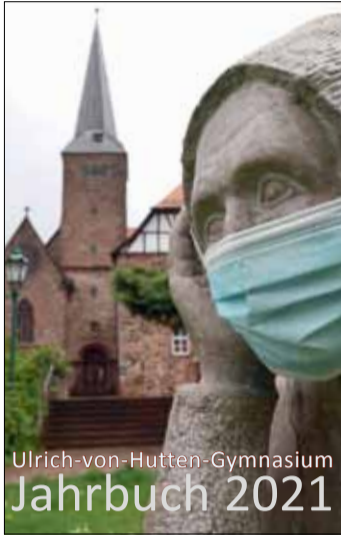
Ulrich-von-Hutten-Gymnasium Jahrbuch 2021 Die Pandemie hinterlässt Spuren – das symbolisiert die Maske weltweit grassierenden Corona-Pandemie.

Die nun erschienene 67. Ausgabe steht somit in einer langen Tradition. Und dennoch ist diese Ausgabe eine besondere, die man auch noch in vielen Jahren staunend in die Hand nehmen kann, um sich zu erinnern, was Schule vor dem Hintergrund einer weltweit grassierenden Corona-Pandemie bedeutet hat.