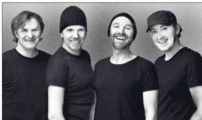
Europas gefragteste Coldplay-Tribute-Band verspricht ein erstklassiges Konzerterlebnis.