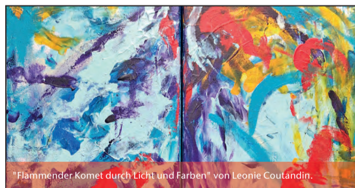
„Flammender Komet durch Licht und Farben“ von Leonie Coutandin.

Info: 1. OG des Goebelhauses Goebelstraße 21, 64293 Darmstadt Öffnungszeiten sind Mo-Fr. 9-16 Uhr plus drei offene Sonntage (18.7./22.8./26.9. jeweils 11-15 Uhr). Laufzeit der Ausstellung: 12.07.2021 bis 08.10.2021